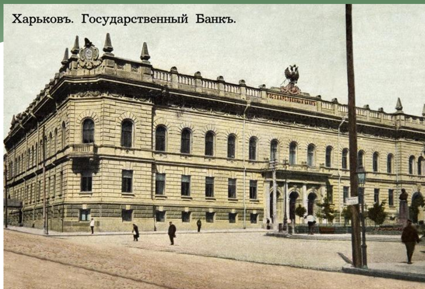
Харьковъ. Государственный Банкъ.