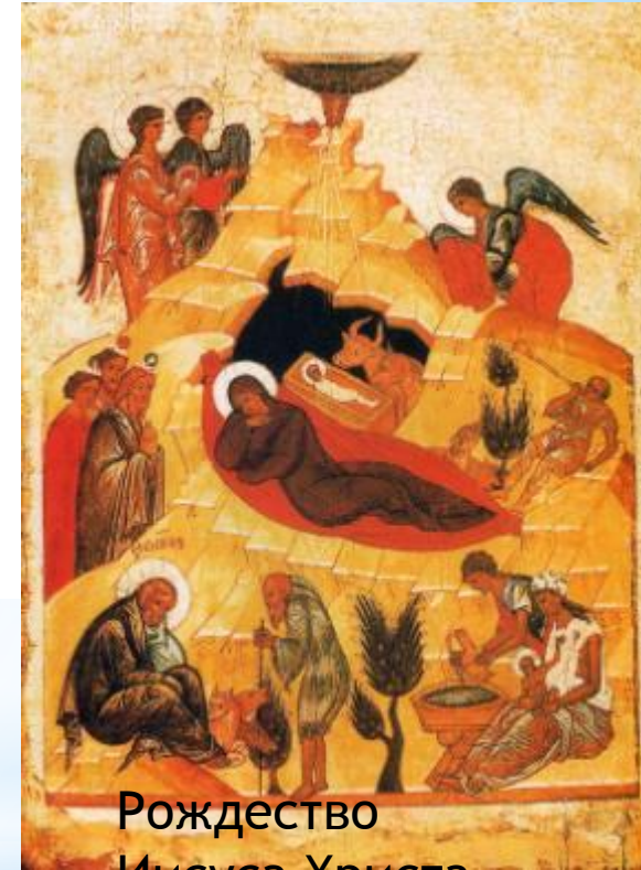
Рождество Иисуса Христа

Можно молиться и без иконы. Но икона помогает собраться с мыслями. Можно молиться о людях и зверях. О друзьях и врагах.