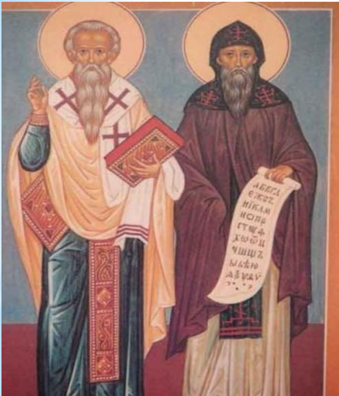
СВЯТЫЕ БРАТЯ КИРИЛЛ И МЕФОДИЙ