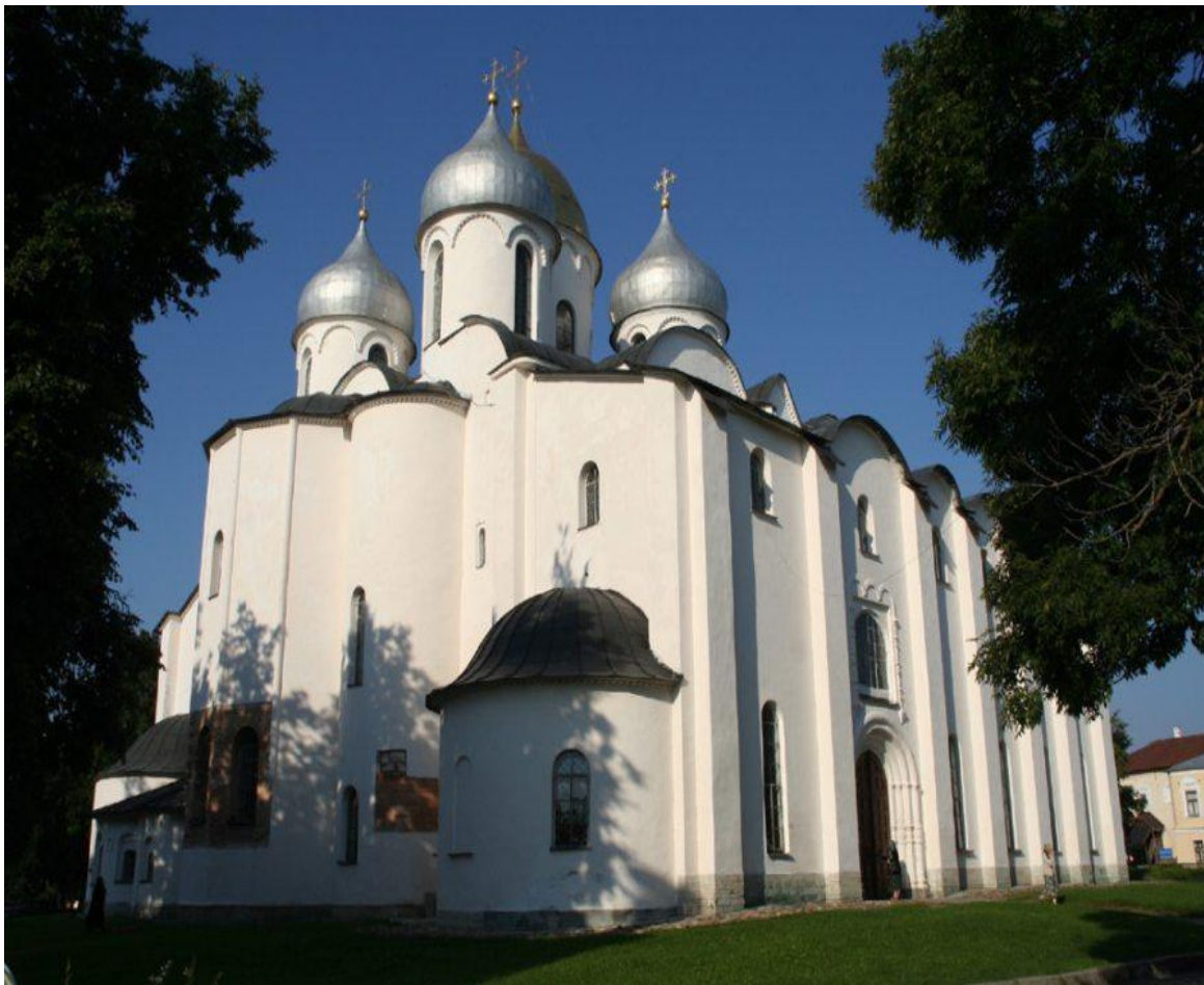
Софийский собор в Новгороде. 1045—1050. Вид с северо-восточной стороны

Причины таких изменений зачастую выходят за рамки истории собора и указывают на природные катаклизмы или значимые изменения в политической, военной, духовной жизни города. Несмотря на произошедшие изменения, храм сохранил свой первоначальный вид.