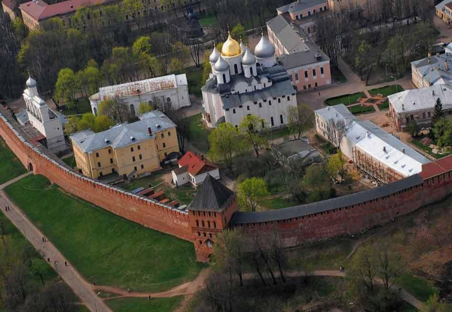
Софийский собор в Новгороде. 1045—1050. Общий вид