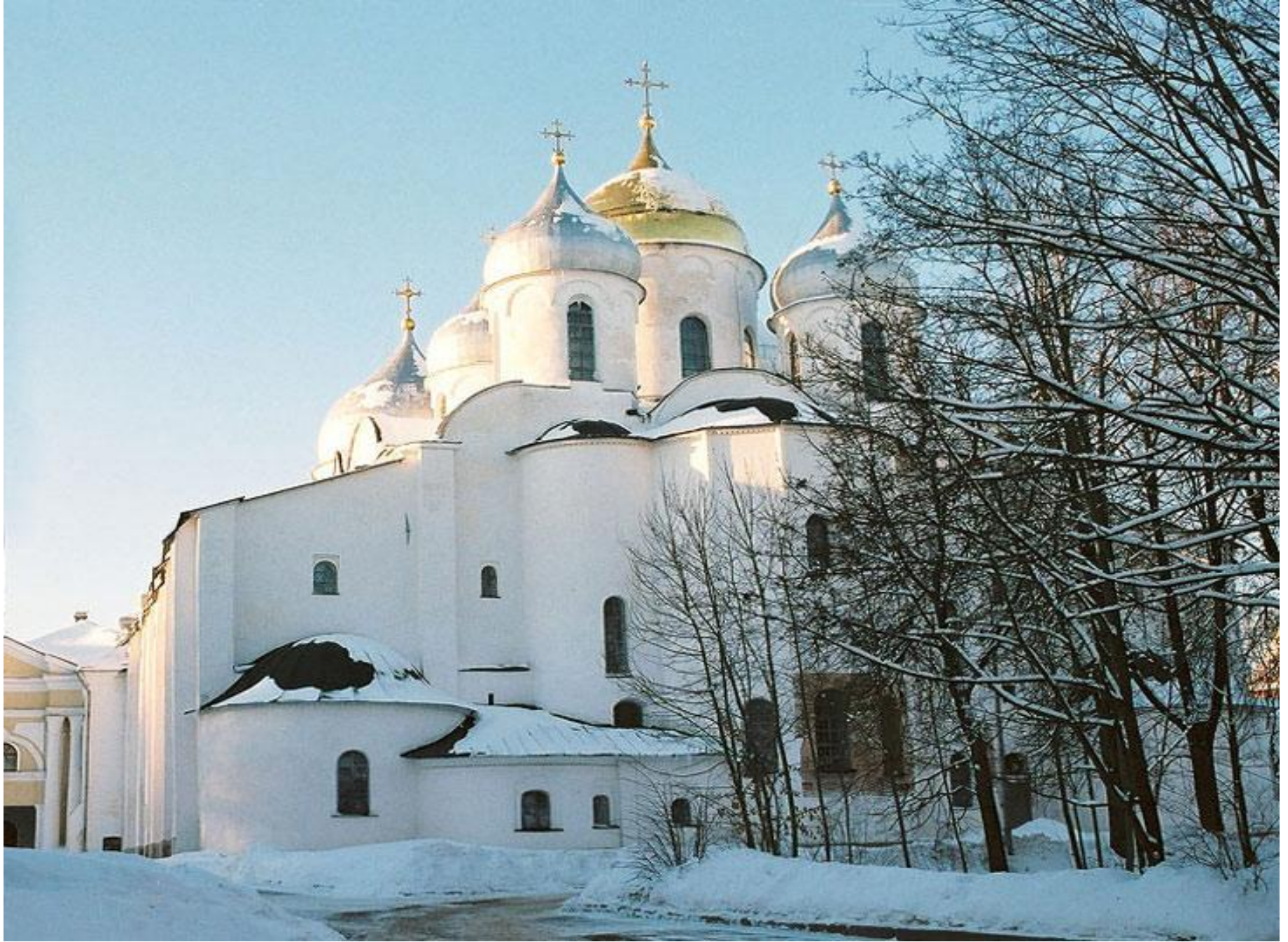
Софийский собор в Новгороде. 1045—1050. Восточный фасад