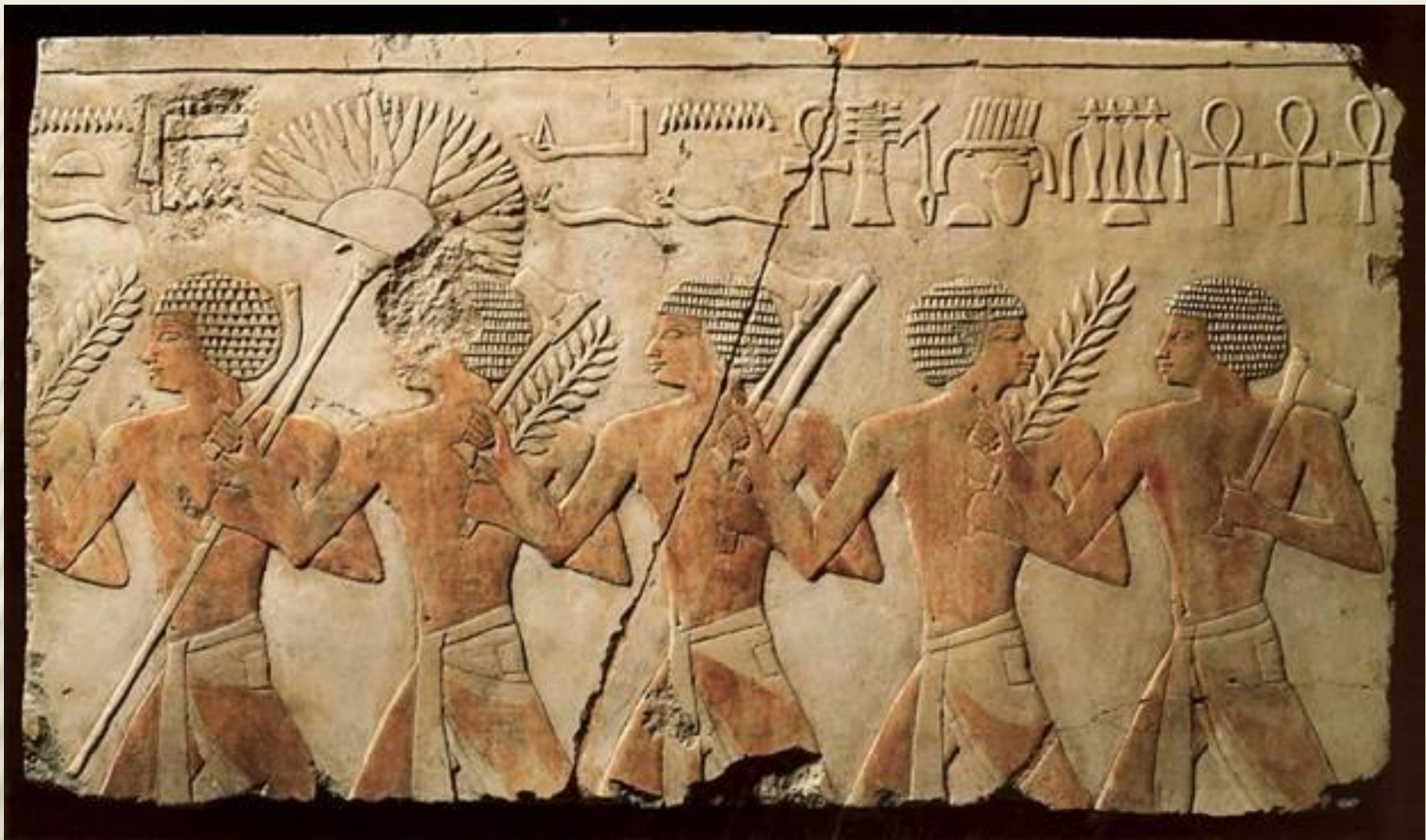
Храм Хатшепсут: рельеф нижней террасы с изображением воинов