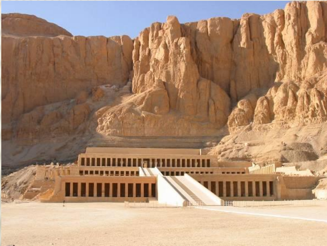
Храм царицы хатшепсут

Один из них – заупокойный храм царицы Хатшепсут , расположенный у подножия скал Дейр эль-Бахри (1525—1503 гг. до н. э.), посвящённый богине Хатхор.