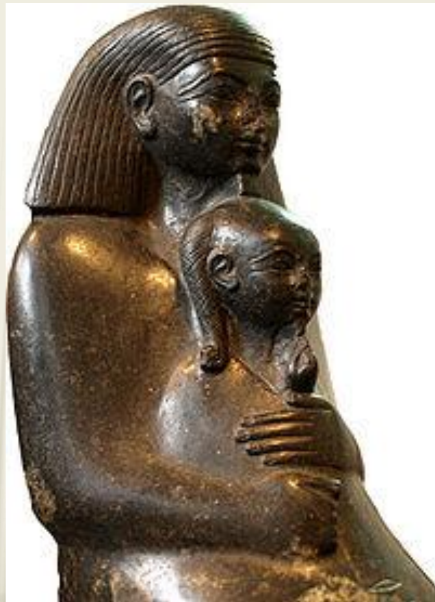
Скульптурный портрет, изображающий сидящего Сенмута с Неферура на руках. Британский музей

Его строил придворный архитектор Сенмут. Возводя храм, Сенмут заготовил в нем тайную гробницу и для себя, и оставил в одном из потаенных уголков храма свой портрет.