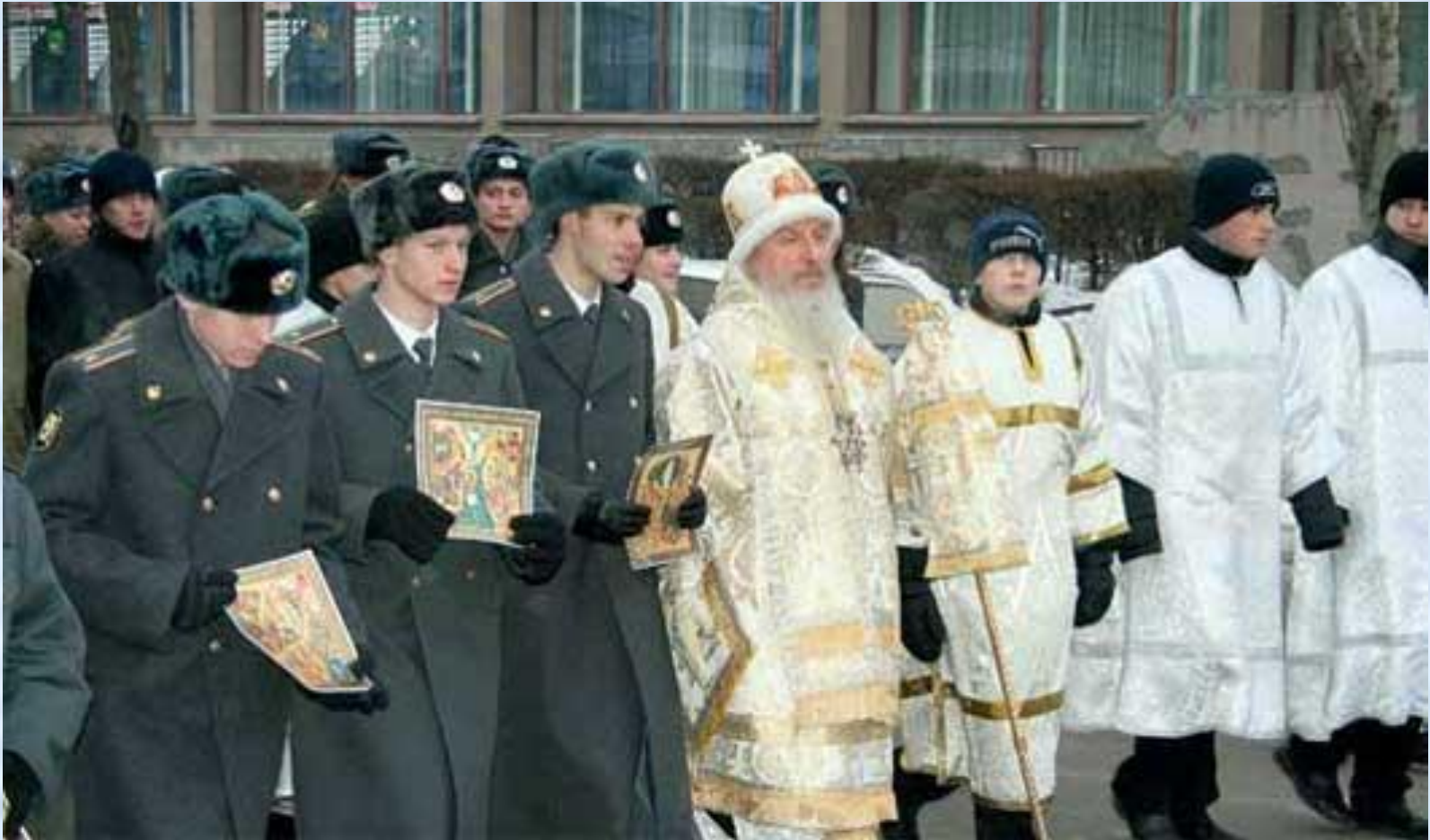
Архиепископ Тобольский и Тюменский Димитрий с курсантами института во время Крещенского крестного хода