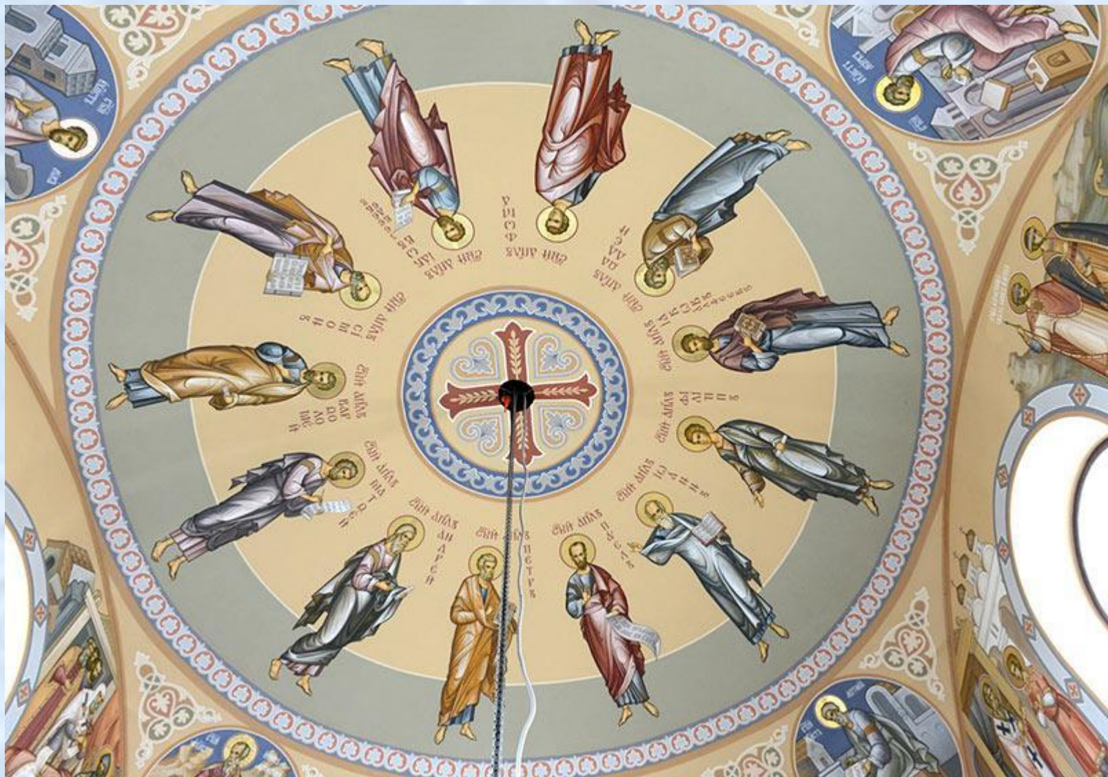
Роспись храма св. Александра Невского города Салехарда