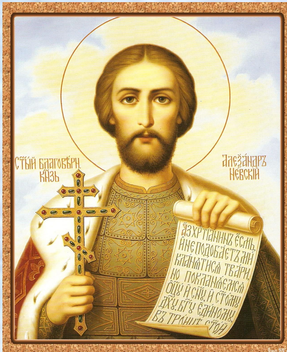
СВЯТОЙ БЛАГОВЕРНЫЙ КНЯЗЬ АЛЕКСАНДР НЕВСКИЙ