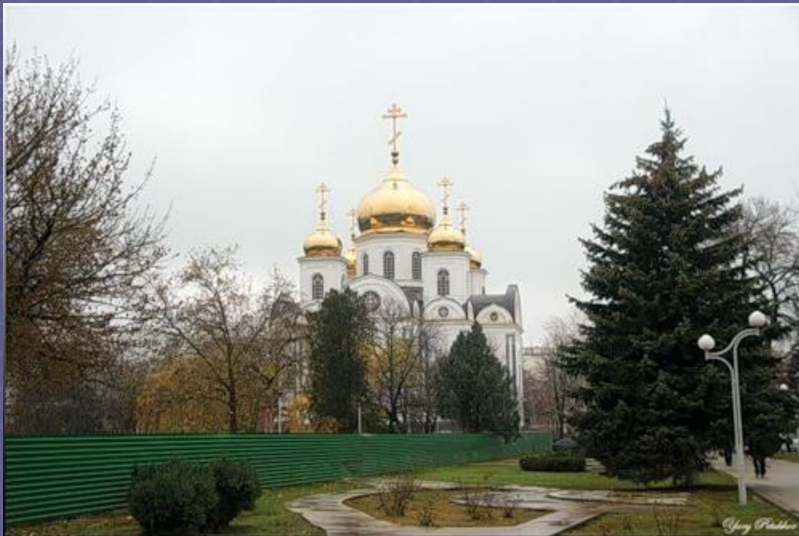
Войсковой собор св. Александра Невского