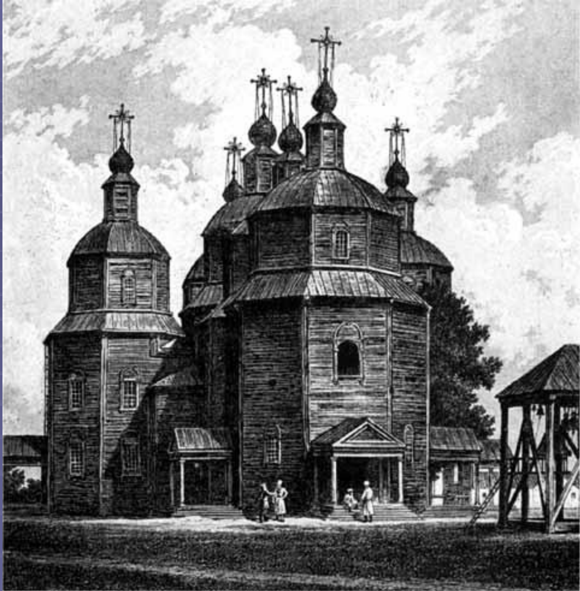
Первый войсковой собор во имя Воскресения Господня, освящен 5 октября 1802 года, г. Екатеринодар