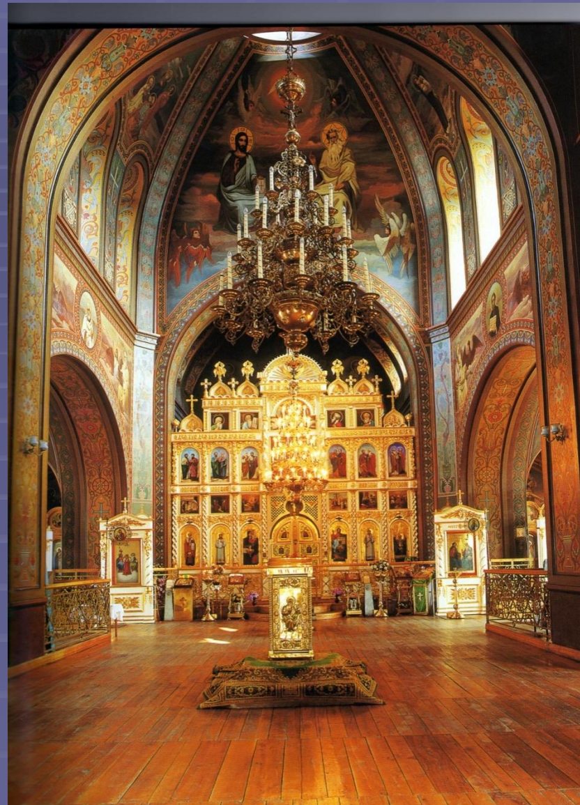
Свято-Троицкий собор , освящен 7 июня 1910 г. Архитектор Мальгерб И. К.