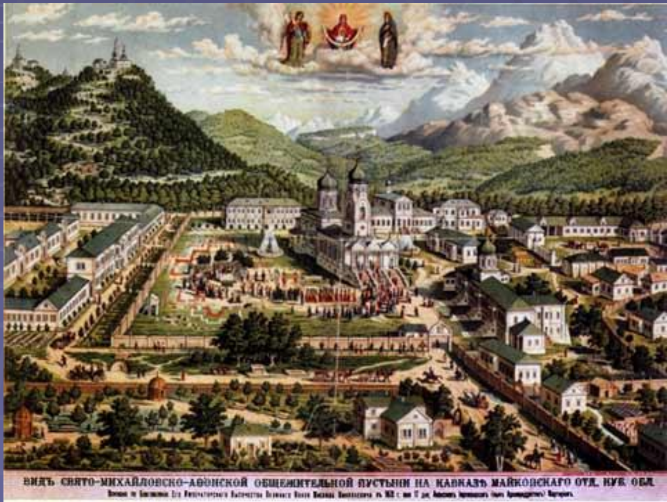
ВНДЪ СЯГО-МИХАЙЛОВСКО-АФОНСКОЙ ОБЩЕЖИТЕЛЬНОЙ ПУСТЫНИ НА КАВКАЗЪ МАЙКОПСКАГО ОУД. КЪВ. ОБЛ. Выданъ въ Царскомъ Селѣ Императорскою Академіею Искусствъ 1882 г. въ 17 дѣл. Академія Императорскихъ Академическихъ Наукъ.

Располагалась пустынь на северном склоне Кавказских гор, в 45 верстах к юго-востоку от г. Майкопа, у подножия горы Физабхо, недалеко от станицы Царской.