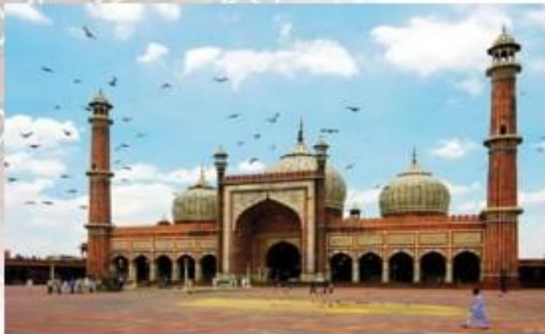
Мечеть Джами Маджида