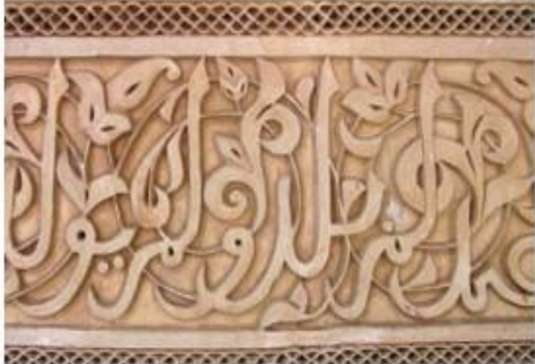
Каллиграфический орнамент. Марокко