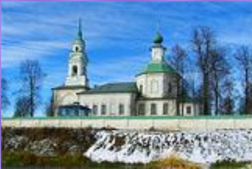
Церковь Преображения за Волгой. г. Кострома