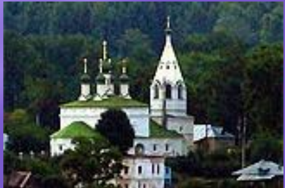
Церковь Спаса Нерукотворного образа на Запрудне. г. Кострома