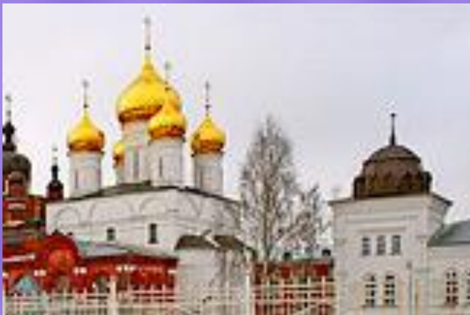
Собор Богоявления Господня. Г. Кострома