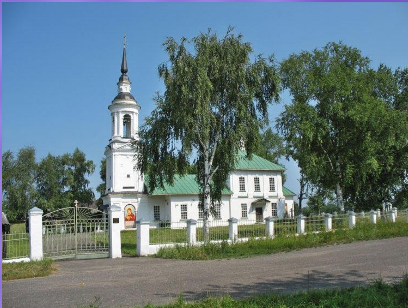
Воскресенская церковь. г. Буй