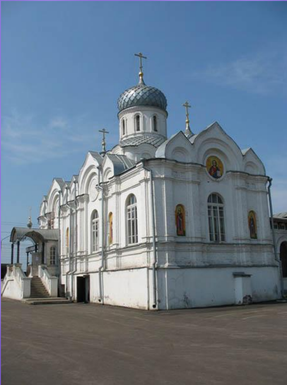
Николаевская церковь. г. Буй