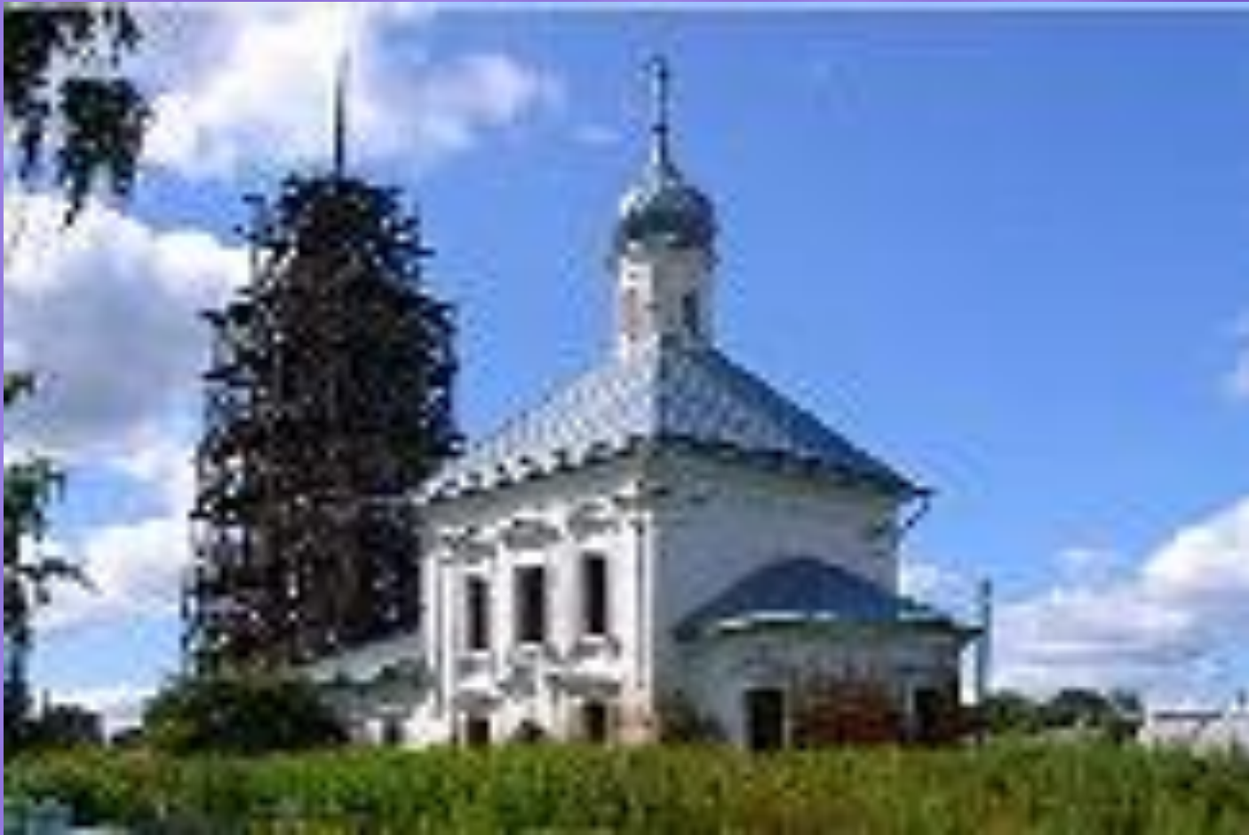
Богоявленская церковь. с. Ковалево Нерехтского р-на