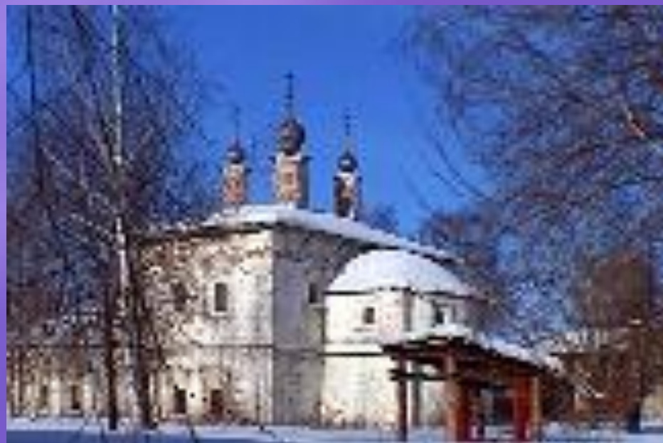
Церковь Богоявления Господня. Г. Галич