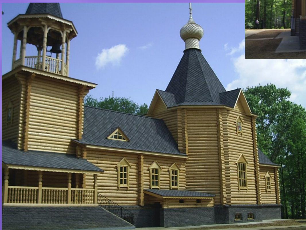
Свято-Никольский храм. г. Шарья