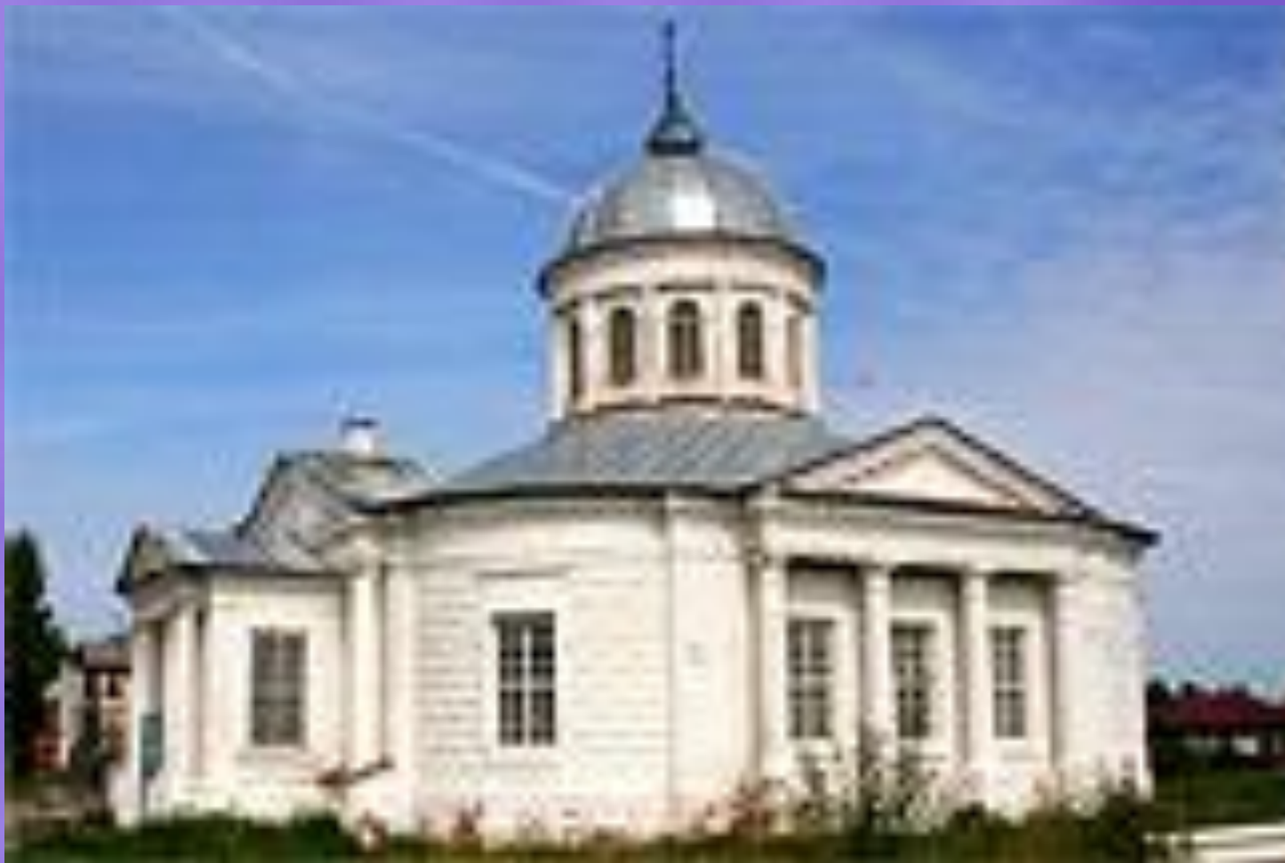
Церковь Спаса Преображения. г. Солигалич