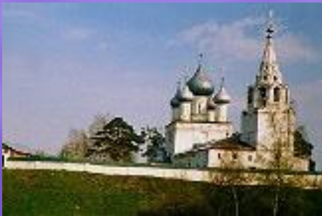
Троице-Сыпанов женский монастырь. с. Троица Нерехтского р-на