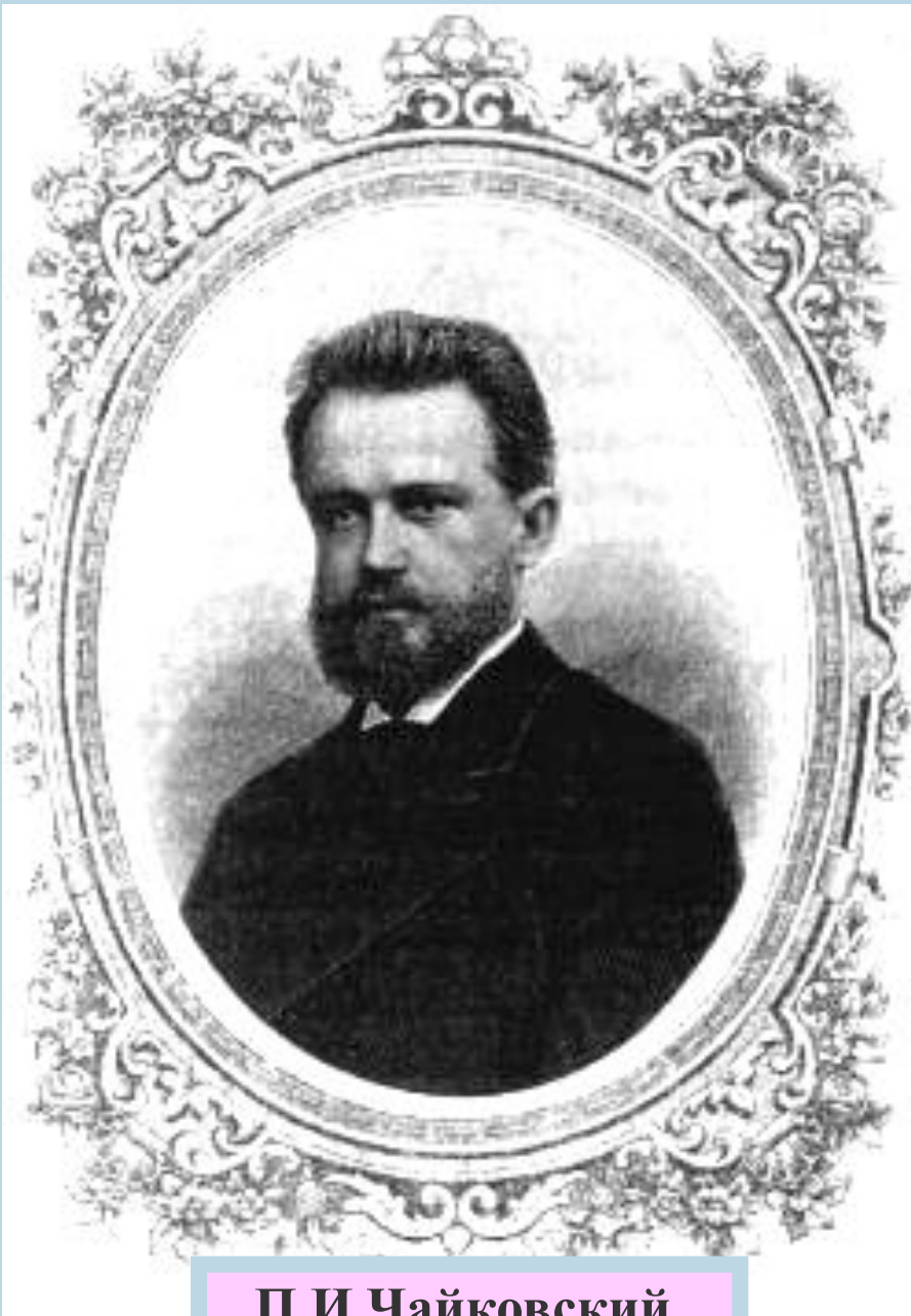
П.И.Чайковский. Фотография 1860 г.

Величайший вклад в сокровищницу мирового музыкального искусства внес П.И.Чайковский. Его оперы «Евгений Онегин», «Пиковая дама», балеты «Лебединое озеро», «Спящая красавица» и др. составляют гордость репертуара крупнейших театров во всем мире.