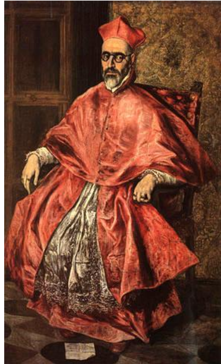
Св. Иероним в образе кардинала