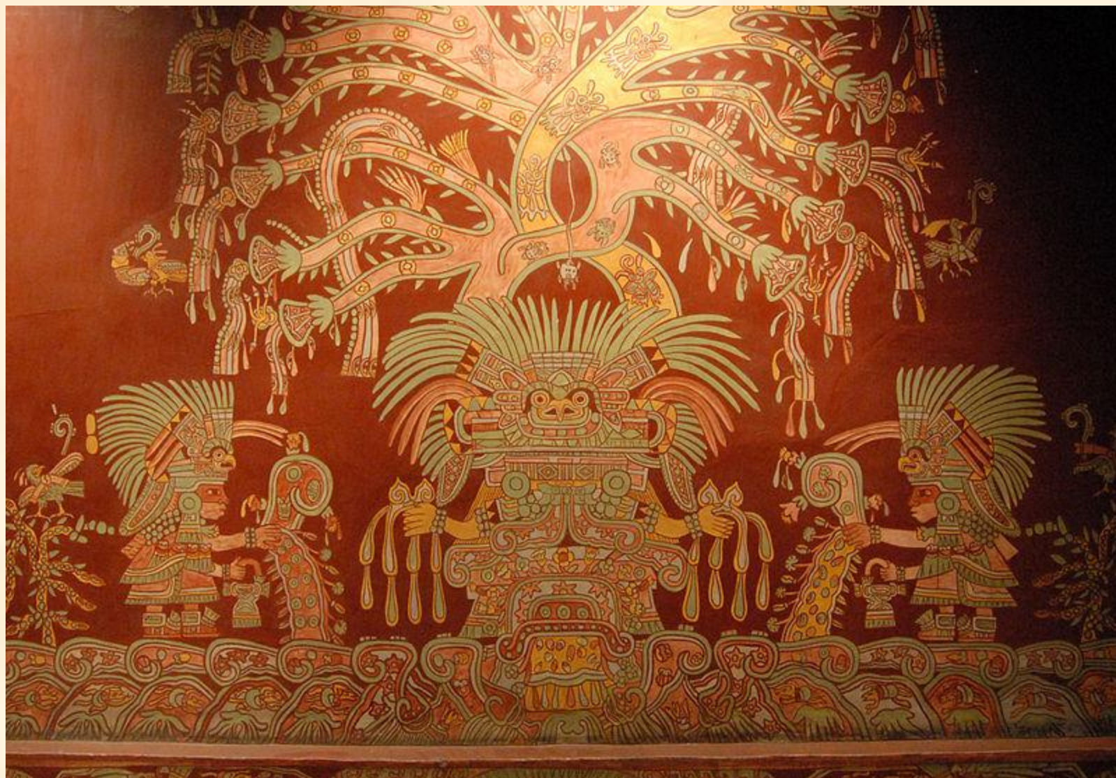
Великая богиня (фреска), Теотиуакан