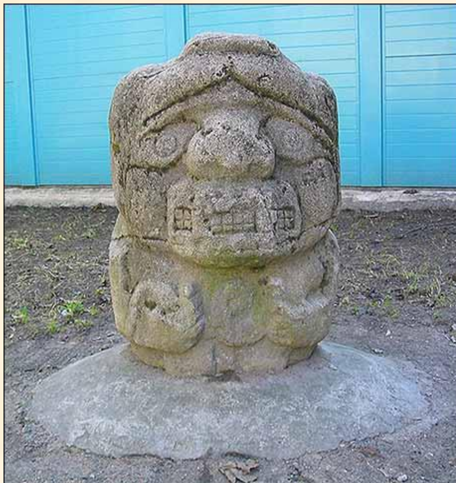
Уцилопочтли, бог солнца, войны и охоты