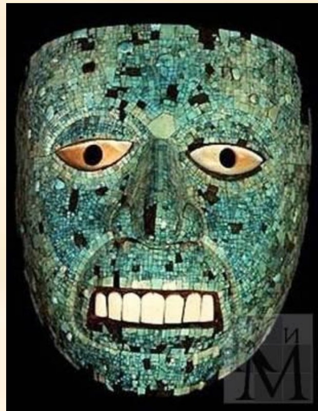
Погребальные маски ацтеков