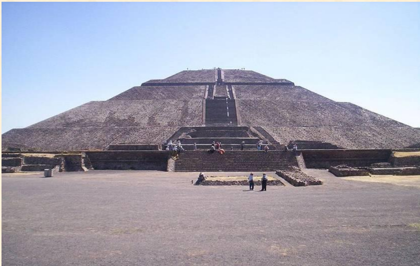
Пирамида Солнца, Теотиуакан