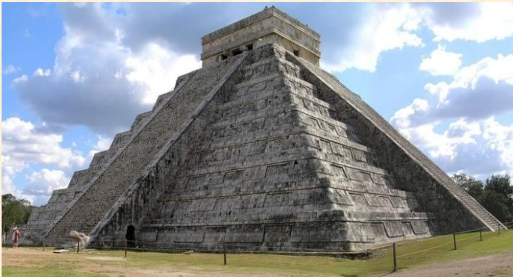
Пирамида Пернатого Змея, Теотиуакан