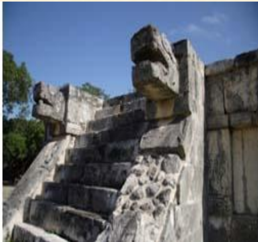
Храм Кецалькоатля, Теотиуакан