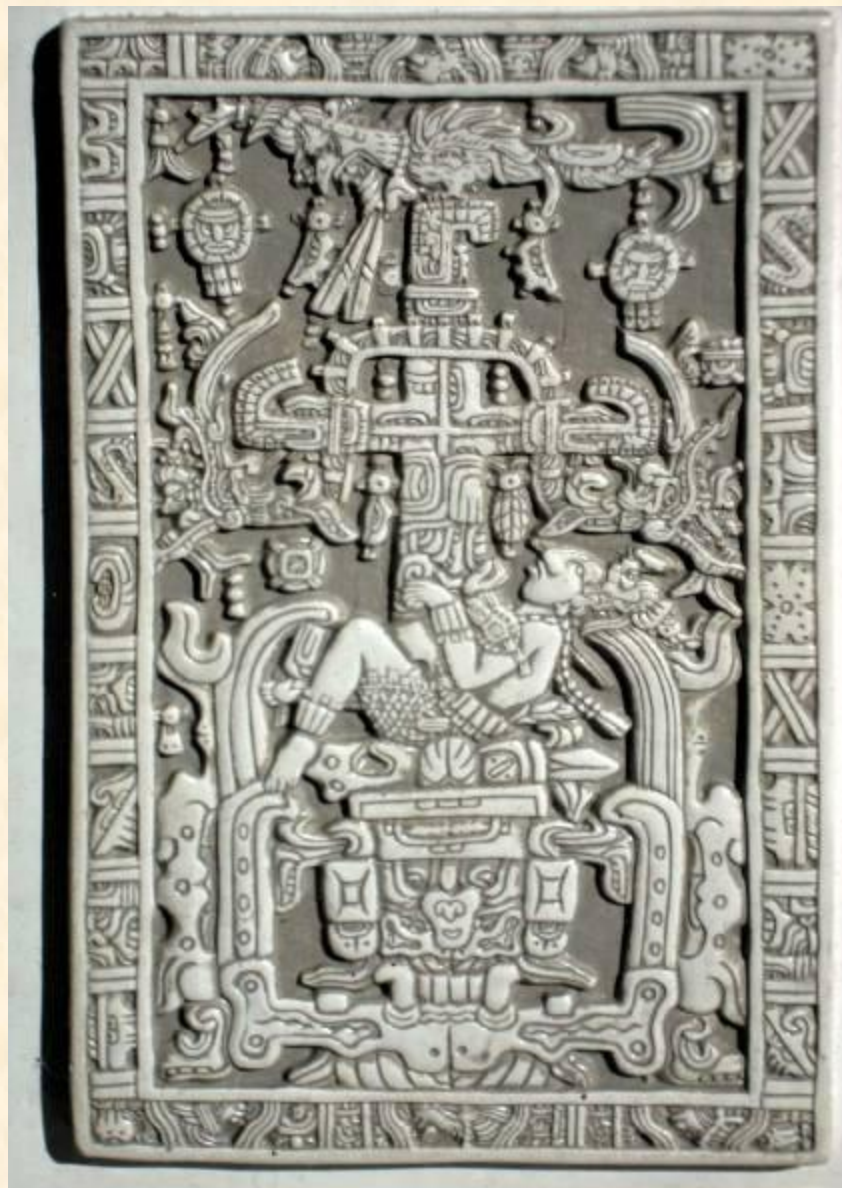
Крышка саркофага Пакаля II