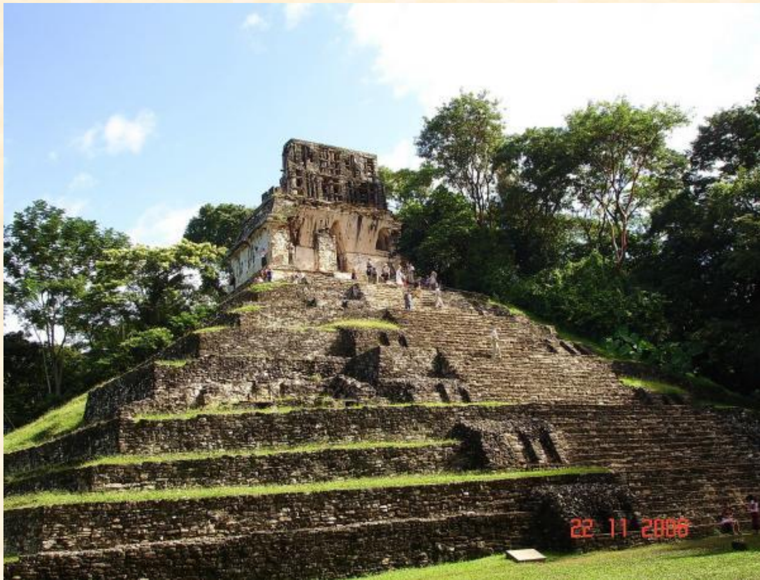
Храм Лиственного Креста, Паленке