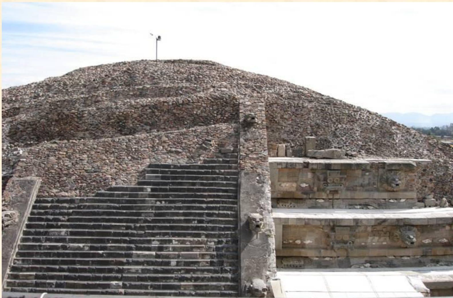
Храм Кецалькоатля, Теотиуакан