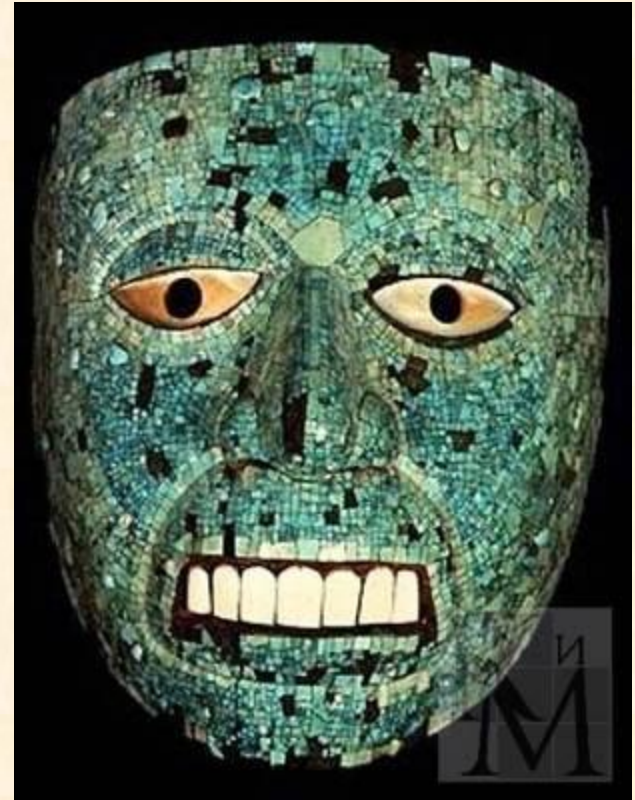
Погребальные маски ацтеков