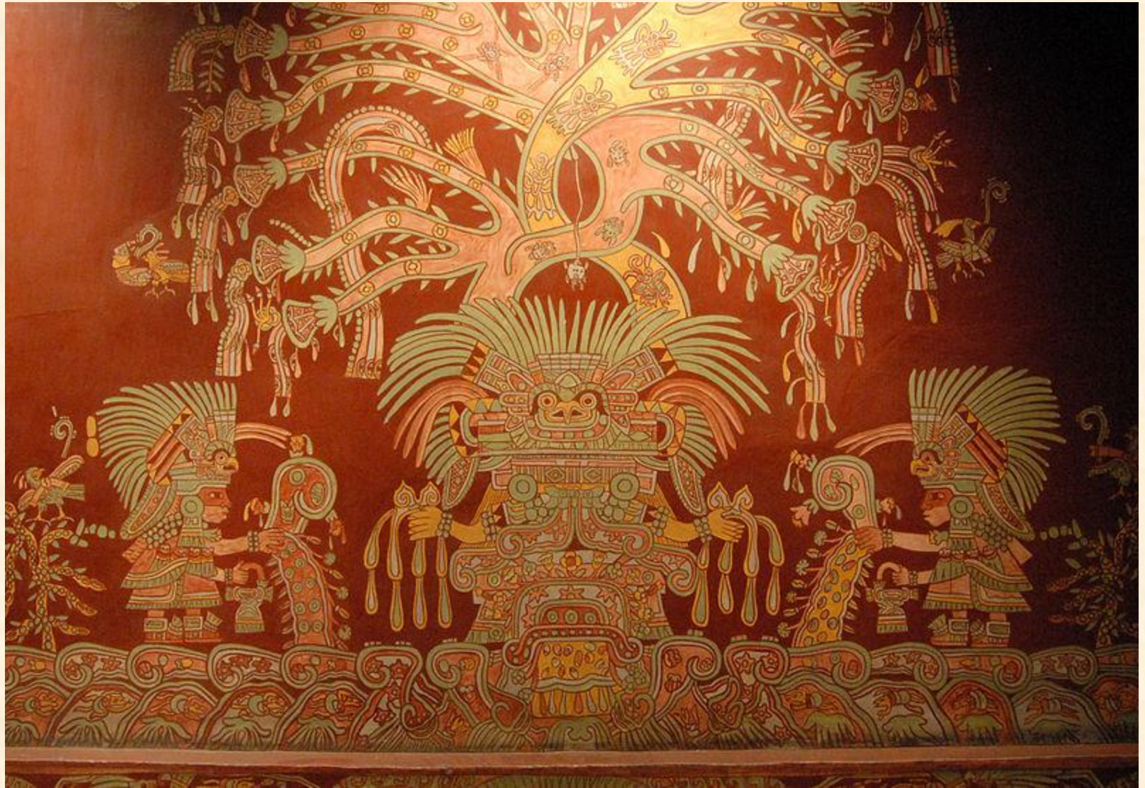
Великая богиня (фреска), Теотиуакан