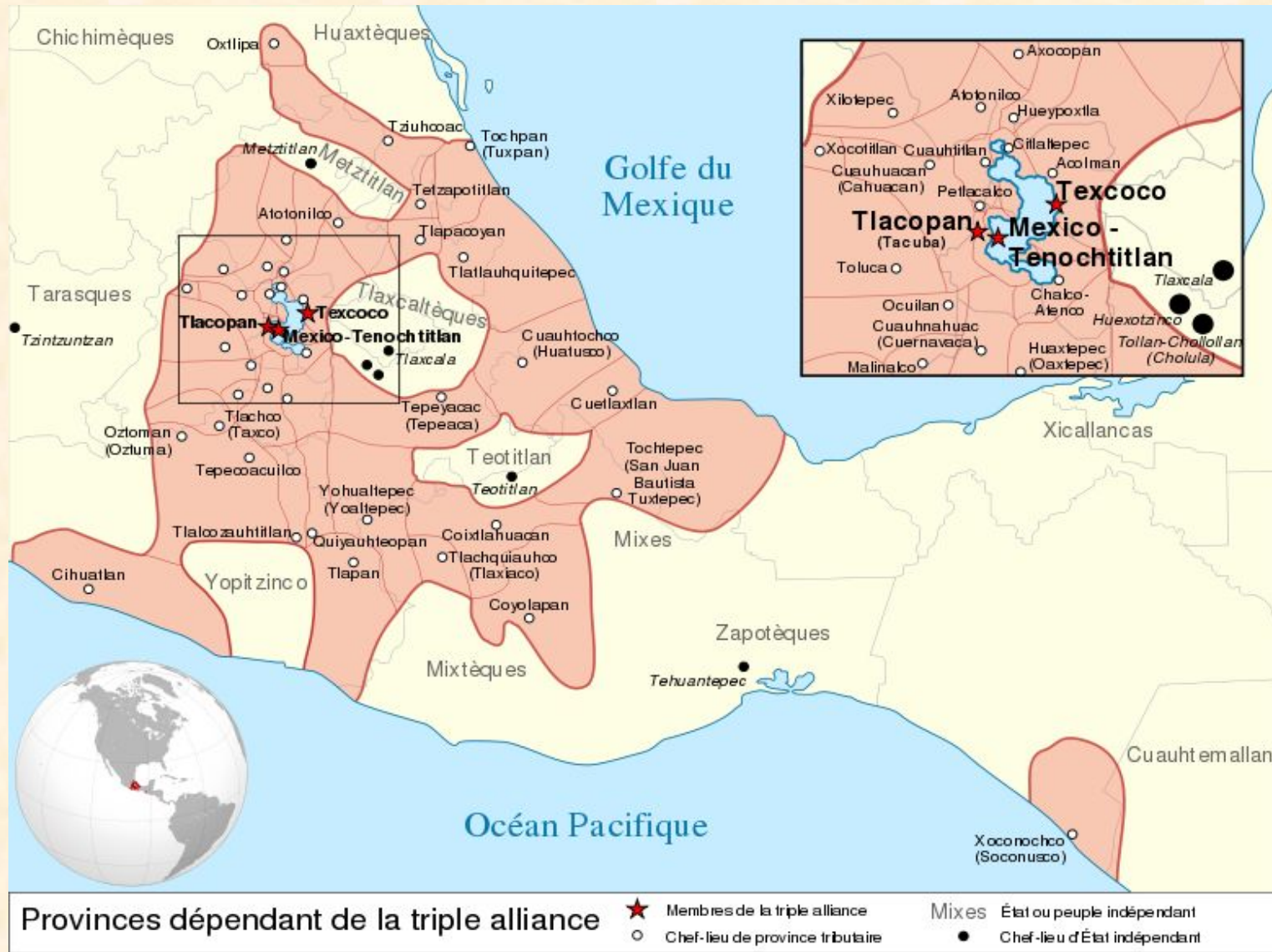
Территория, которую занимала цивилизация ацтеков