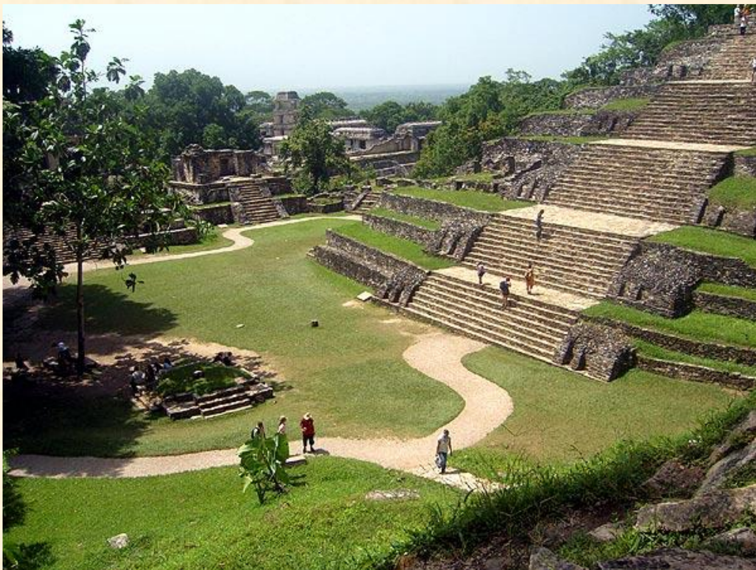
Храм Креста, Паленке