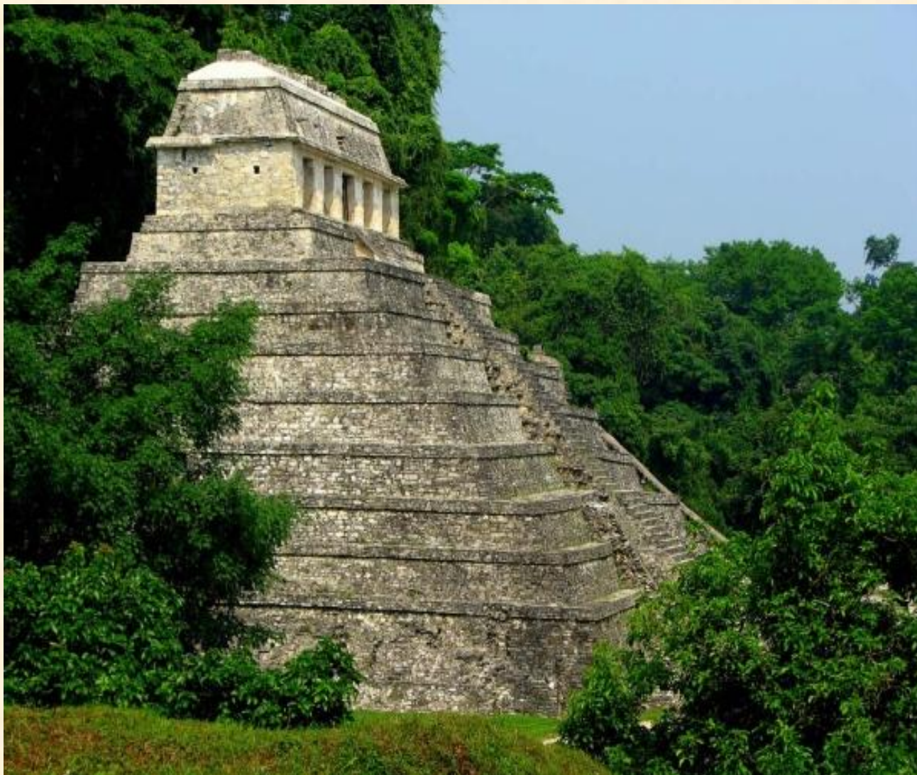
Храм Надписей, Паленке