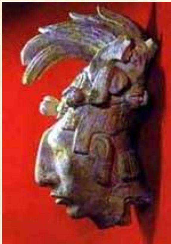
Голова правителя Пакаля. Рельеф