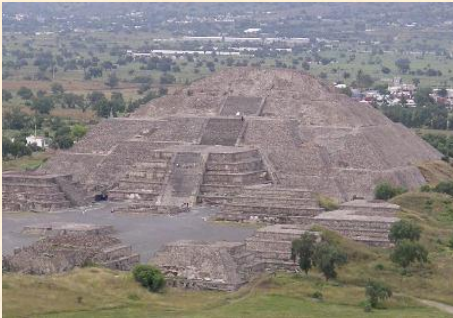
Пирамида Луны, Теотиуакан