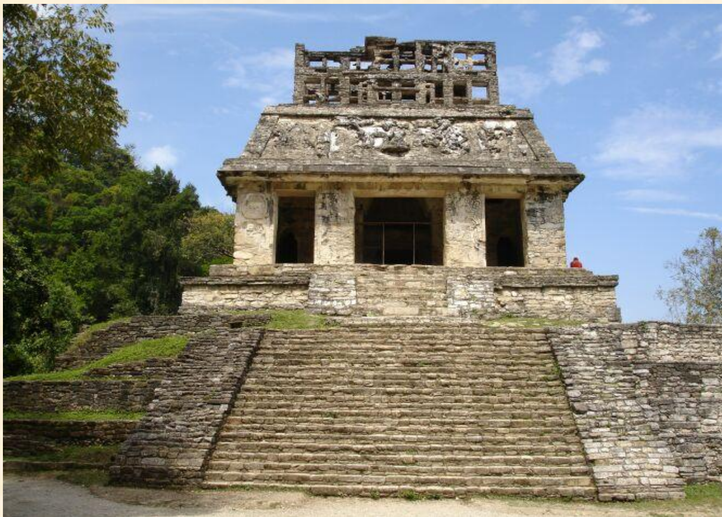
Храм Солнца, Паленке