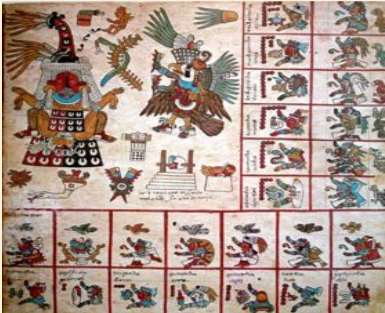
Ацтекский рисунок. Бурбонский кодекс