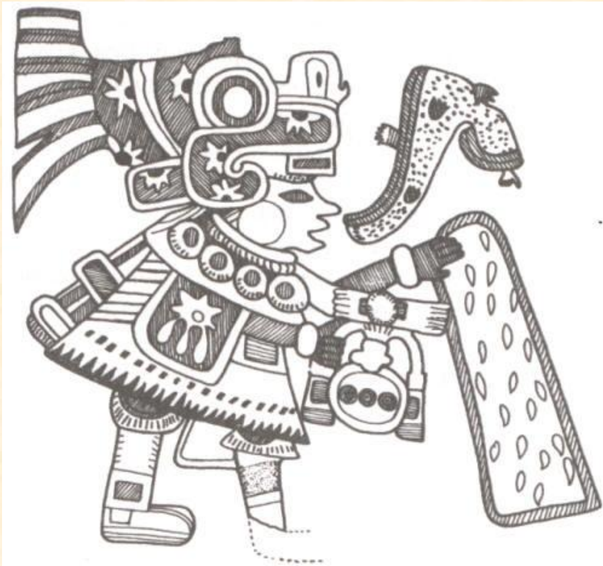
Поющий жрец в сцене ритуального сева (фреска), Теотиуакан