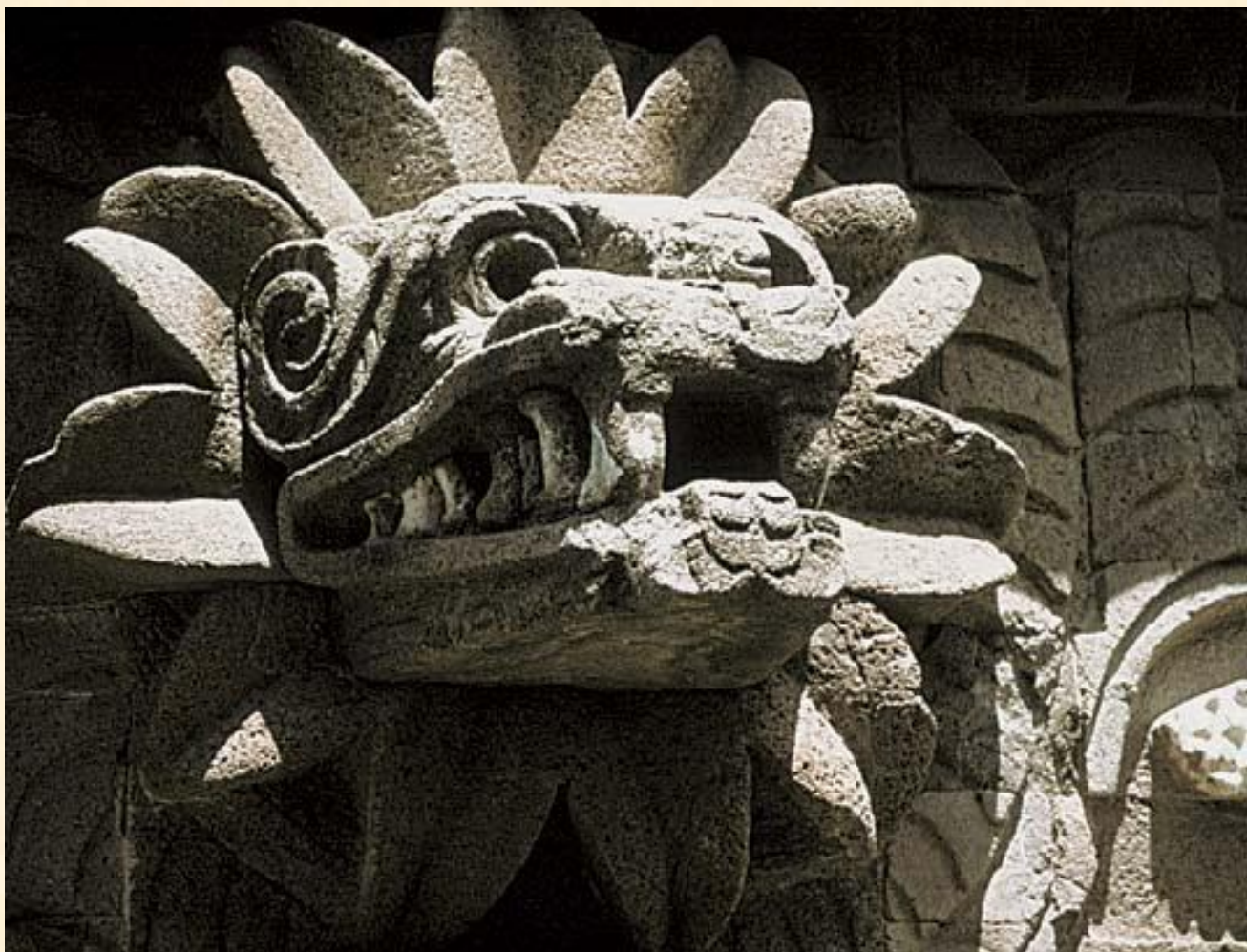
Каменное изображение Пернатого змея Храм Кецалькоатля, Теотиуакан