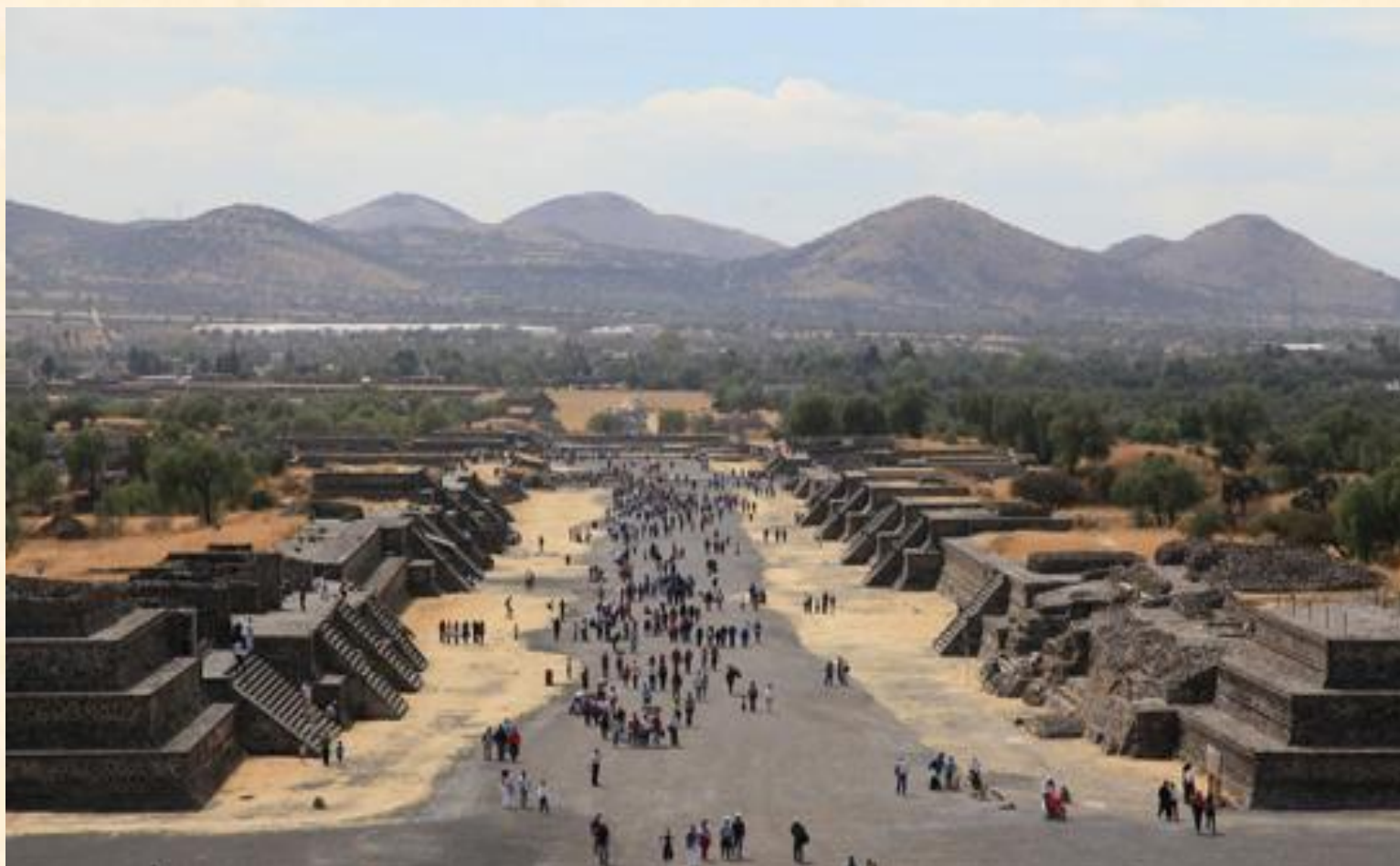
Дорога мёртвых, Теотиуакан