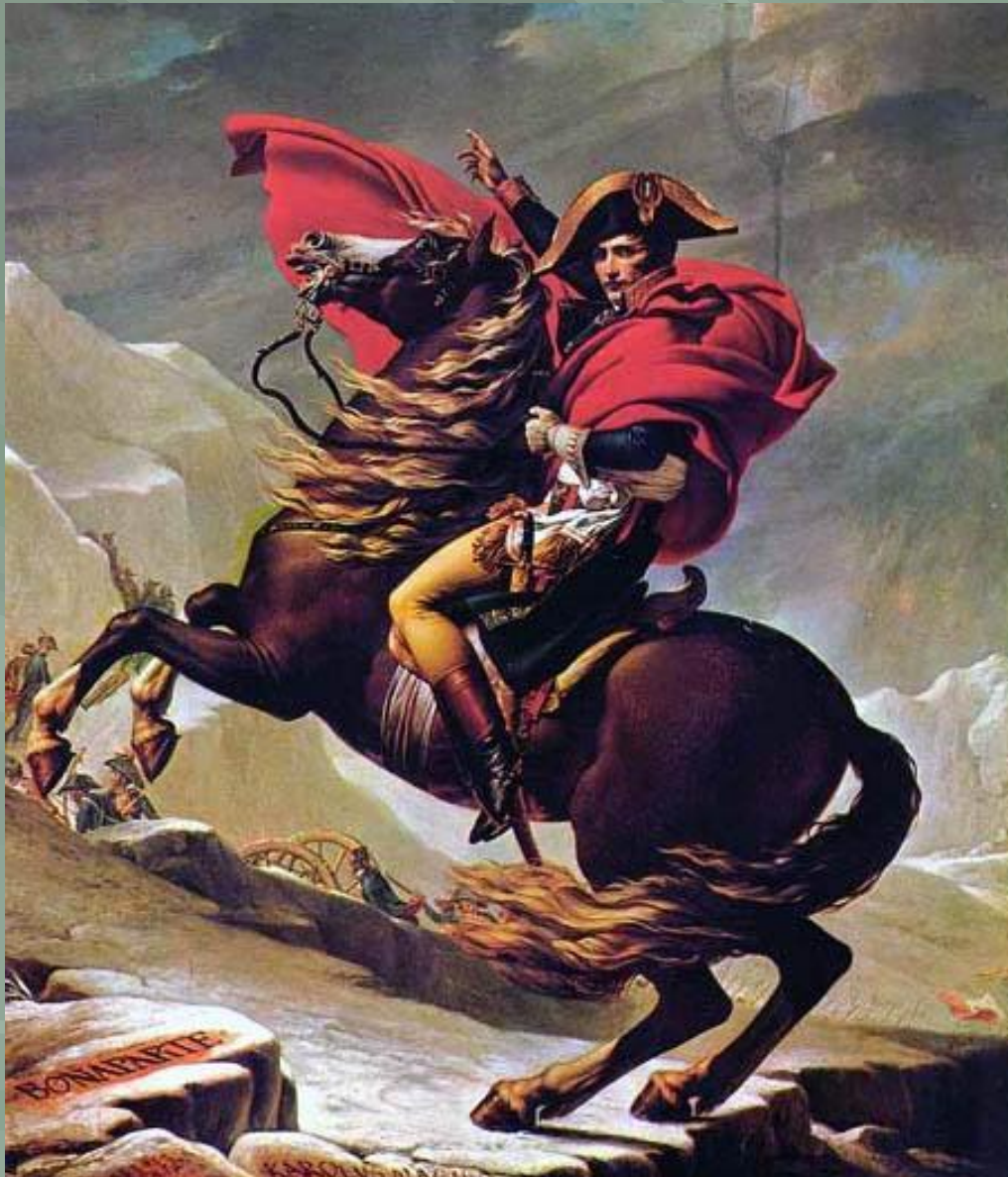
«Переход Наполеона через Альпы»