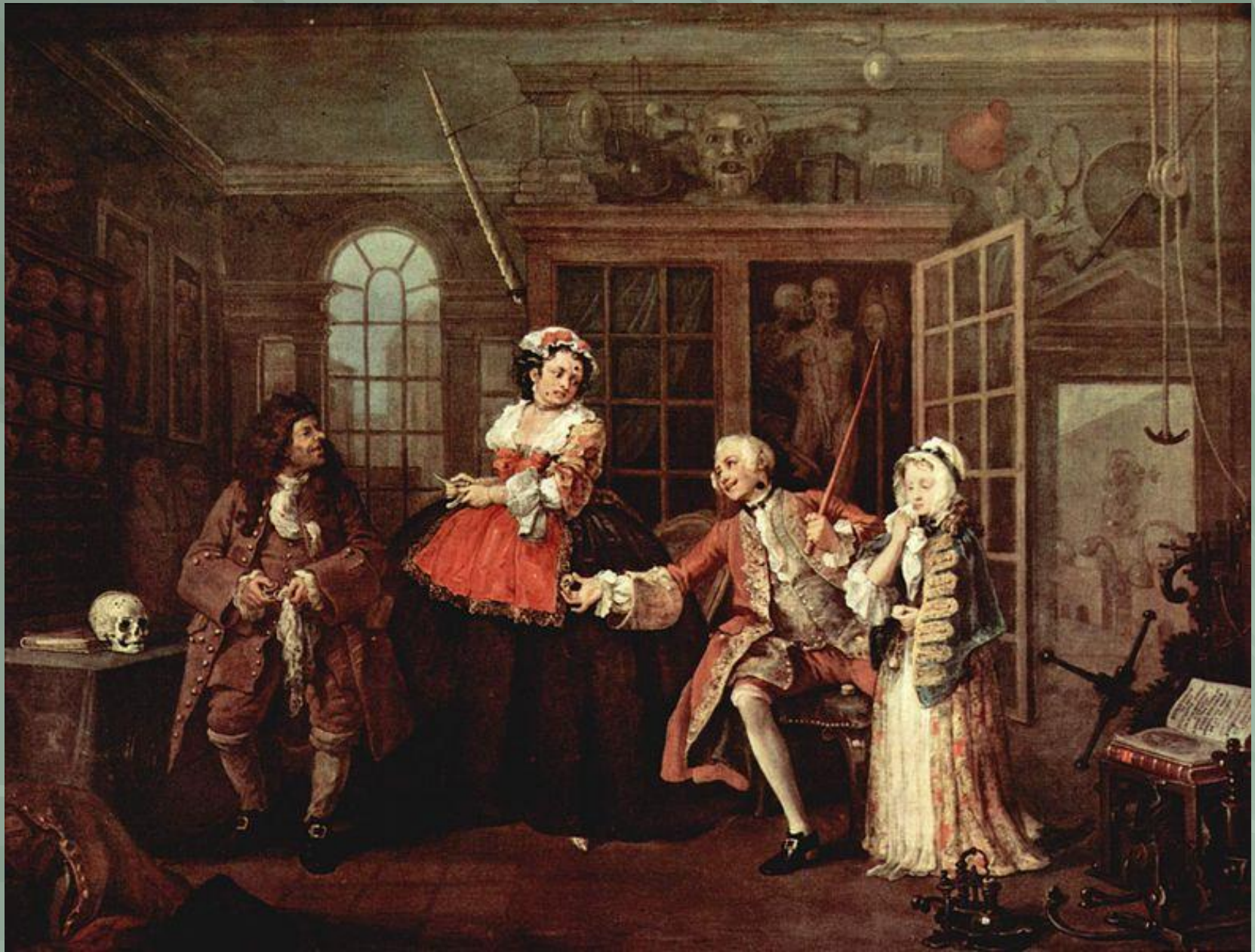
«Визит к шарлатану»