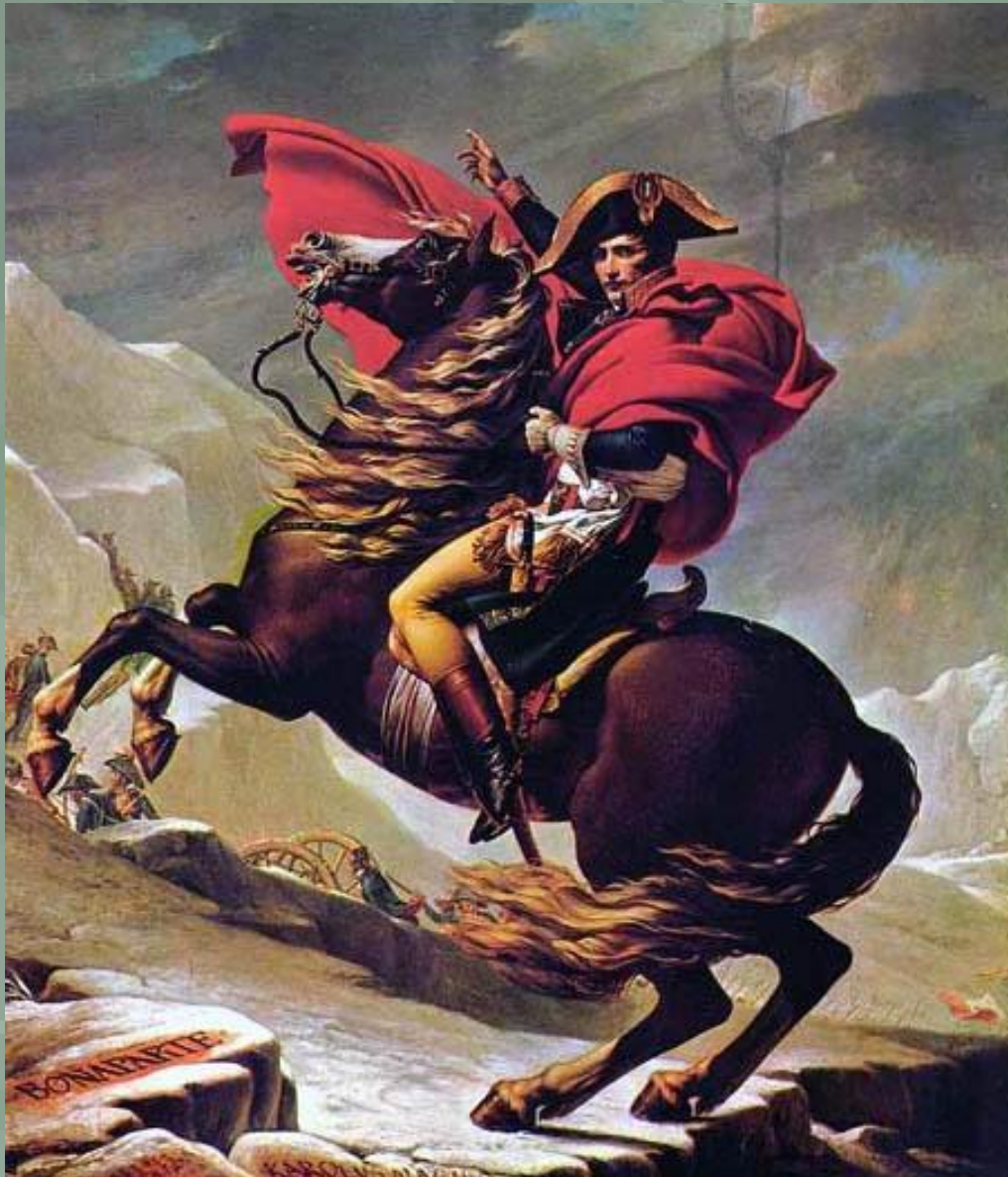
«Переход Наполеона через Альпы»