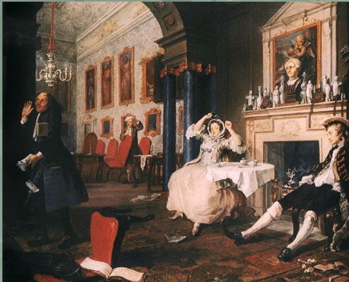
«Утро в доме новобрачных»