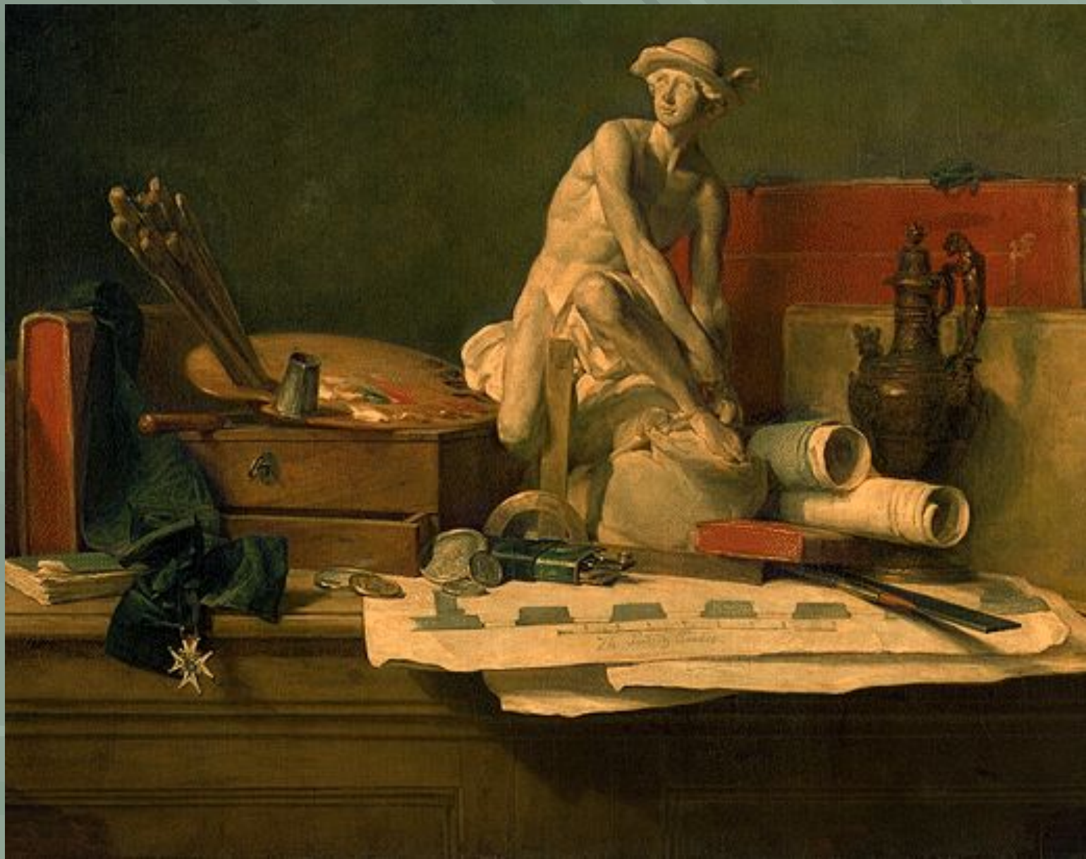
«Натюрморт с атрибутами искусств»