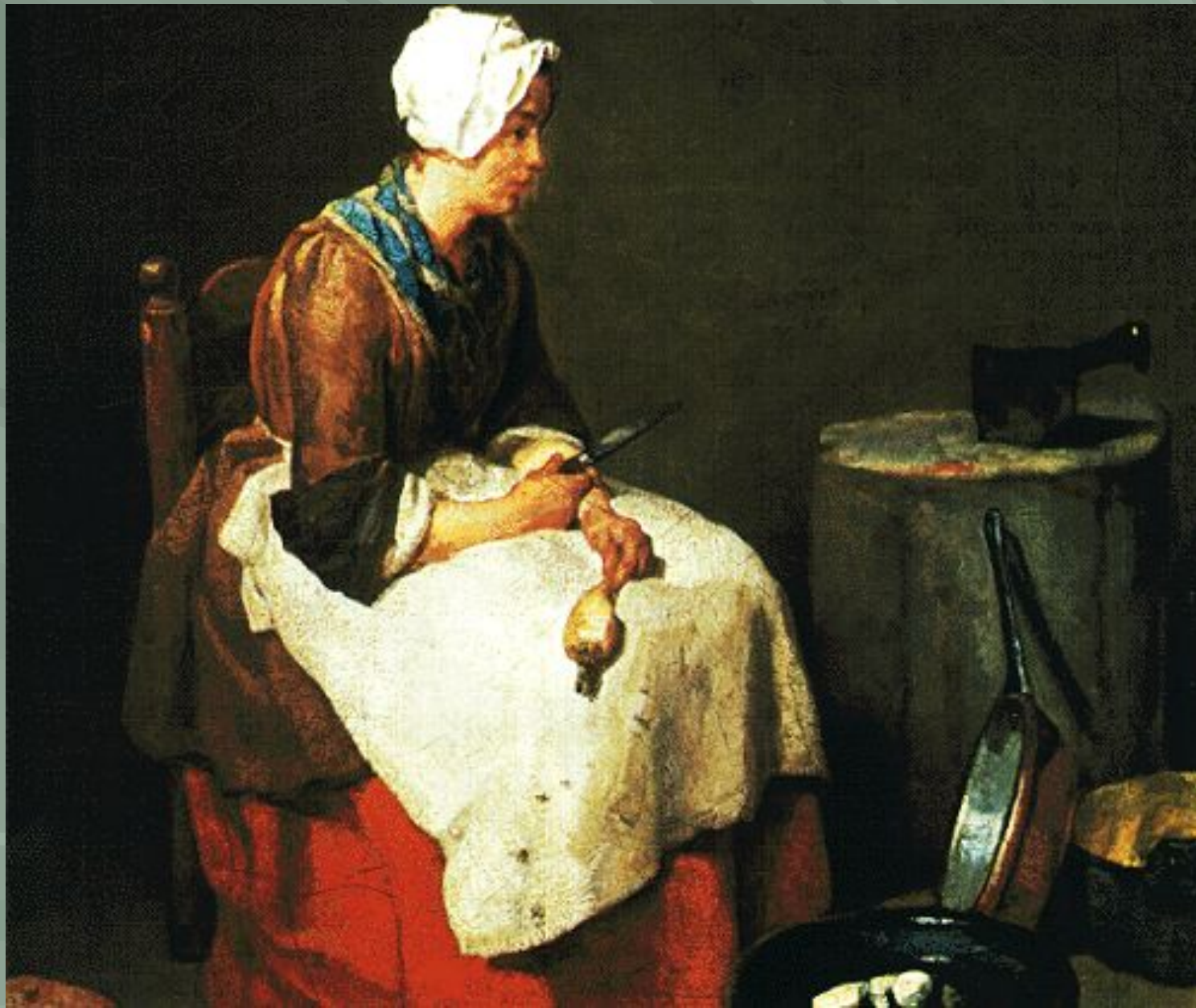
«Торговка жареным мясом»