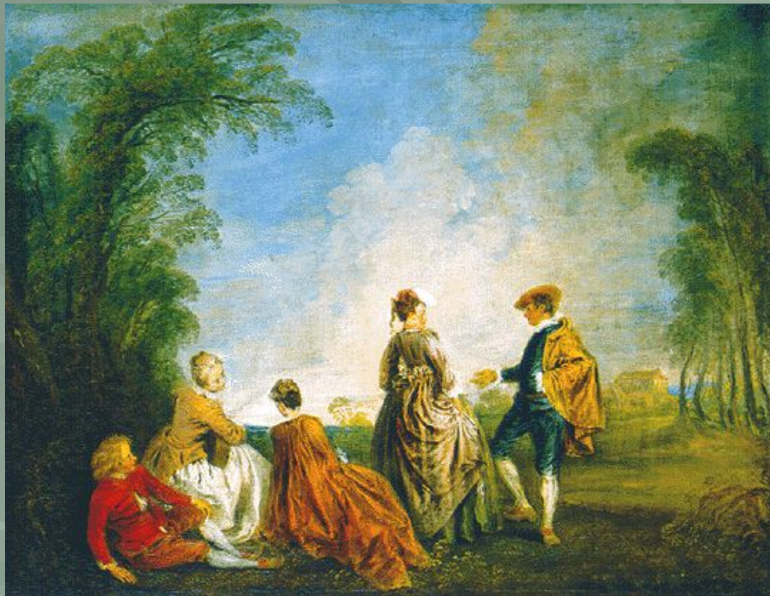
« Затруднительное предложение »