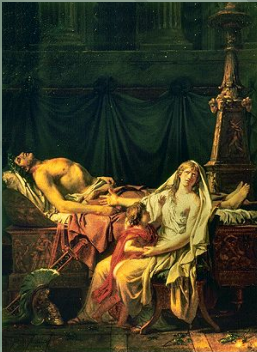
« Андромаха, оплакивающая Гектора»