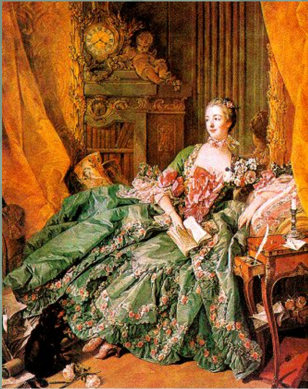
« Графиня де Помпадур»