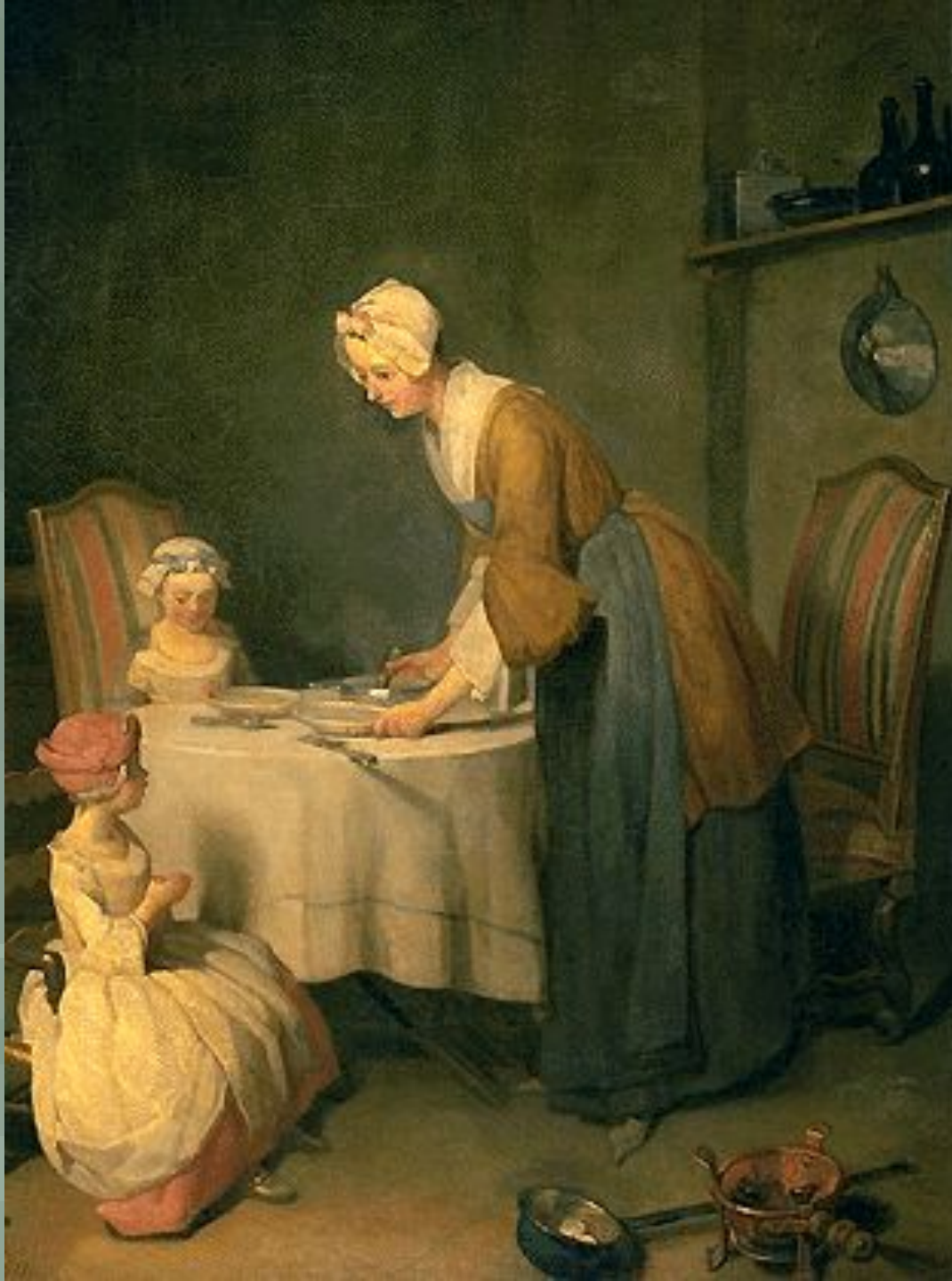
«Молитва перед обедом»