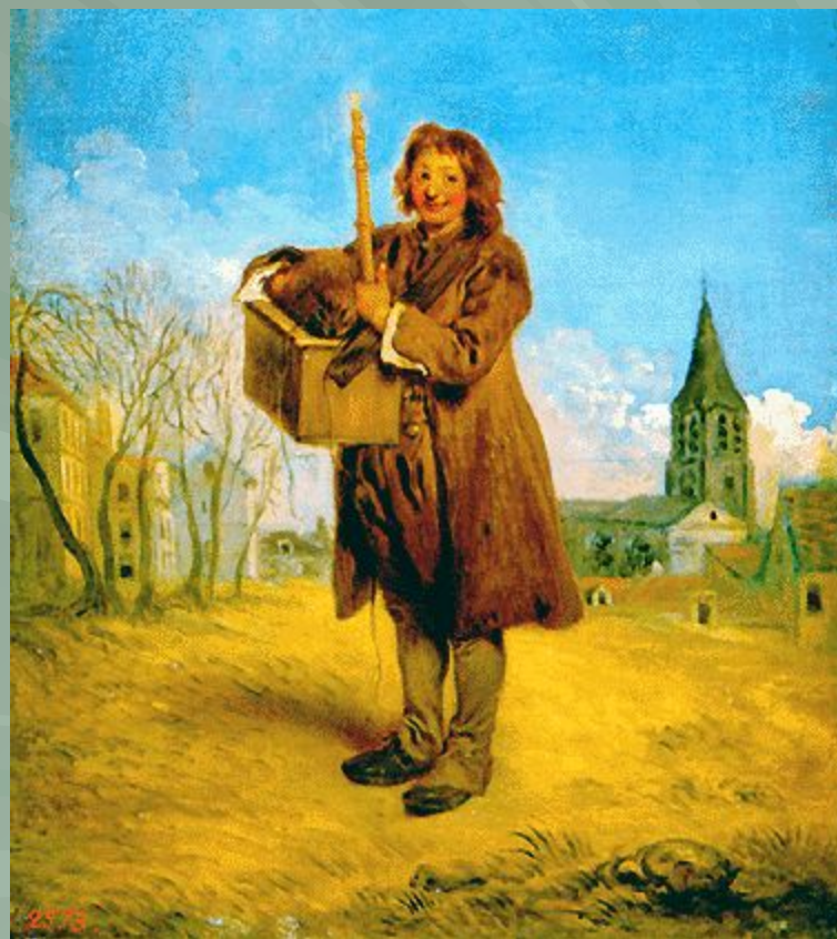
«Савояр с сурком»