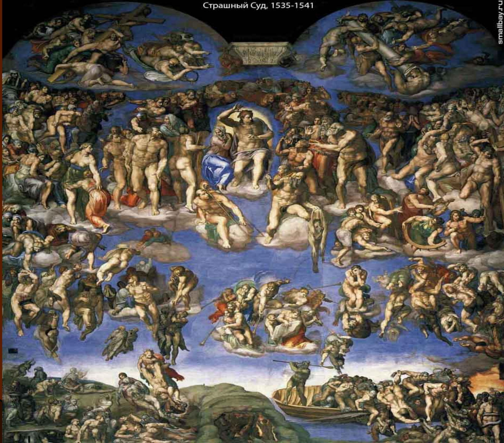
Страшный Суд, 1535-1541