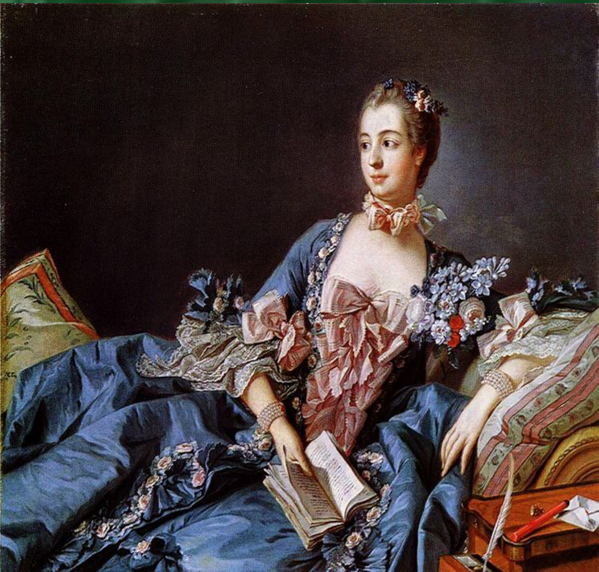
Франсуа Буше. Портрет мадам Помпадур, около 1750 года.