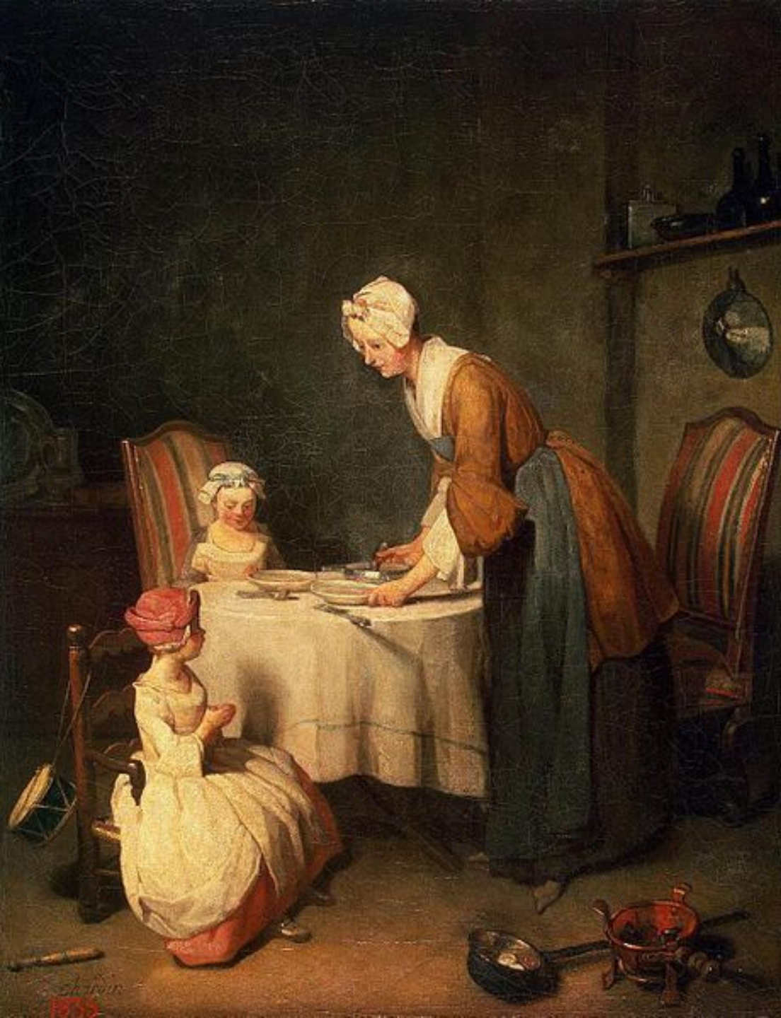
«Молитва перед обедом» , 1744