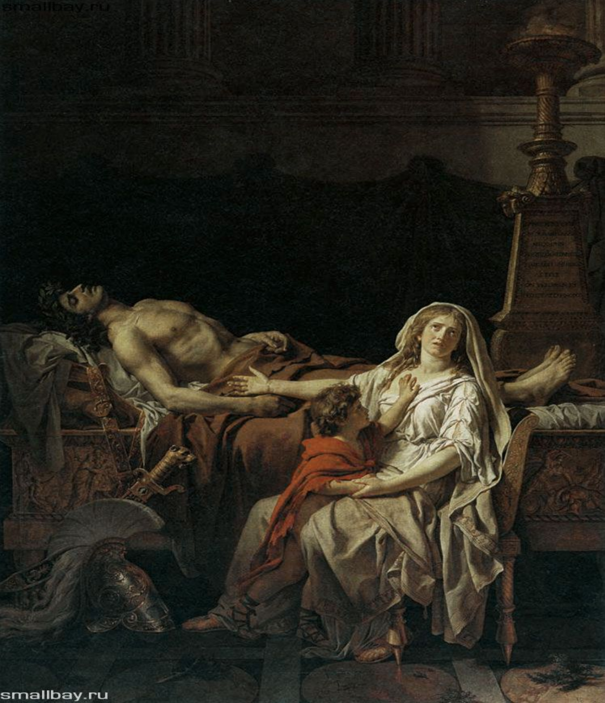
Андромаха у тела Гектора, 1783 Музей Лувр, Париж