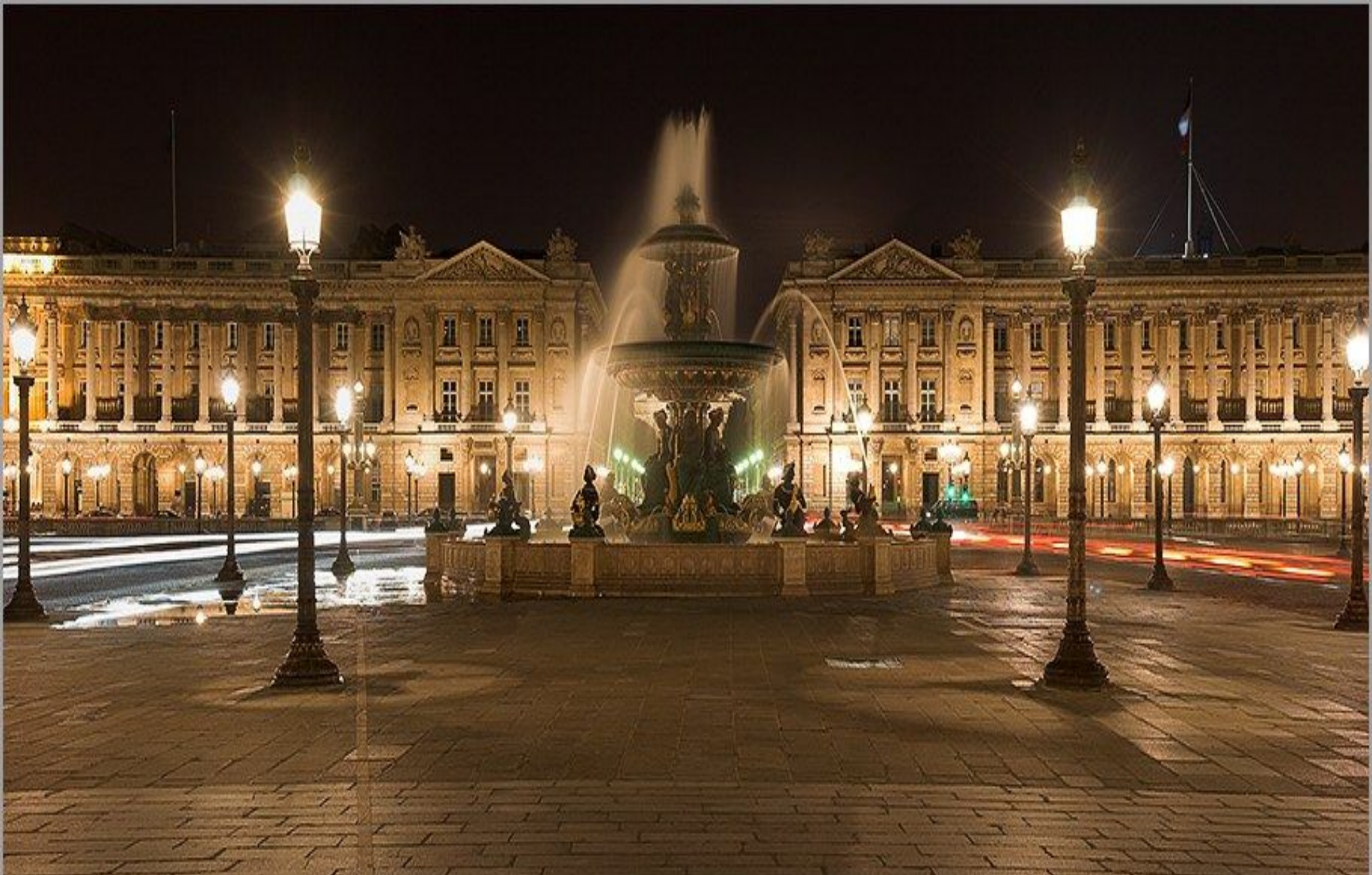
Площадь Согласия в Париже.