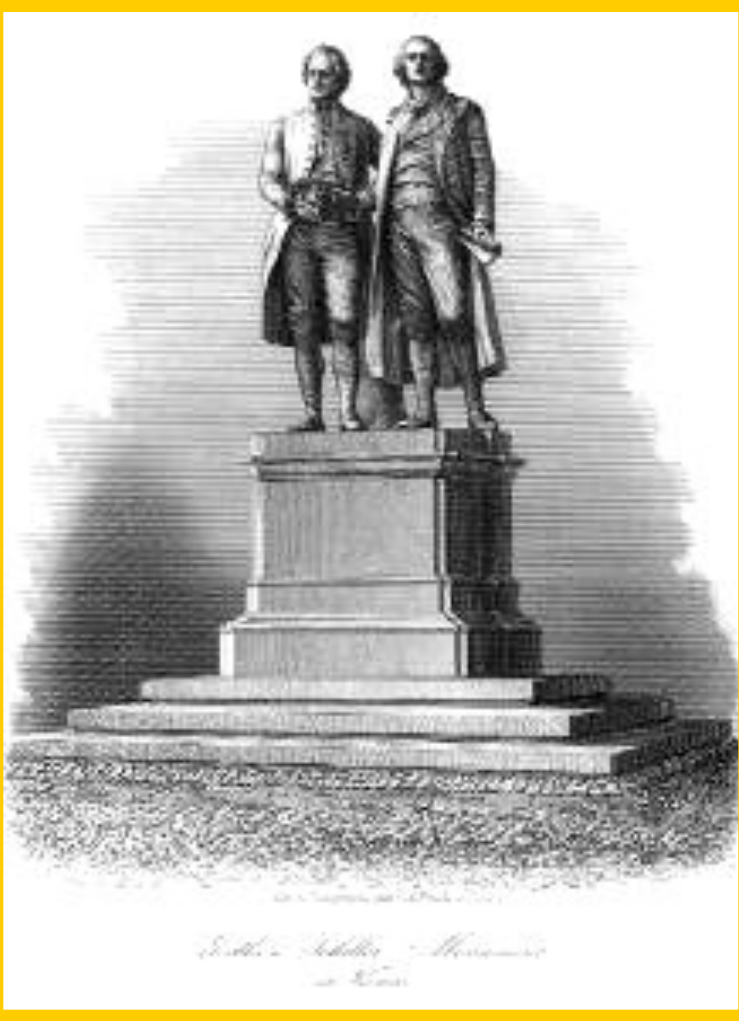
Гете и Шиллер. Гравюра н.19 в.

Байрон отправился в Грецию, чтобы принять участие в начавшейся там революции, но заболел и умер.