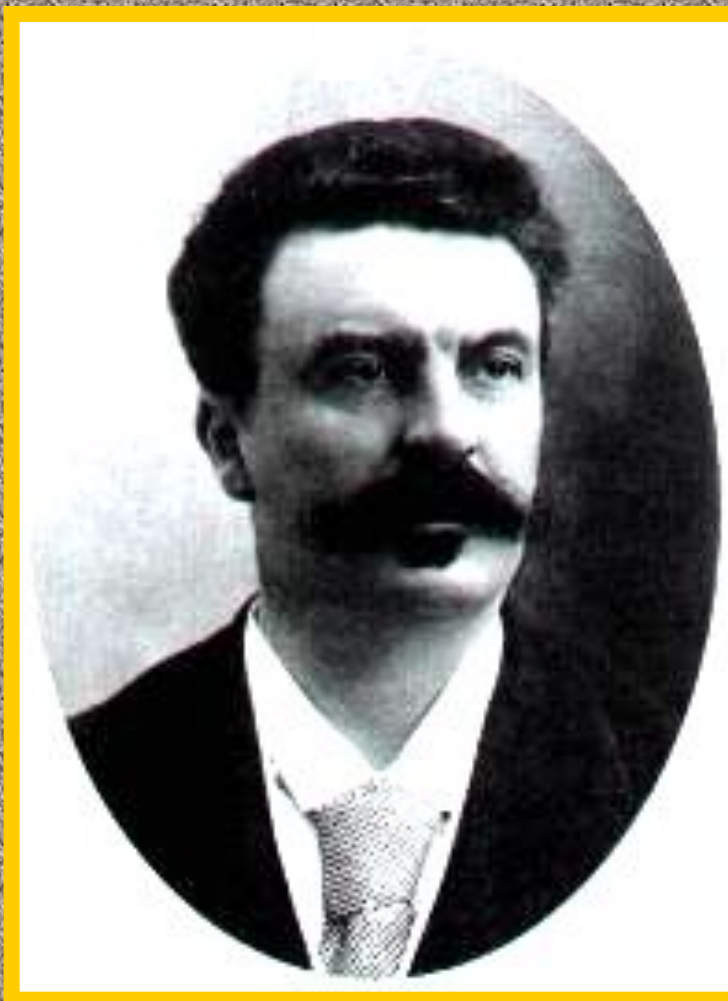
Ги де Мопассан.

В к.19 в. появился натурализм-течение отображавшее жизнь без прикрас. Авторы работавшие в данном ключе подвергались жесточайшей критике. Особенно доставалось Э.Золя и Г.де Мопассану. Но в их произведениях натурализм был лишь фоном для вскрытия острейших социальных проблем.