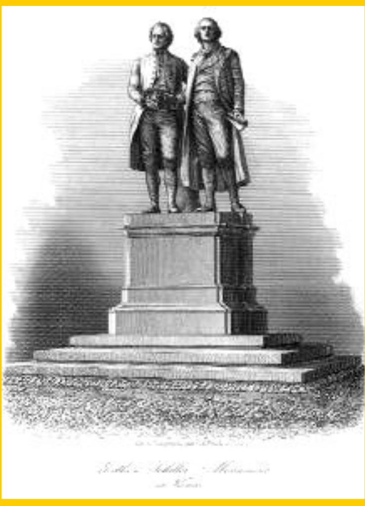
Гете и Шиллер. Гравюра н.19 в.

Байрон отправился в Грецию, чтобы принять участие в начавшейся там революции, но заболел и умер.