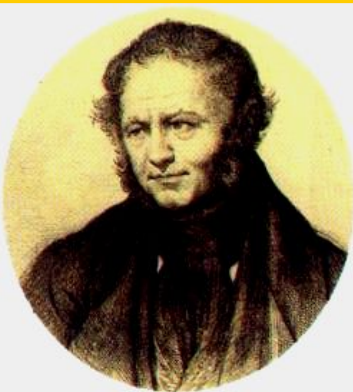
Стендаль. Гравюра н.19 в.

О. де Бальзак в цикле «Человеческая комедия» (ок. 100 произведений), нарисовал многогранную картину французского общества.