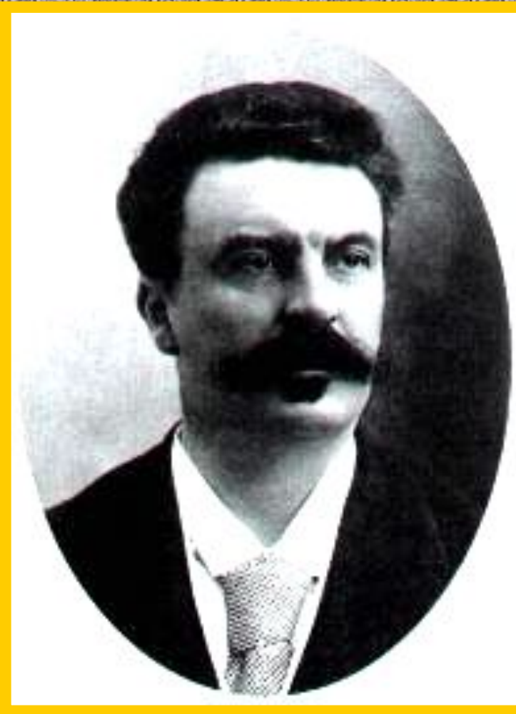
Ги де Мопассан.

В к.19 в. появился натурализм-течение отображавшее жизнь без прикрас. Авторы работавшие в данном ключе подвергались жесточайшей критике. Особенно доставалось Э.Золя и Г.де Мопассану. Но в их произведениях натурализм был лишь фоном для вскрытия острейших социальных проблем.