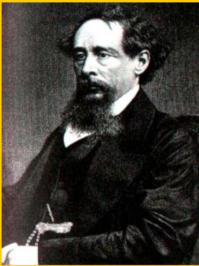
Ч. Диккенс. Гравюра 19 в.

В 1830-х гг. возникает реализм. В творчестве Ч. Диккенса раскрывается духовная жизнь и социальная история Англии 19 века. Автор предлагает спокойно искоренять человеческие пороки и «лечить» общество вместо того, чтобы подрывать вековые устои.