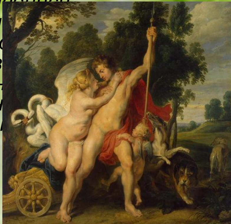
Рубенс. Венера и Адонис.