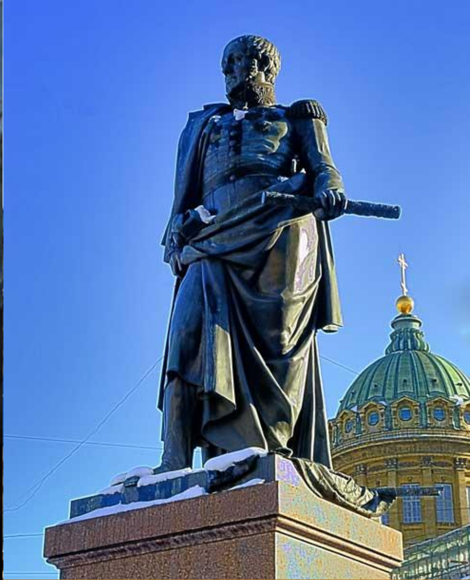
Архитектор Андрей ВОРОНИХИН Скульптор Борис ОРЛОВСКИЙ