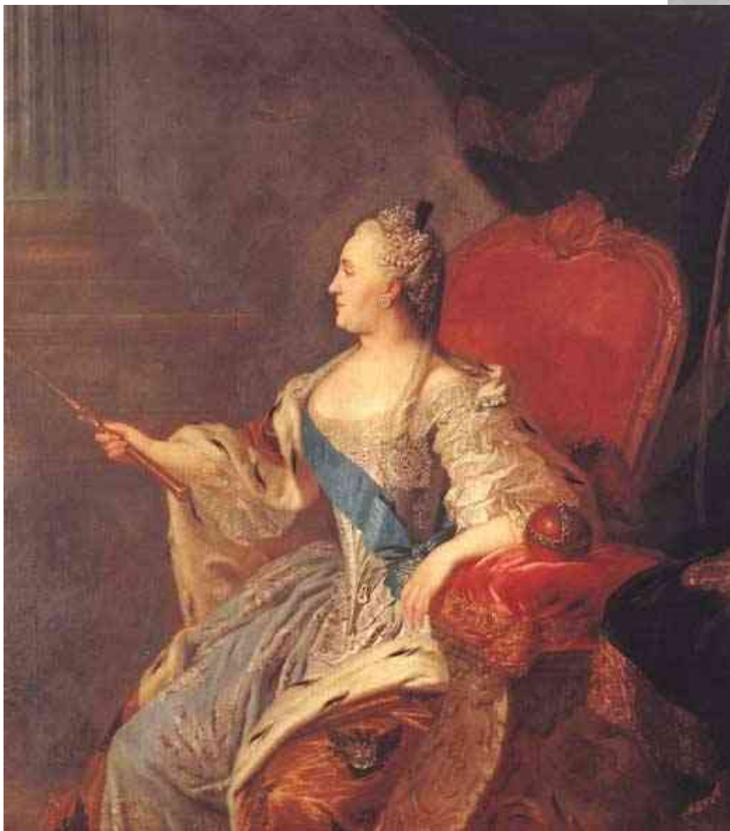
«Портрет Екатерины II»