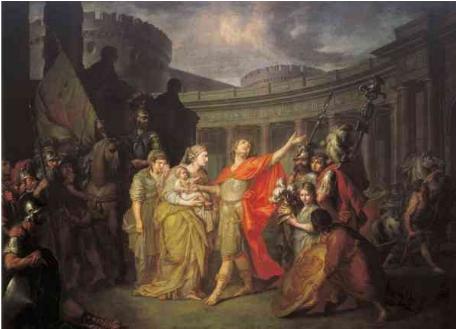
«Прщание Гектора с Андромахой»