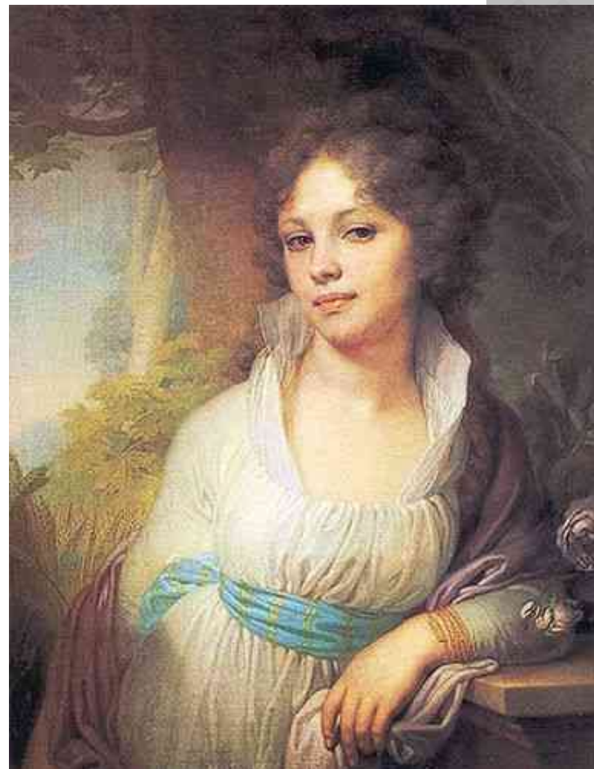
«Портрет М.И. Лопухиной»