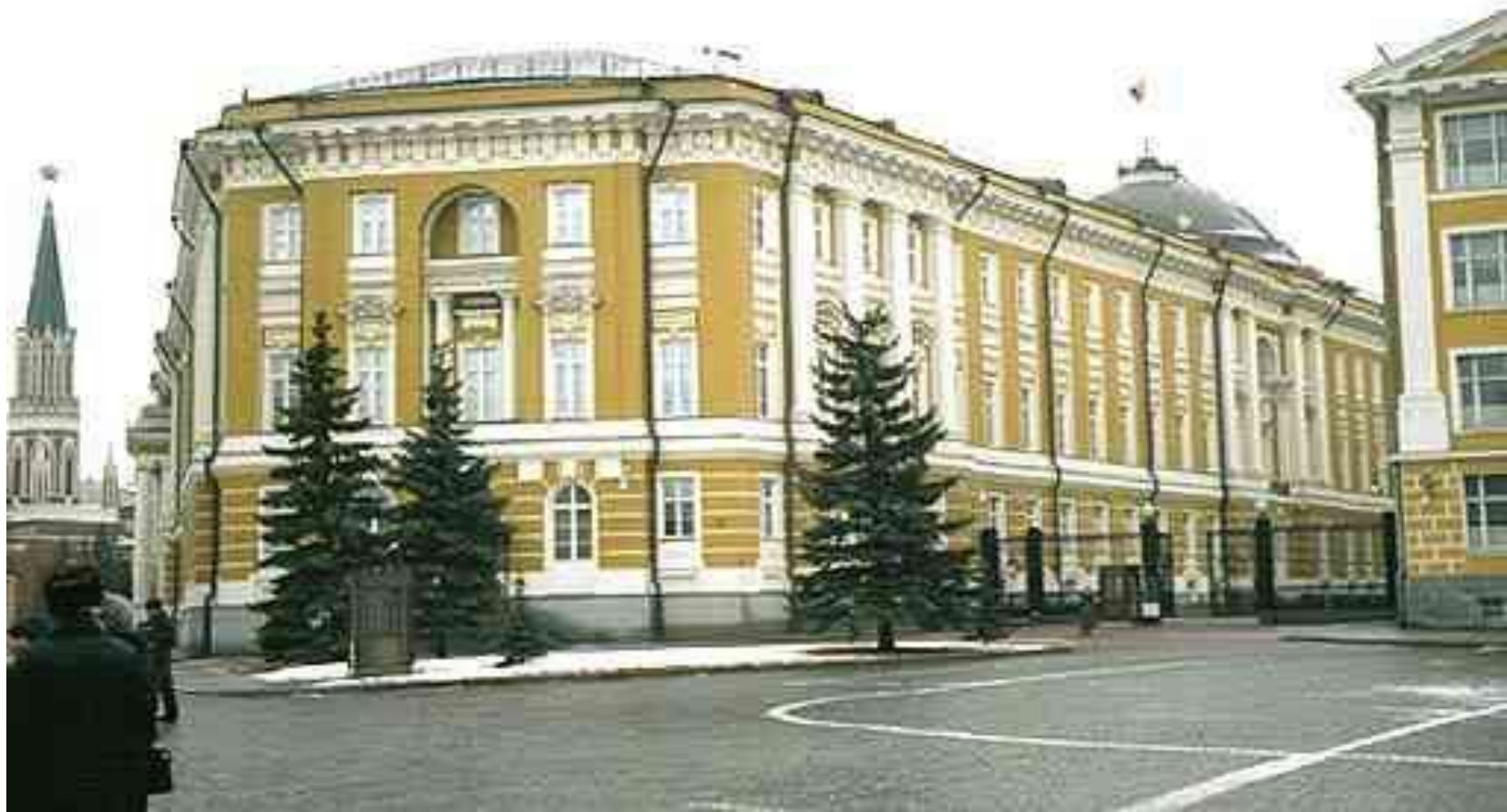
«Здание Сената в Москве»