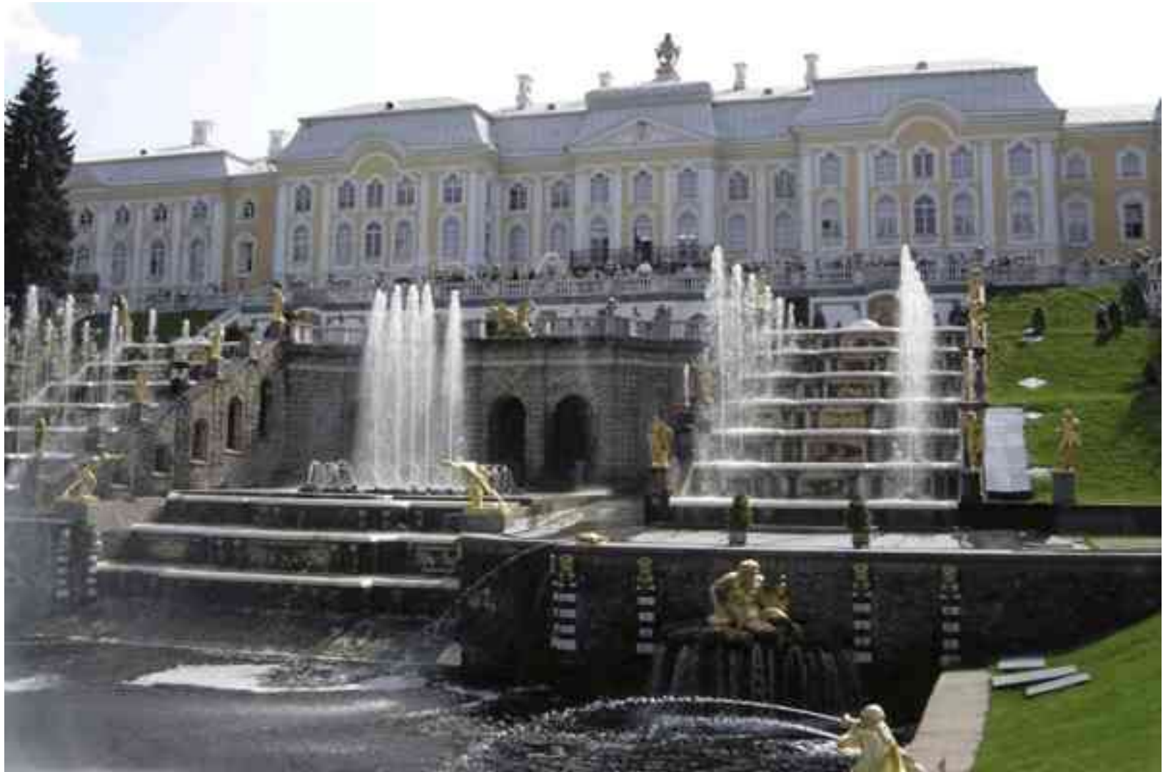
«Большой дворец в Петергофе»