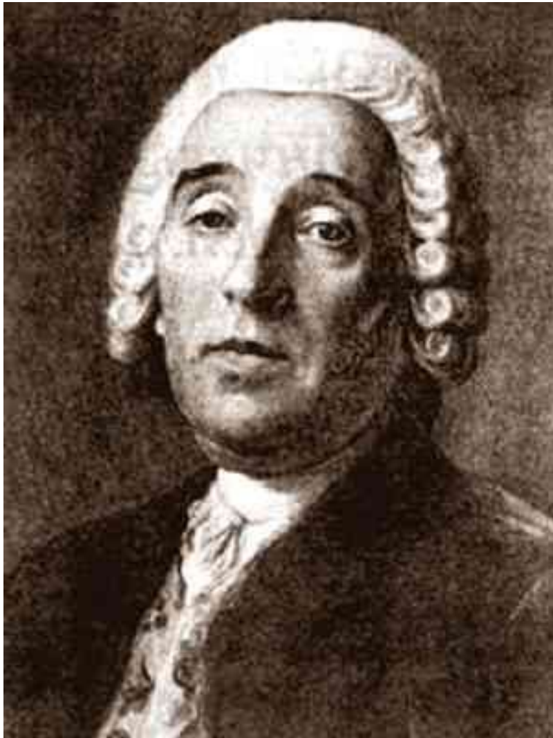
Варфоломей Варфоломеевич Растрелли (1700-1721)