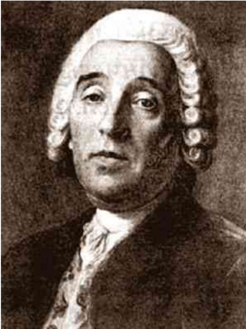
Варфоломей Варфоломеевич Растрелли (1700-1721)