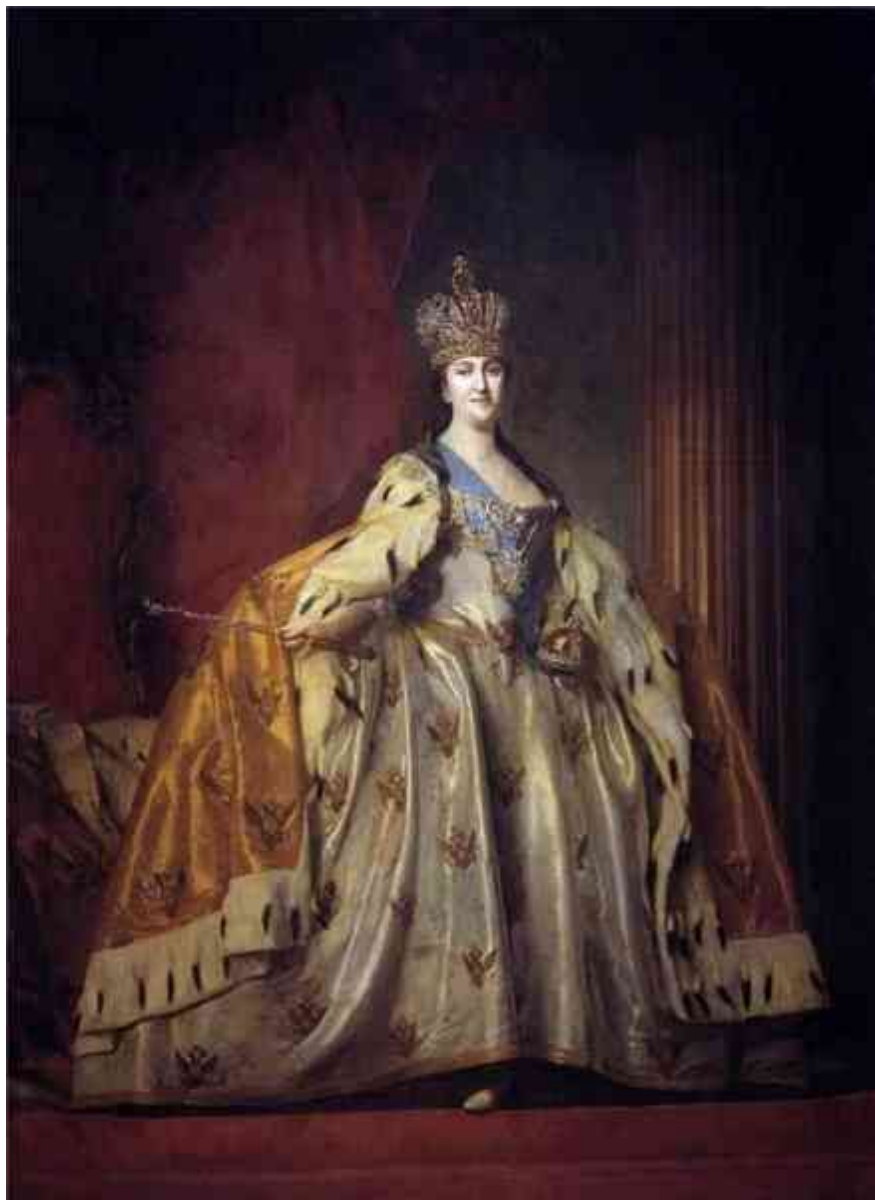
«Портрет Екатерины II»