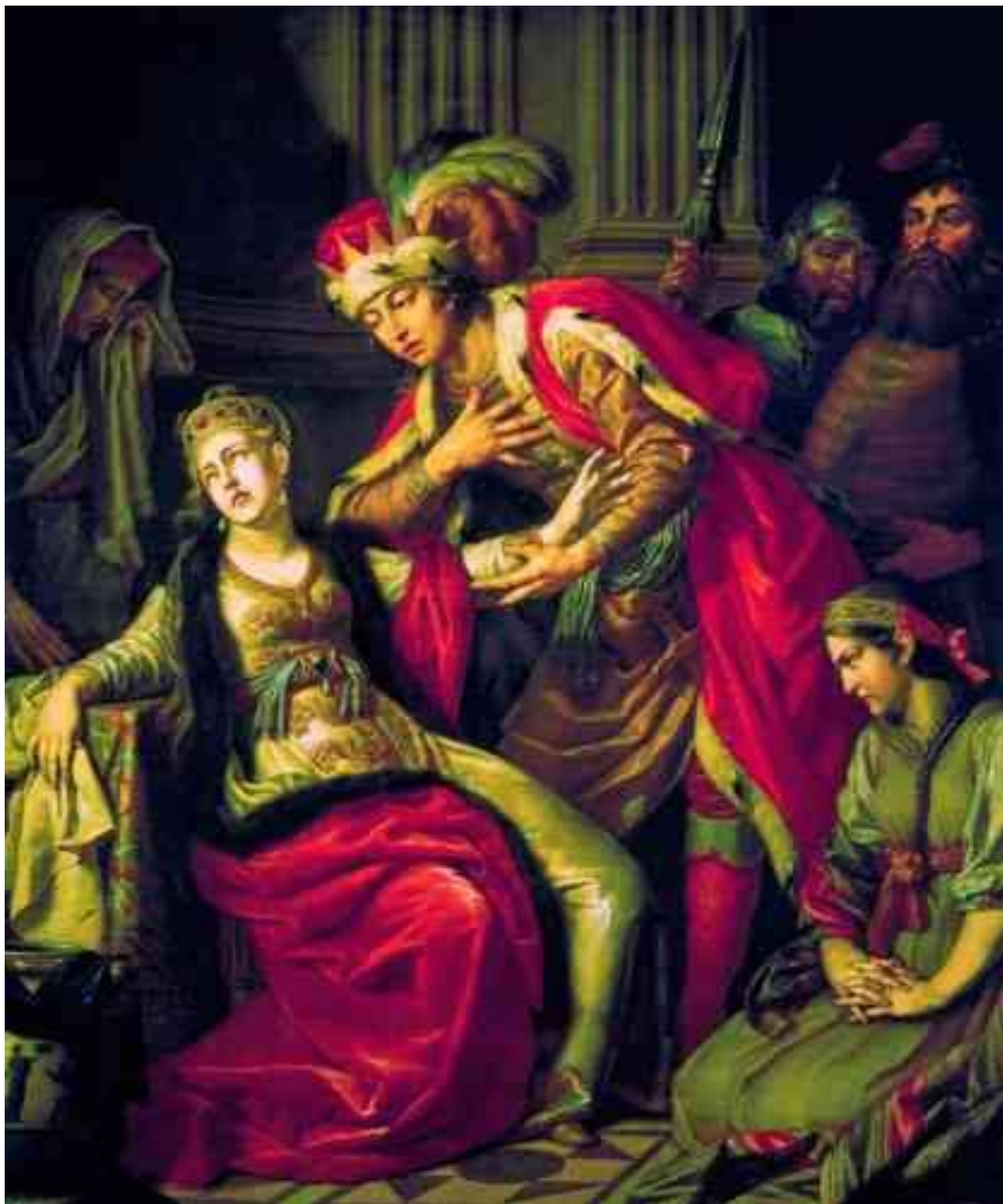
«Владимир перед Рогнедой»