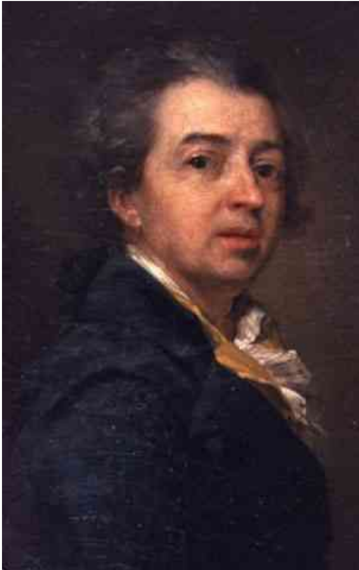
Дмитрий Григорьевич Левицкий (1735-1822)