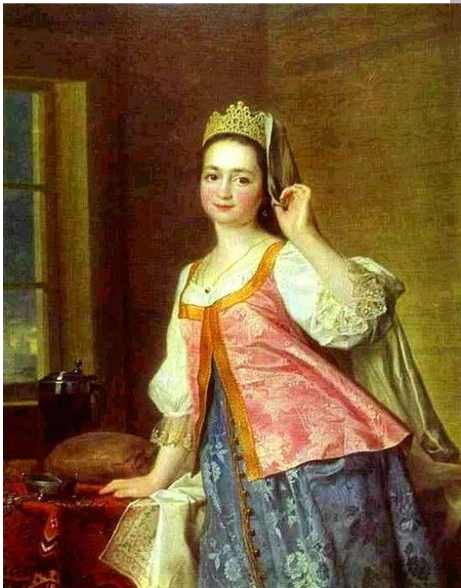
«Женщина прекрасна вне»