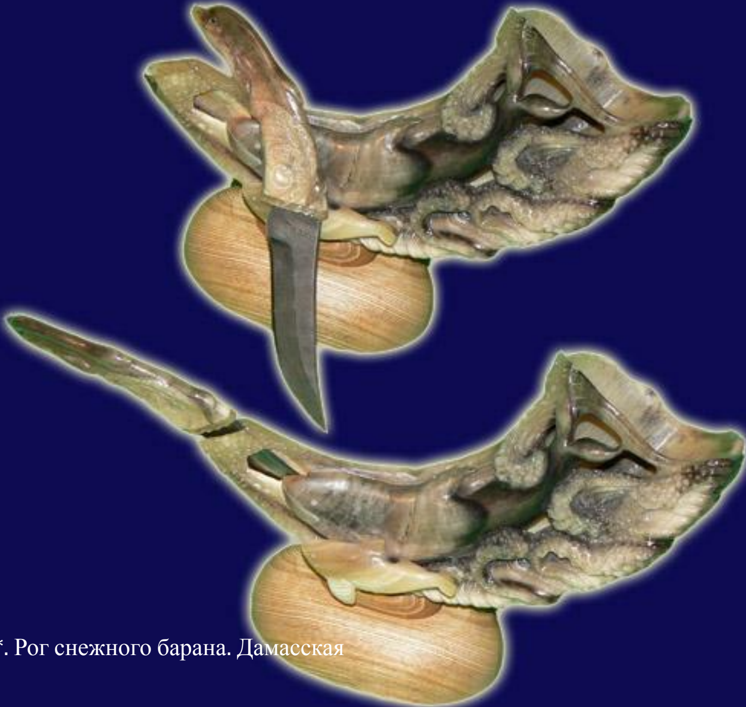
Нож "Рог"* . Рог снежного барана. Дамасская сталь.