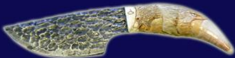
Нож "Каменный век"* . Клык медведя, резьба барельефом.