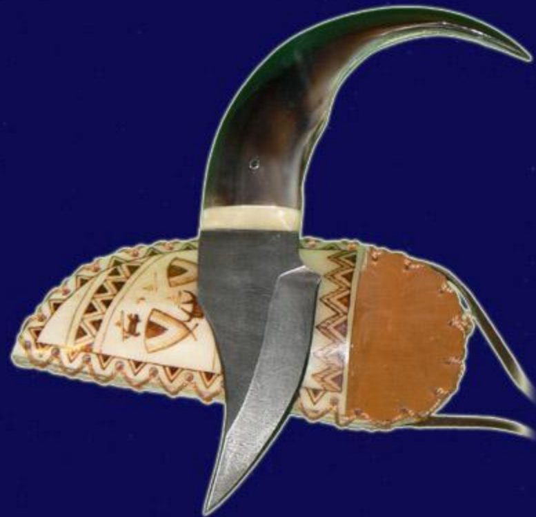
Нож "Коготь"* . Коготь медведя. Дамасская сталь.