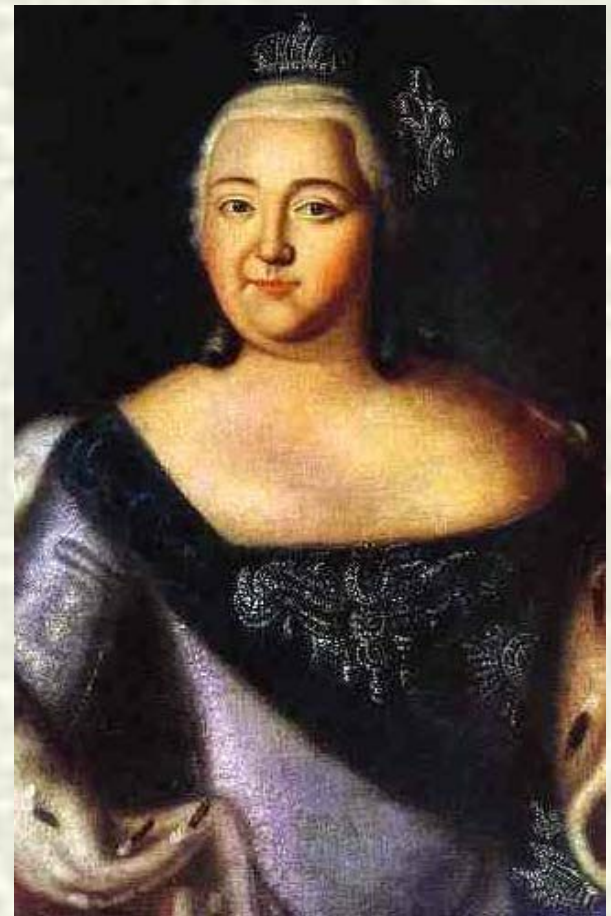
Портрет российской императрицы Елизаветы Петровны.

Выходец из семьи крепостных; был, скорее всего, незаконным ребенком, лишь приписанным к этой семье, поскольку числился «вольнорожденным». Учился в петербургской Академии художеств с 1760. Жил в Петербурге, с 1765 — в Москве, где имел частную школу.