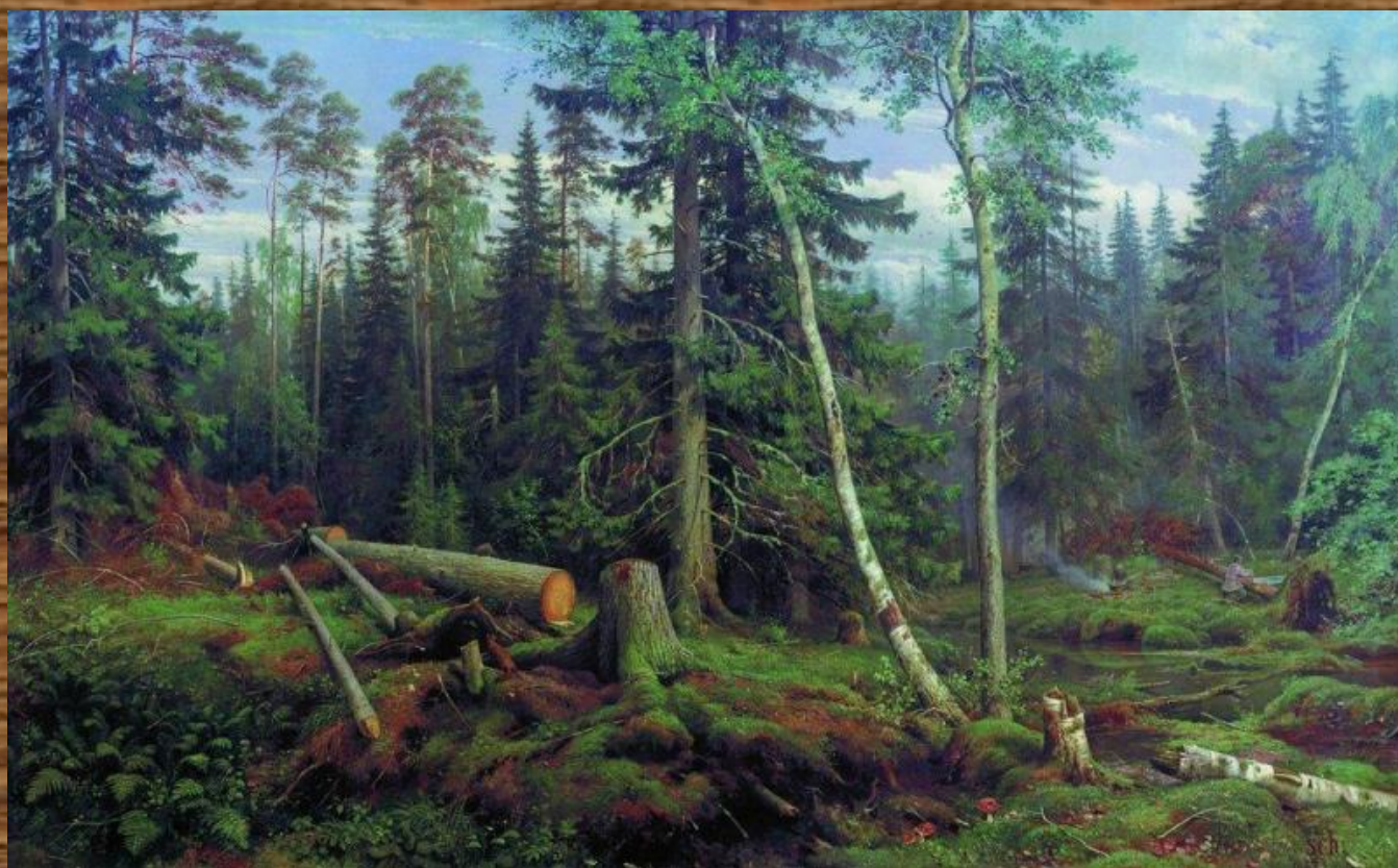
«Рубка леса» 1867

В России художнику было присуждено звание академика (1865 г.). С этого времени начался наиболее плодотворный период творчества живописца. Были созданы картины: