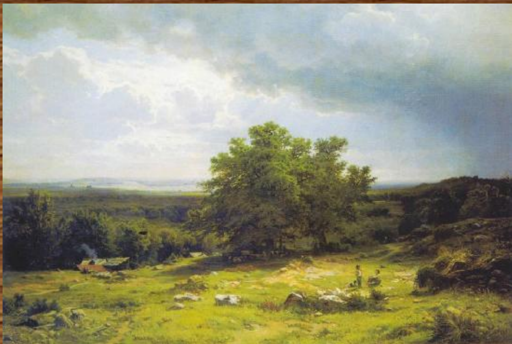
«Вид в окрестностях Дюссельдорфа. 1859»

Достигнутые успехи позволили Шишкину совершить заграничную поездку в качестве стипендиата академии. Путешествие началось с Мюнхена (1861 г.), где Иван Иванович посещал мастерские популярных художников-анималистов Б. и Ф. Адамов. В 1863 г. Шишкин перебрался в Цюрих, затем в Женеву, Прагу, Дюссельдорф. Затосковав по отечеству, он возвратился в Петербург в 1866 г., до истечения срока своего стипендиатства.