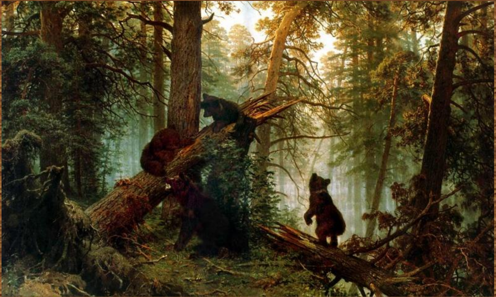
«Утро в сосновом лесу» 1889 (медведи написаны К. А. Савицким)