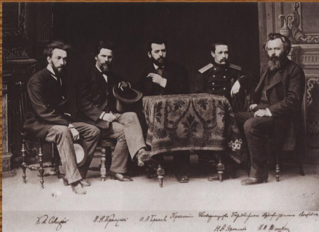
Учредители Товарищества передвижных художественных выставок (1870 г.),

Шишкин активно работал на открытом воздухе, нередко предпринимал с художественной целью путешествия по России. Он почти ежегодно выставлял свои произведения — сначала в академии, а потом, после того как было учреждено Товарищество передвижных художественных выставок (1870 г.), на этих экспозициях.