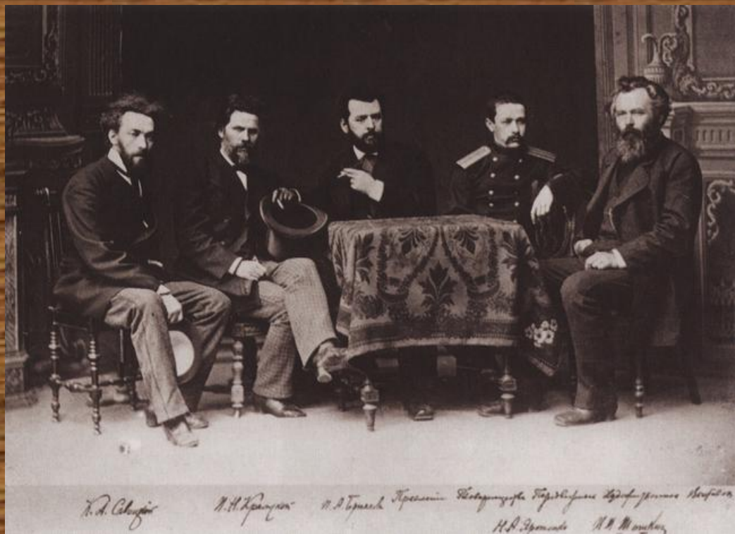
Учредители Товарищества передвижных художественных выставок (1870 г.),

Шишкин активно работал на открытом воздухе, нередко предпринимал с художественной целью путешествия по России. Он почти ежегодно выставлял свои произведения — сначала в академии, а потом, после того как было учреждено Товарищество передвижных художественных выставок (1870 г.), на этих экспозициях.