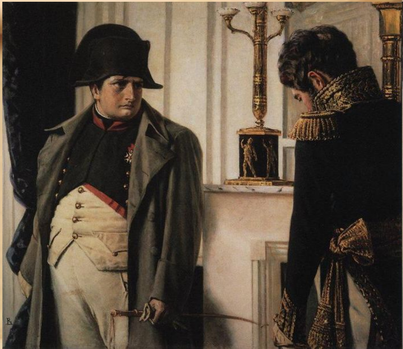
Наполен и маршал Лористон, 1900