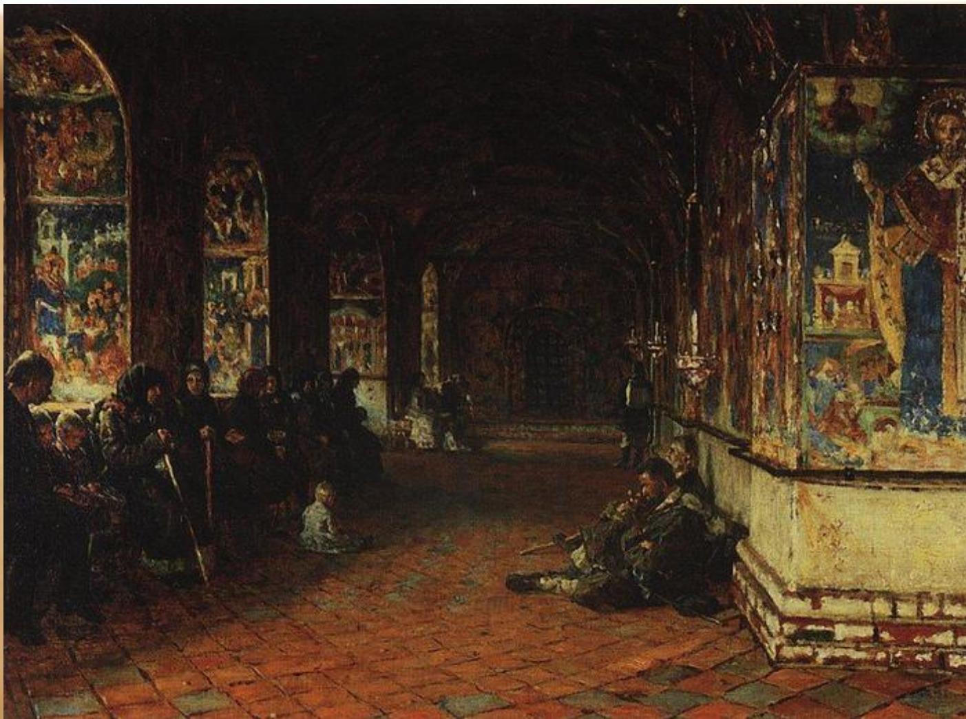
Ярославль. Паперть церкви Иоанна Предтечи в Толчкове