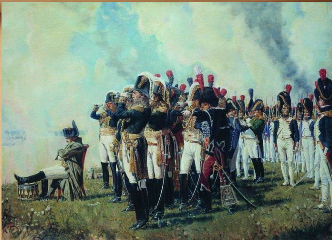
Наполеон на Бородинском поле