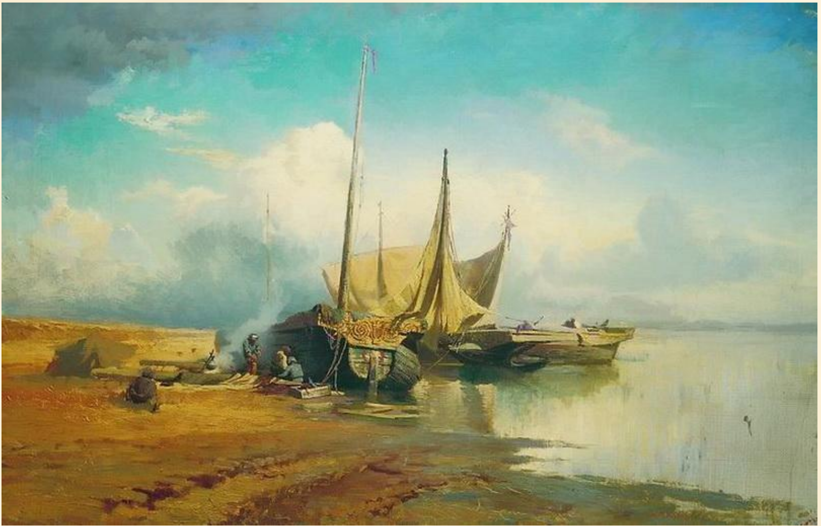
Вид на Волге. Барки.