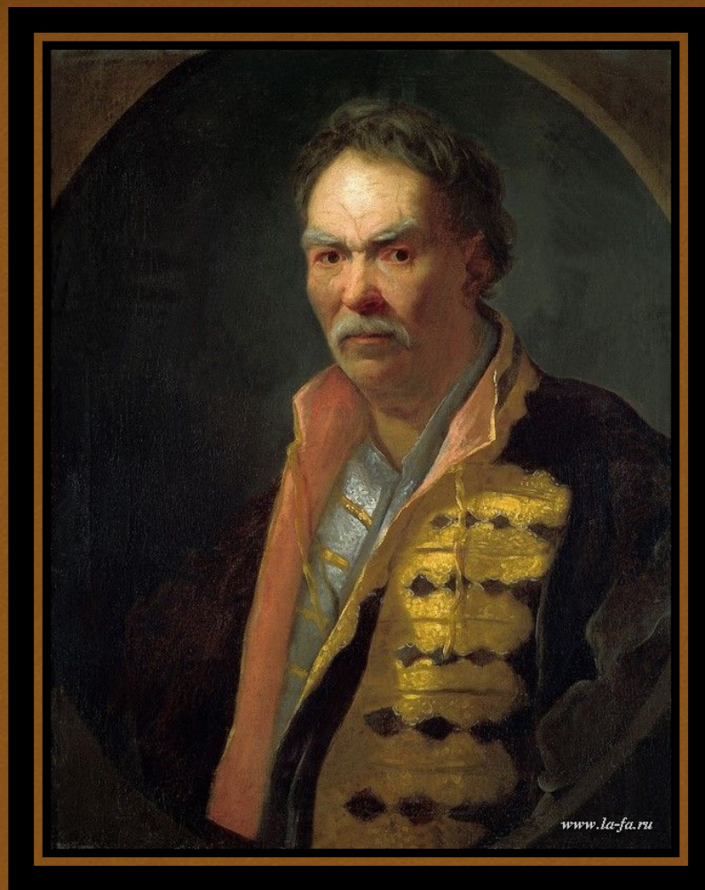
Иван Никитич Никитин Портрет напольного гетмана (1720-е годы)