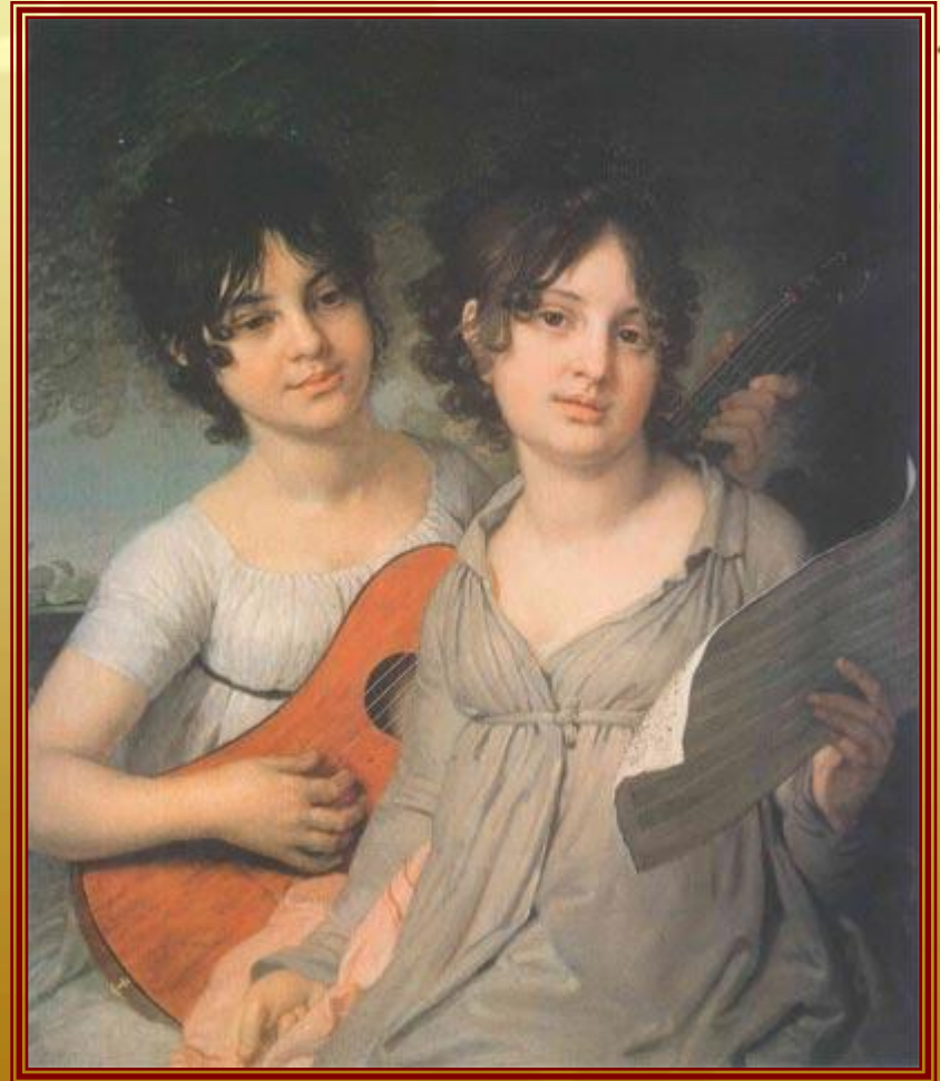
Портрет сестер Гагариных