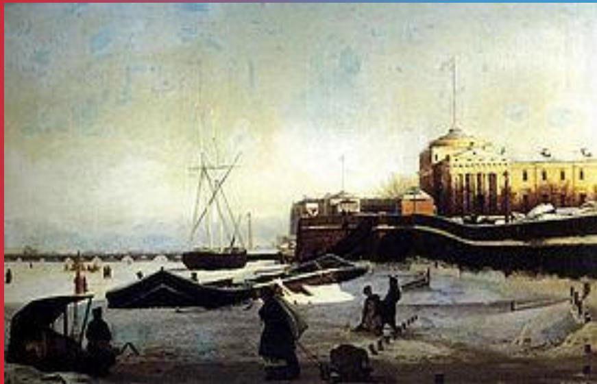
Зима. Петербургский вид. 1859 г.

Николай Григорьевич Абутков (1833—1859) — российский художник.