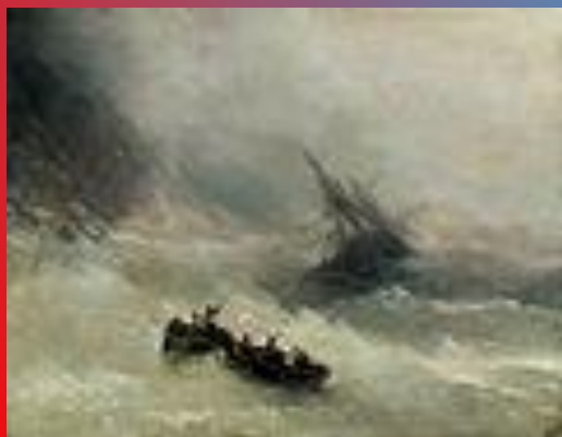
Радуга (картина Айвазовского)