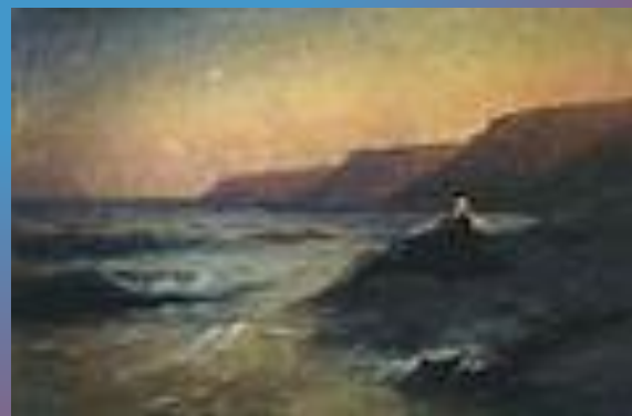
Пушкин на берегу Чёрного моря