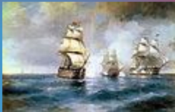
Бриг «Меркурий», атакованный двумя турецкими кораблями