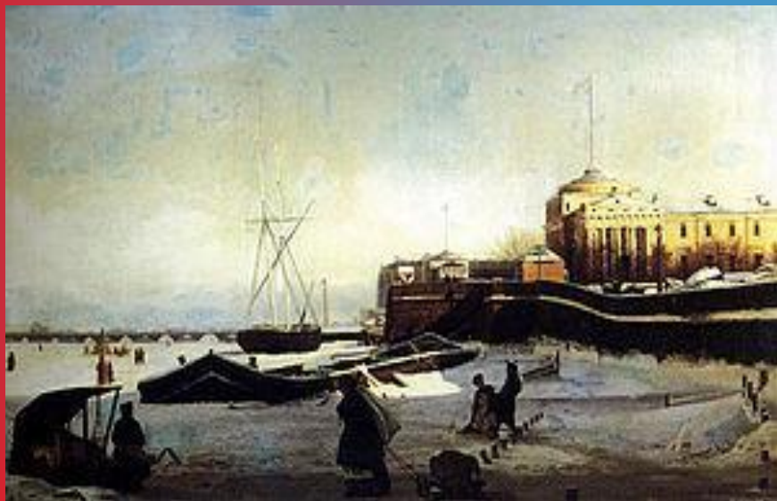
Зима. Петербургский вид. 1859 г.

Николай Григорьевич Абутков (1833—1859) — российский художник.