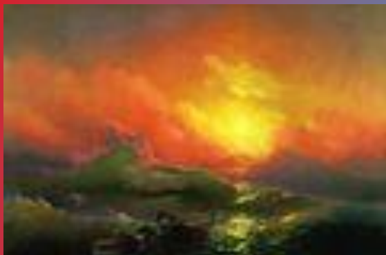
Девятый вал (картина Айвазовского)