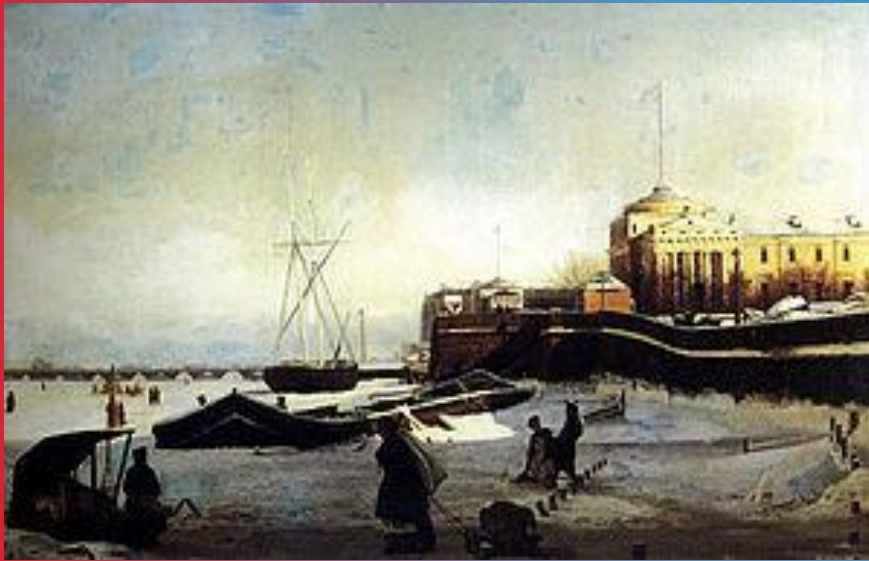
Зима. Петербургский вид. 1859 г.

Николай Григорьевич Абутков (1833—1859) — российский художник.