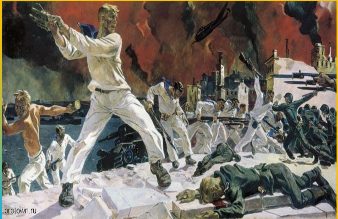
А.А. Дейнека. Оборона Севастополя 1942 г.

Картина А.А. Дейнеки «Оборона Севастополя» (1942), созданная в дни, когда шел «бой... святой и правый, смертный бой не ради славы, ради жизни на земле». В самой теме причина огромного эмоционального воздействия картины. Хотя зрителю известно, что Севастополь был оставлен нашими войсками, но эти сражающиеся насмерть матросы воспринимаются как победители. В итоге они и стали ими.