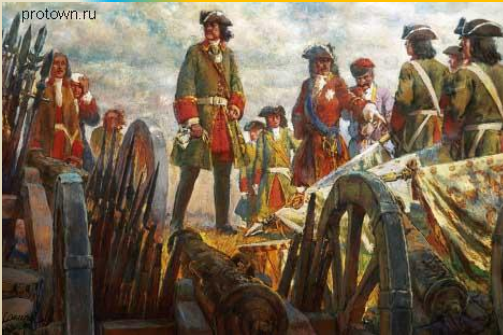
Лансере. Полтавская победа. 1709 год