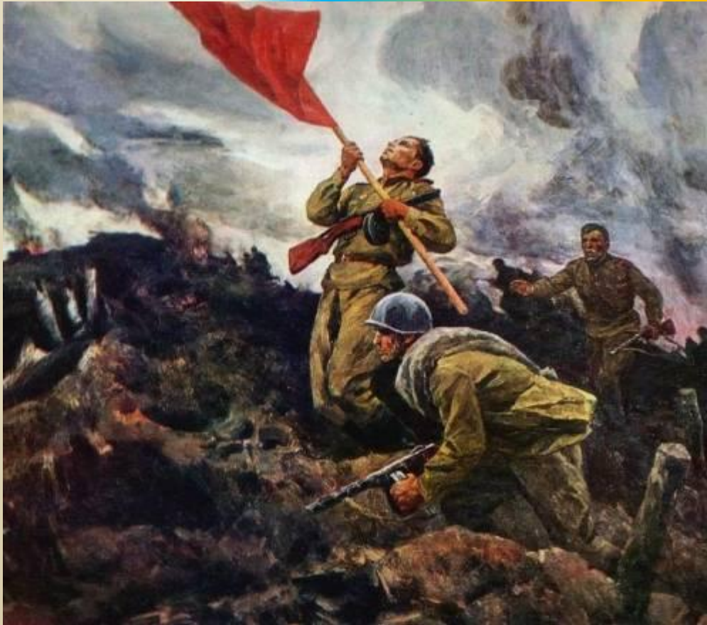
А. Широков. За Родину!

В 1941–1945 гг., в годы великой битвы с фашизмом, художниками было создано немало произведений, в которых они и выразили всю трагедию войны, и прославили подвиг победившего народа.