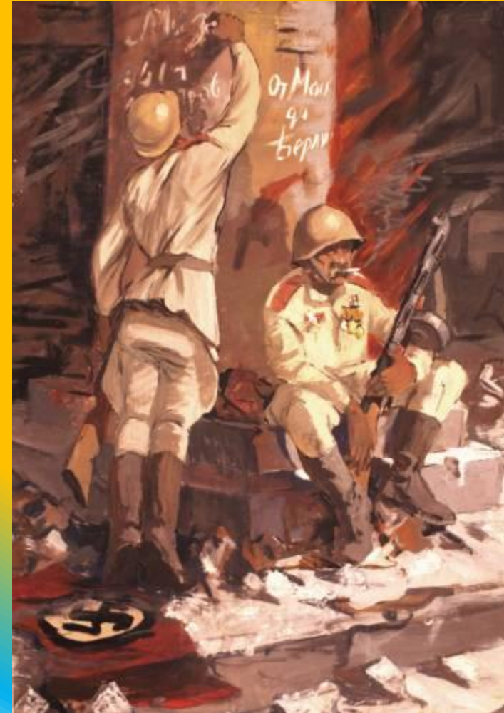
художник Володин С.А.