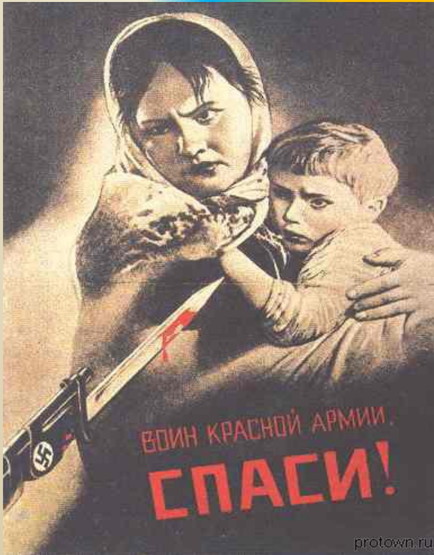
Агитплакат. «Воин красной армии, спаси!»

В годы войны появились значительные произведения станковой графики. Это и быстрые фронтовые зарисовки, разные по технике, стилю и художественному уровню.