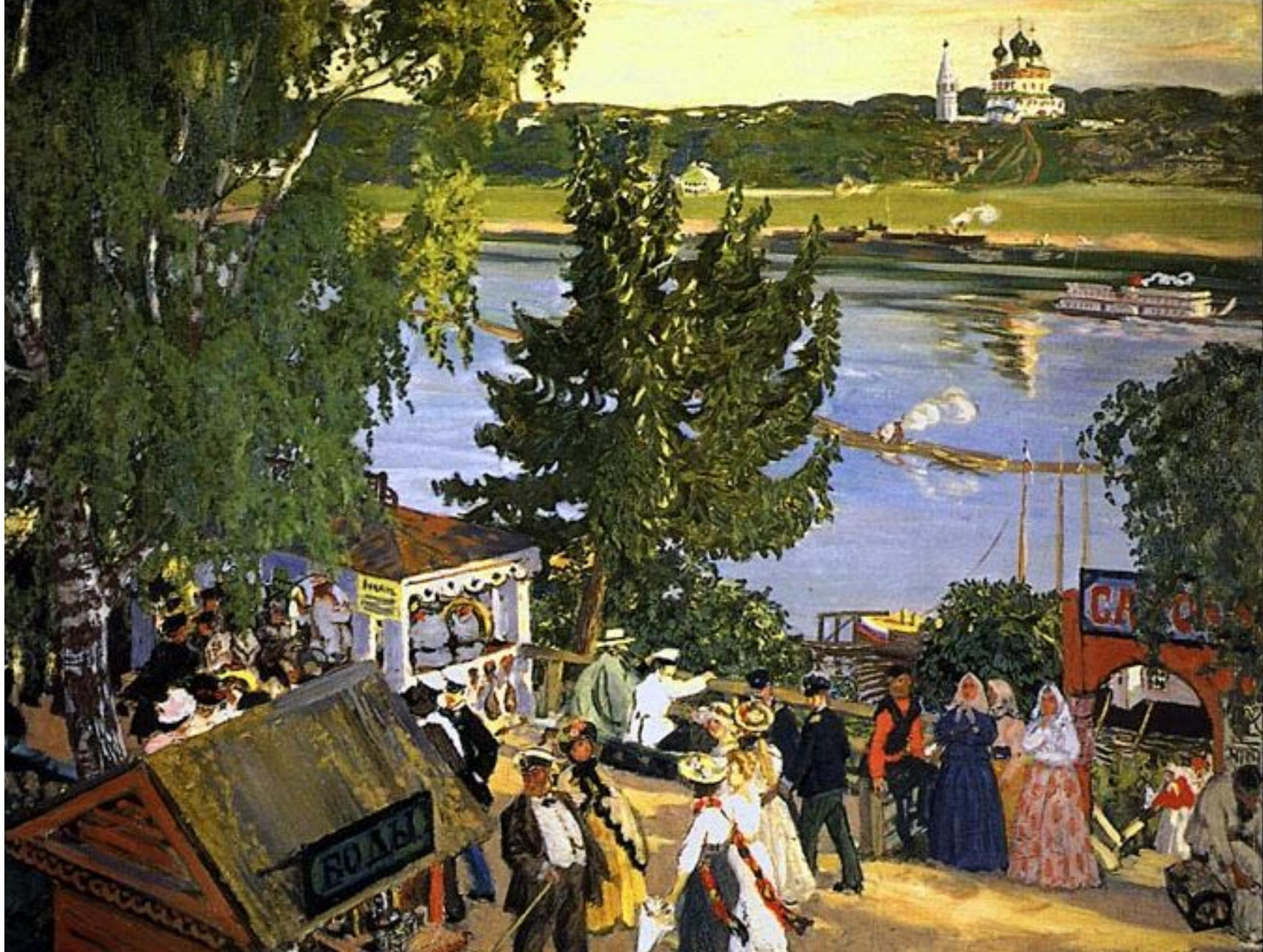
Борис Кустодиев. Прогулка на Волге. 1909 год. Изображена романовская сторона города Тутаева Ярославской области