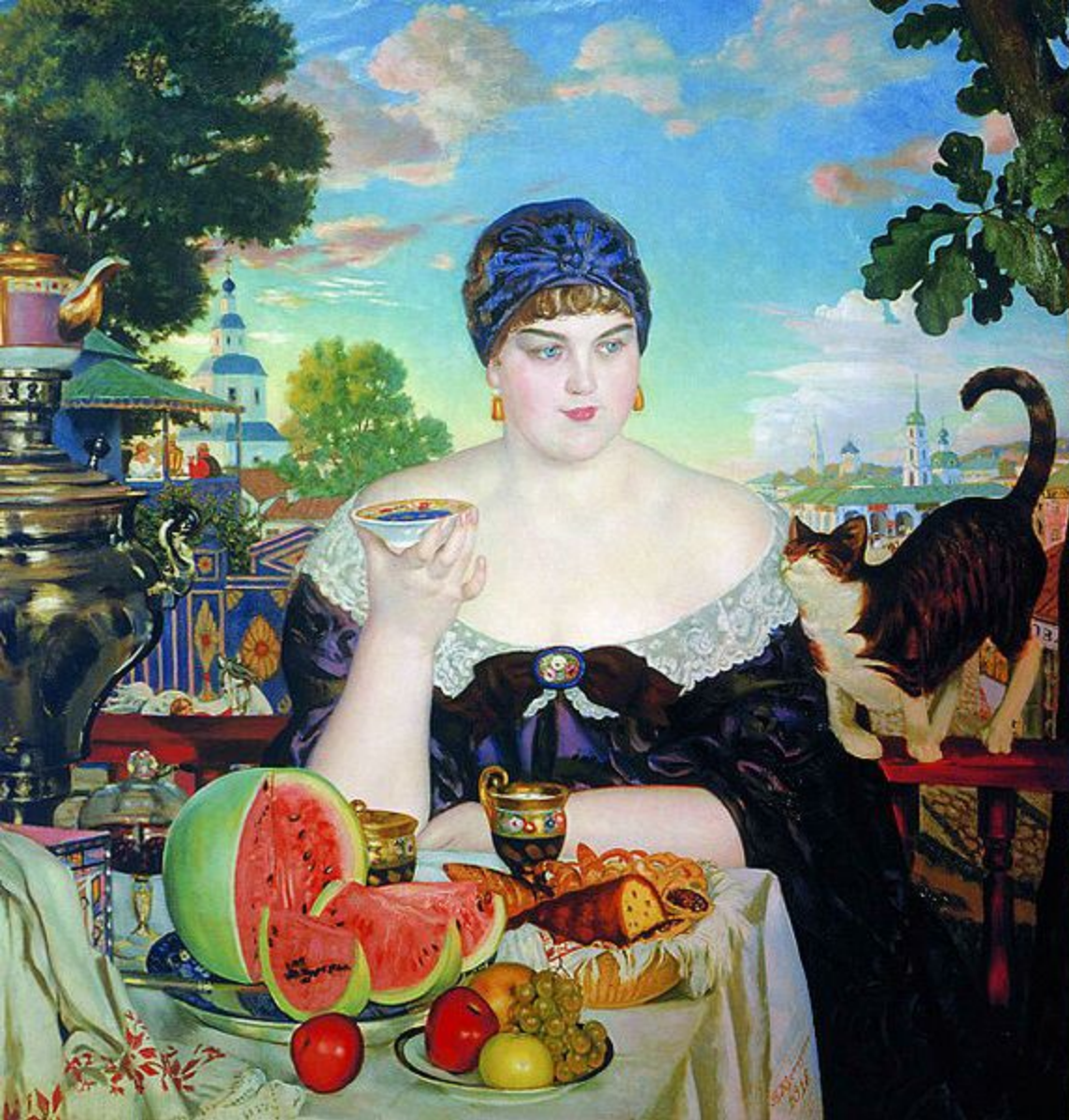
Купчиха за чаем. 1918. 1918. ГРМ

создавал поэтическую мечту, сказку о провинциальной русской жизни. Большое значение в этих работах придаётся линии, рисунку, цветовому пятну, формы обобщаются и упрощаются — художник обращается к гуаши Работы зрелищные, декоративные раскрывают русский характер через бытовой жанр. На глубоко реалистичной основе Кустодиев создавал поэтическую мечту, сказку о провинциальной русской жизни. Большое значение в этих работах придаётся линии, рисунку, цветовому пятну, формы обобщаются и упрощаются — художник обращается к гуаши , темпере .