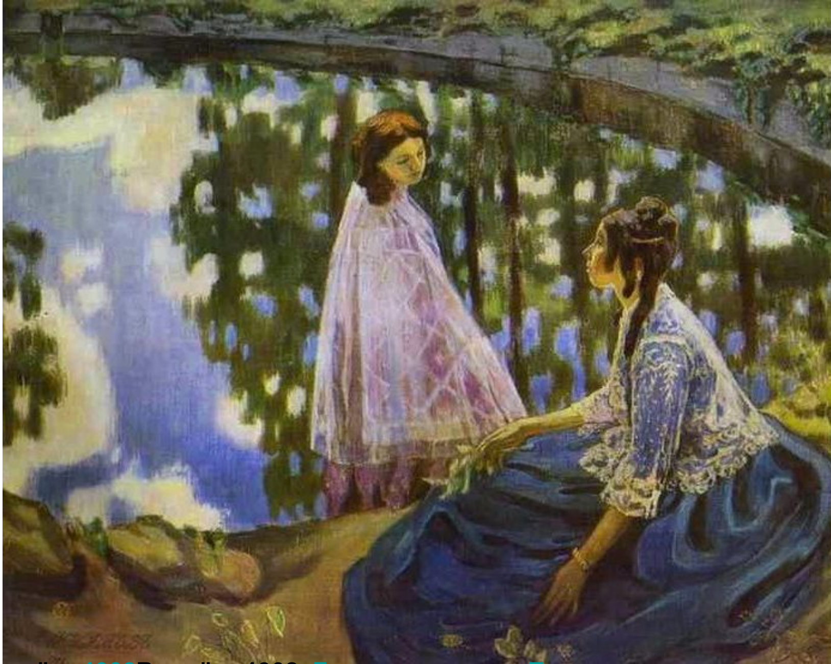
Водоём, 1902 Водоём, 1902, Государственная Третьяковская галерея Водоём, 1902, Государственная Третьяковская галерея, Москва Борисов- Мусатов