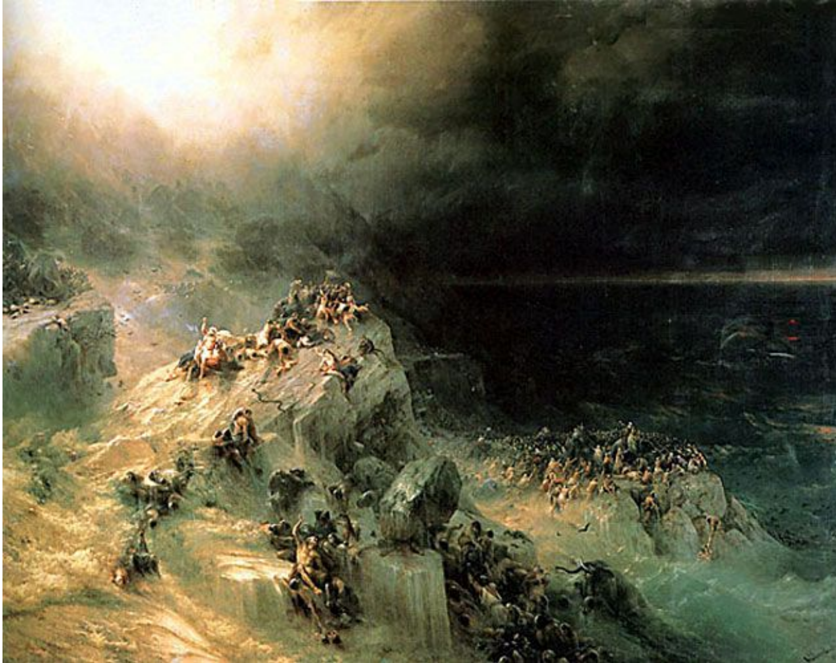
"Всемирный потоп" 1864 Айвазовский