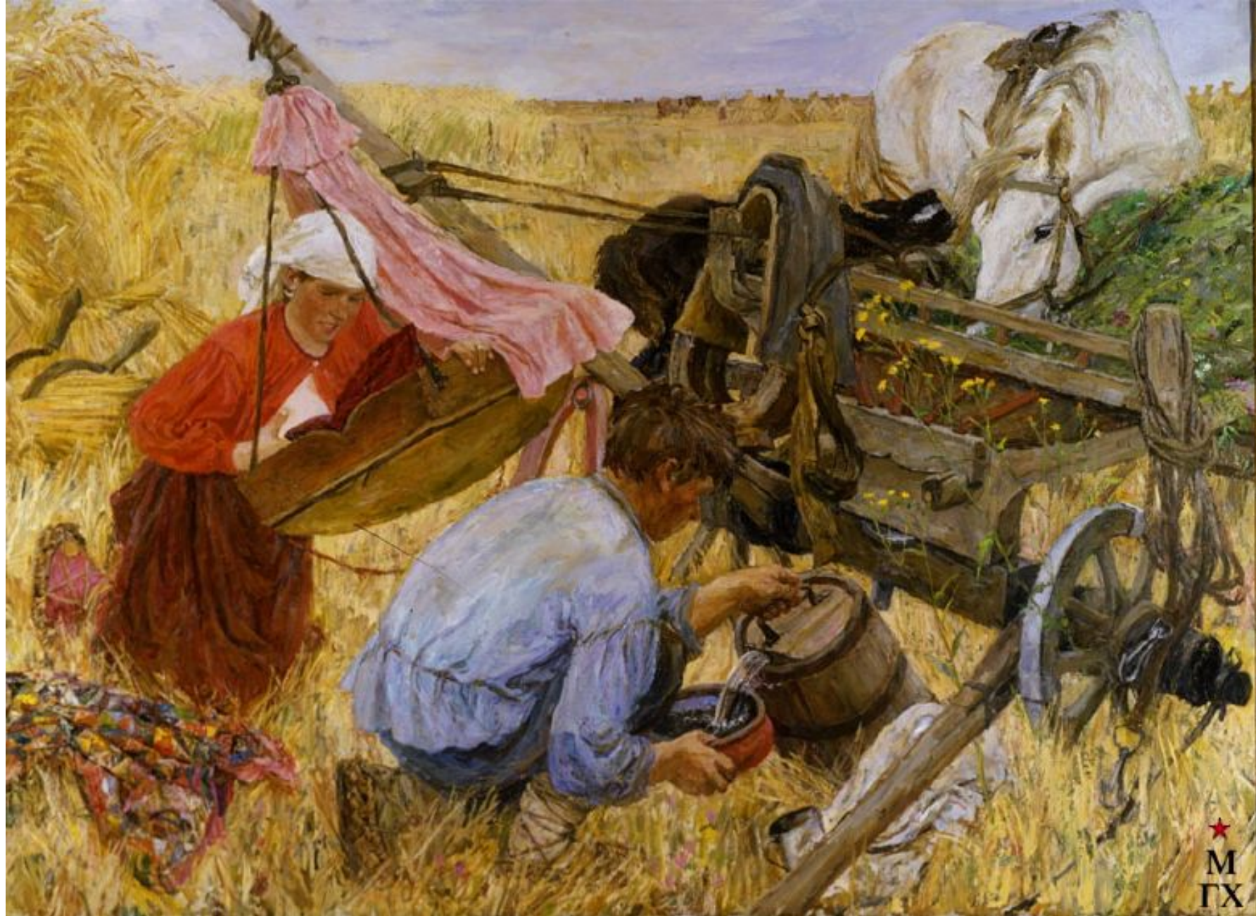
Из прошлого. 1969-1970. Пластов.