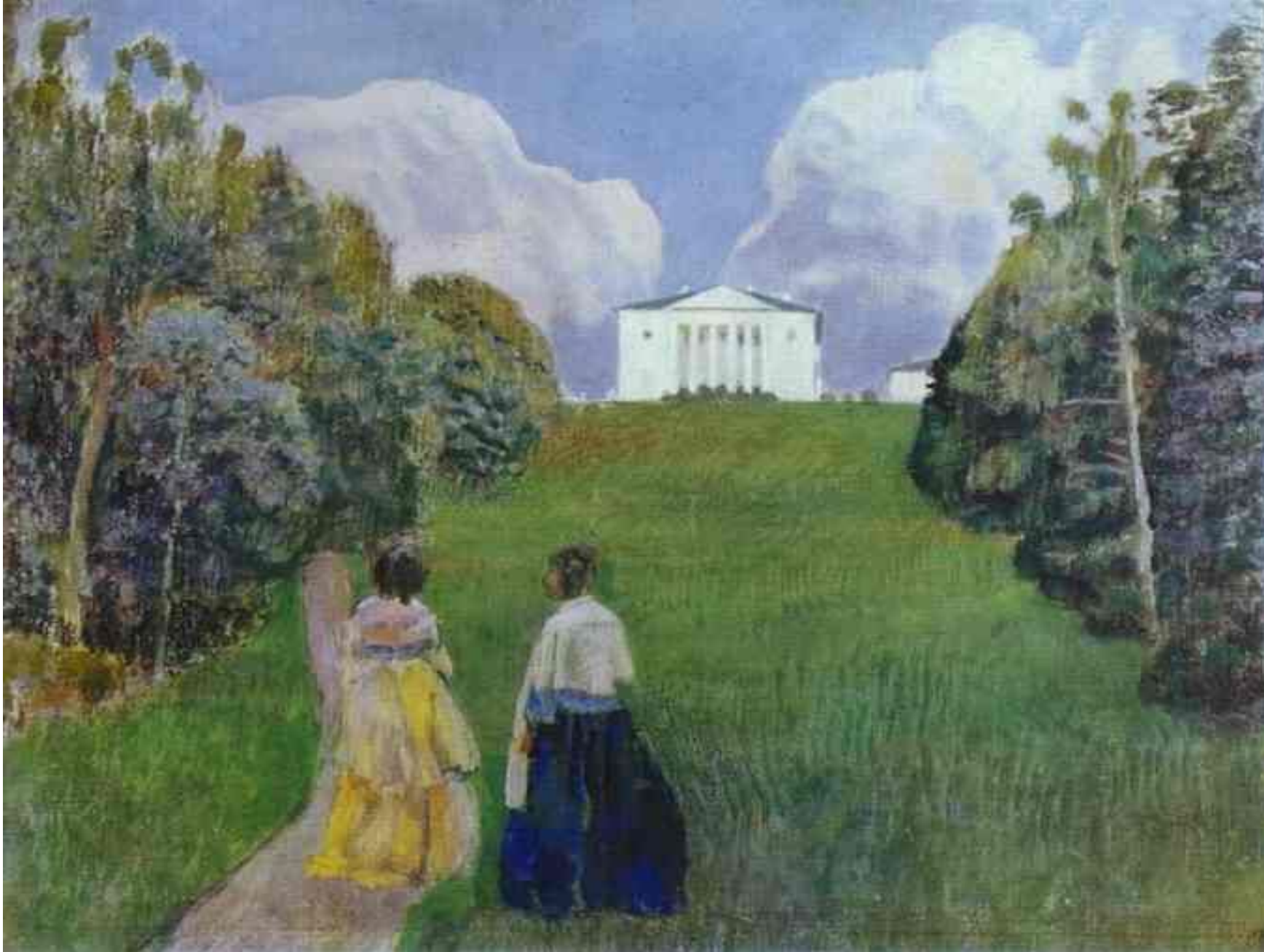
Галерея картин Галерея картин / 1904 — Весенняя история БОРИСОВ-МУСАТОВ