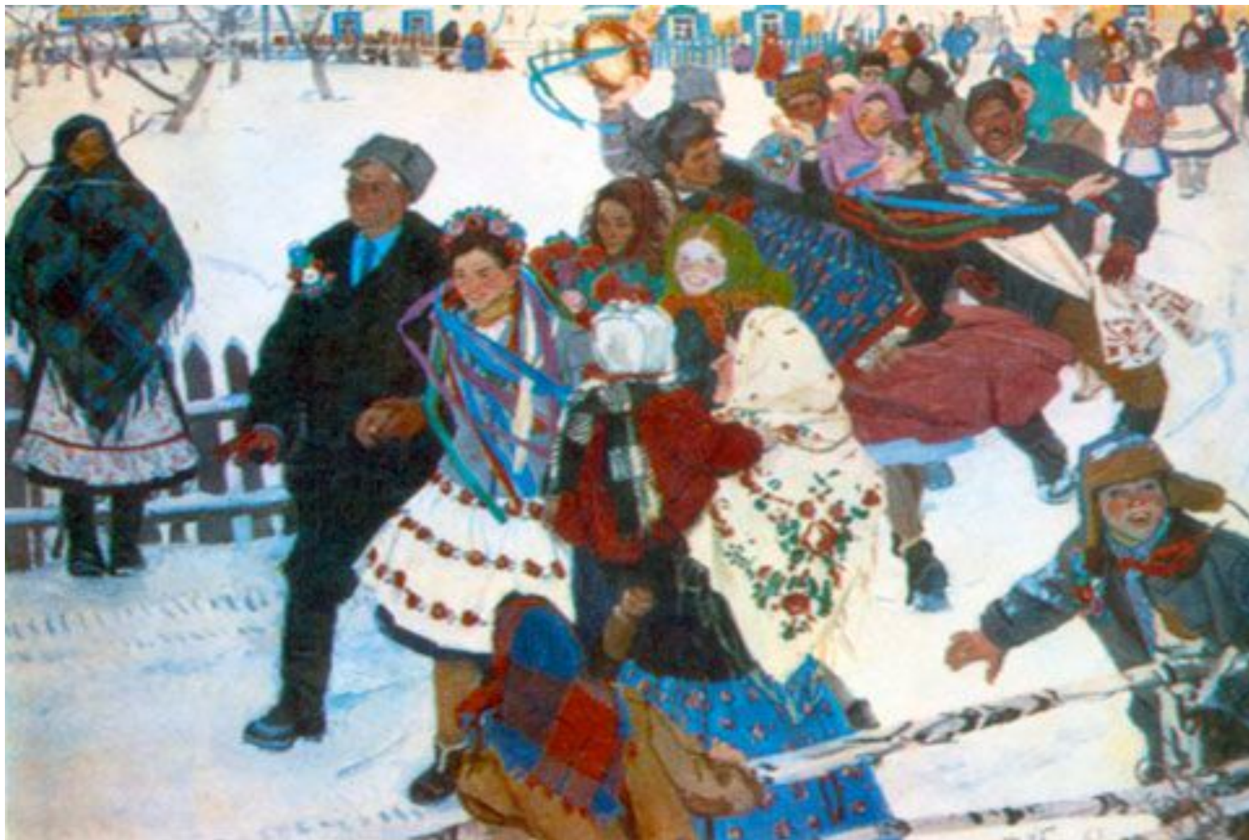
Татьяна Яблонская. «Свадьба», 1963 (оригинал)