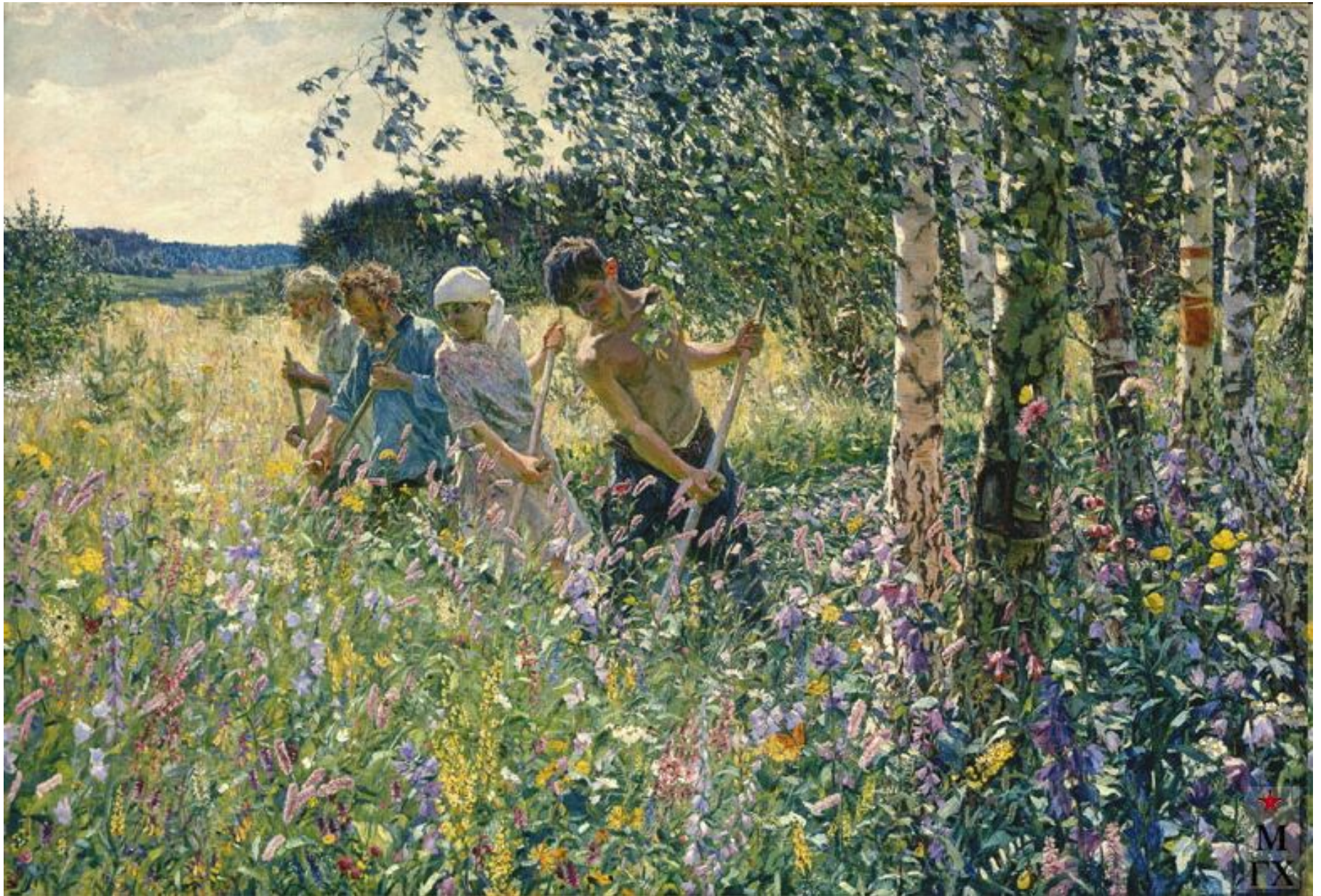
Сенокос. 1945г. Пластов.