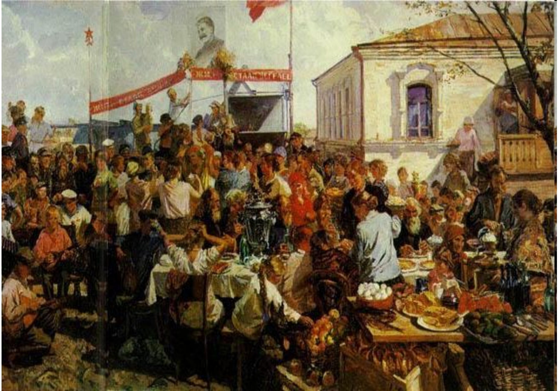
Колхозный праздник (Праздник урожая). 1937г.Пластов.