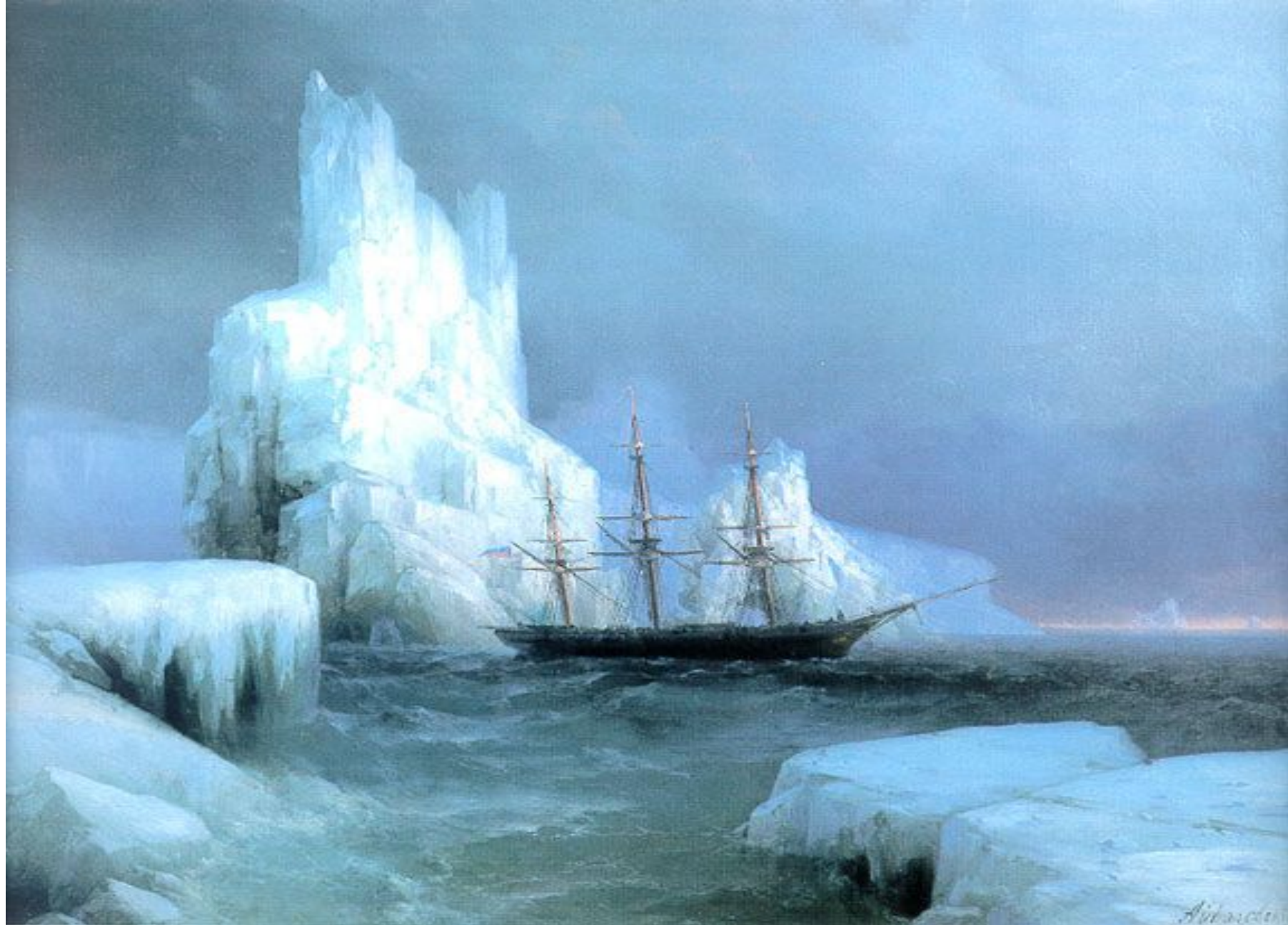
Ледяные горы 1870