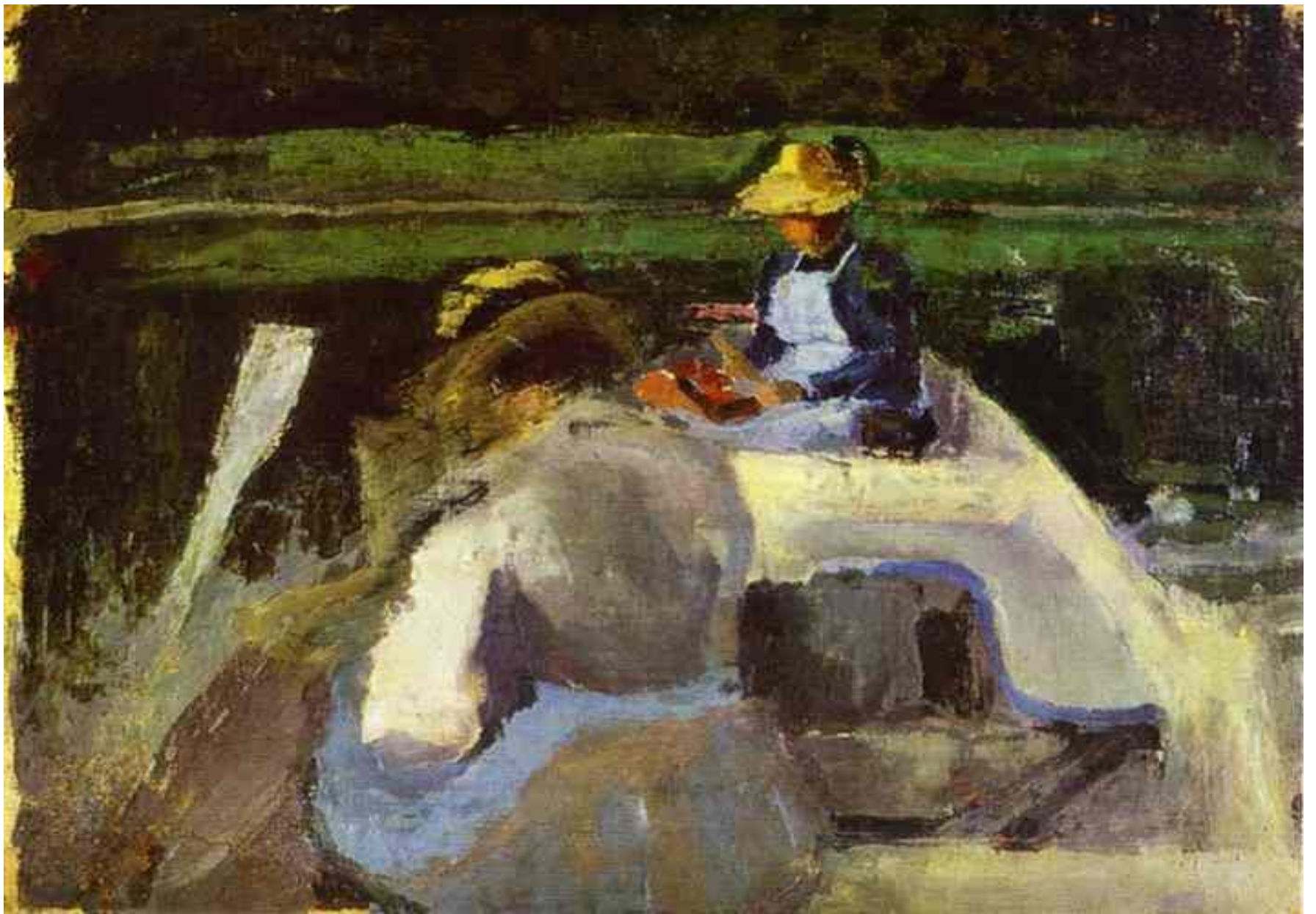
НА ЛОДКЕ 1982 БОРИСОВ- МУСАТОВ