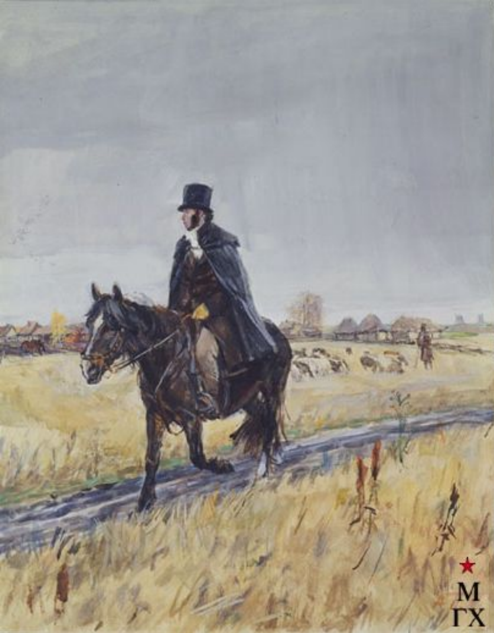
А.С. Пушкин в Болдино. 1949. бум. темпера. 60. Пластов.