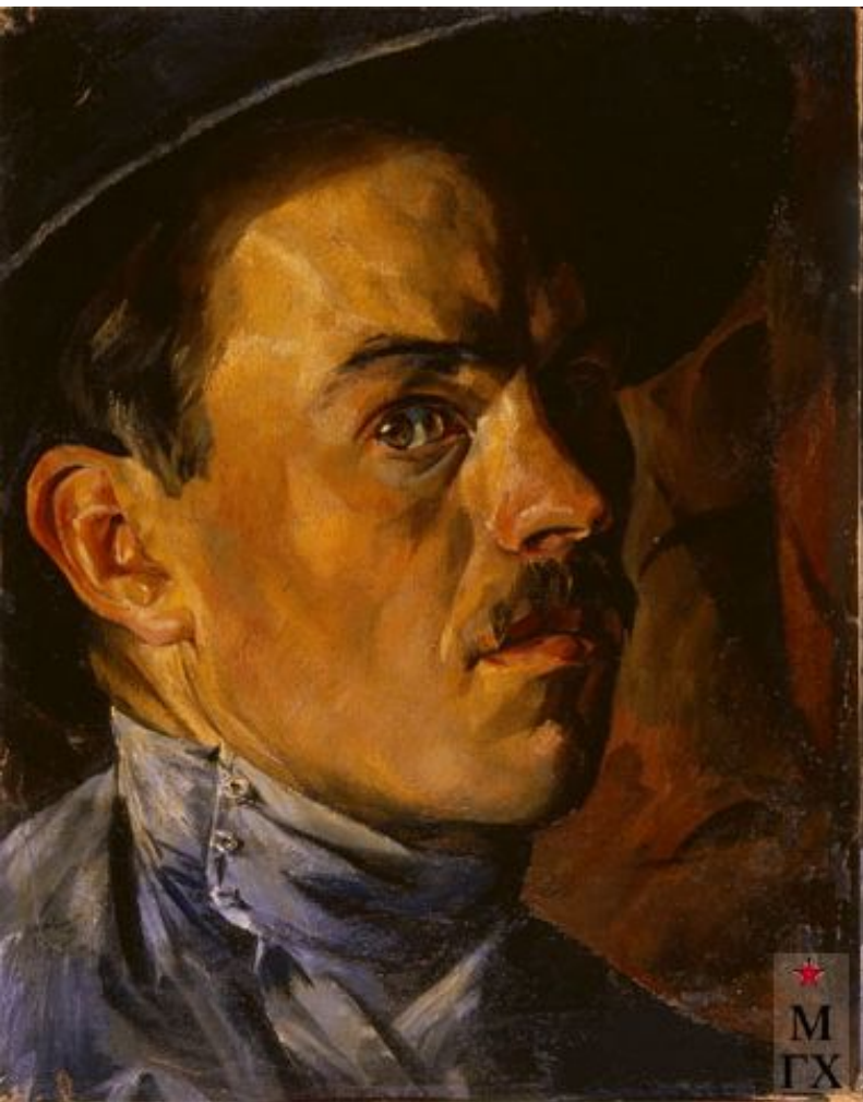
Автопортрет. Аркадий Александрович Пластов

Советский живописец. Заслуженный деятель искусств РСФСР, действительный член Академии художеств СССР (с 1947 ). С 1935 выступал с жанровыми картинами, отмеченными знанием быта советской деревни, любовью к её людям, жизненностью образов, живописным. Откликаясь на события, волнующие советский народ, Пластов изображал, как преломляются они в колхозной жизни; в качестве действующих лиц в картинах Пластова выступают обычно его односельчане.