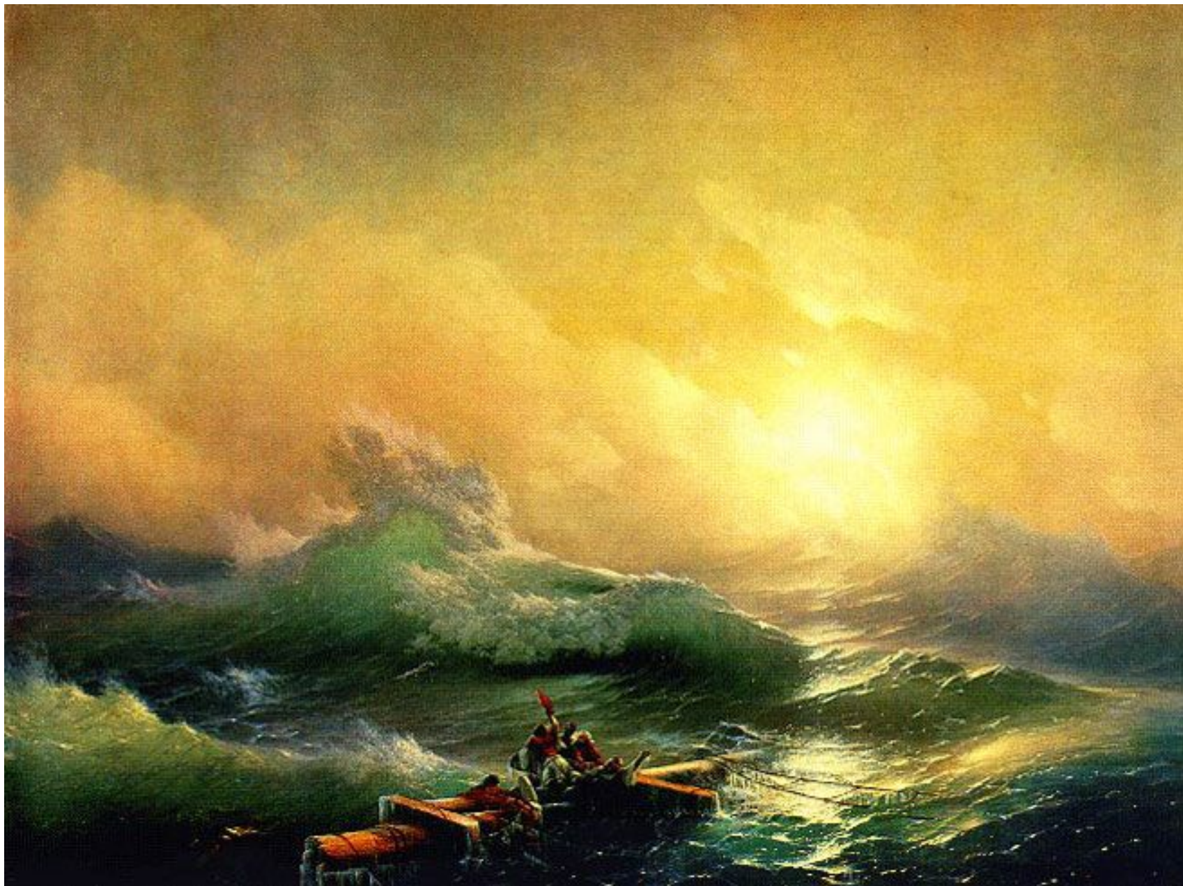
Девятый вал Айвазовский