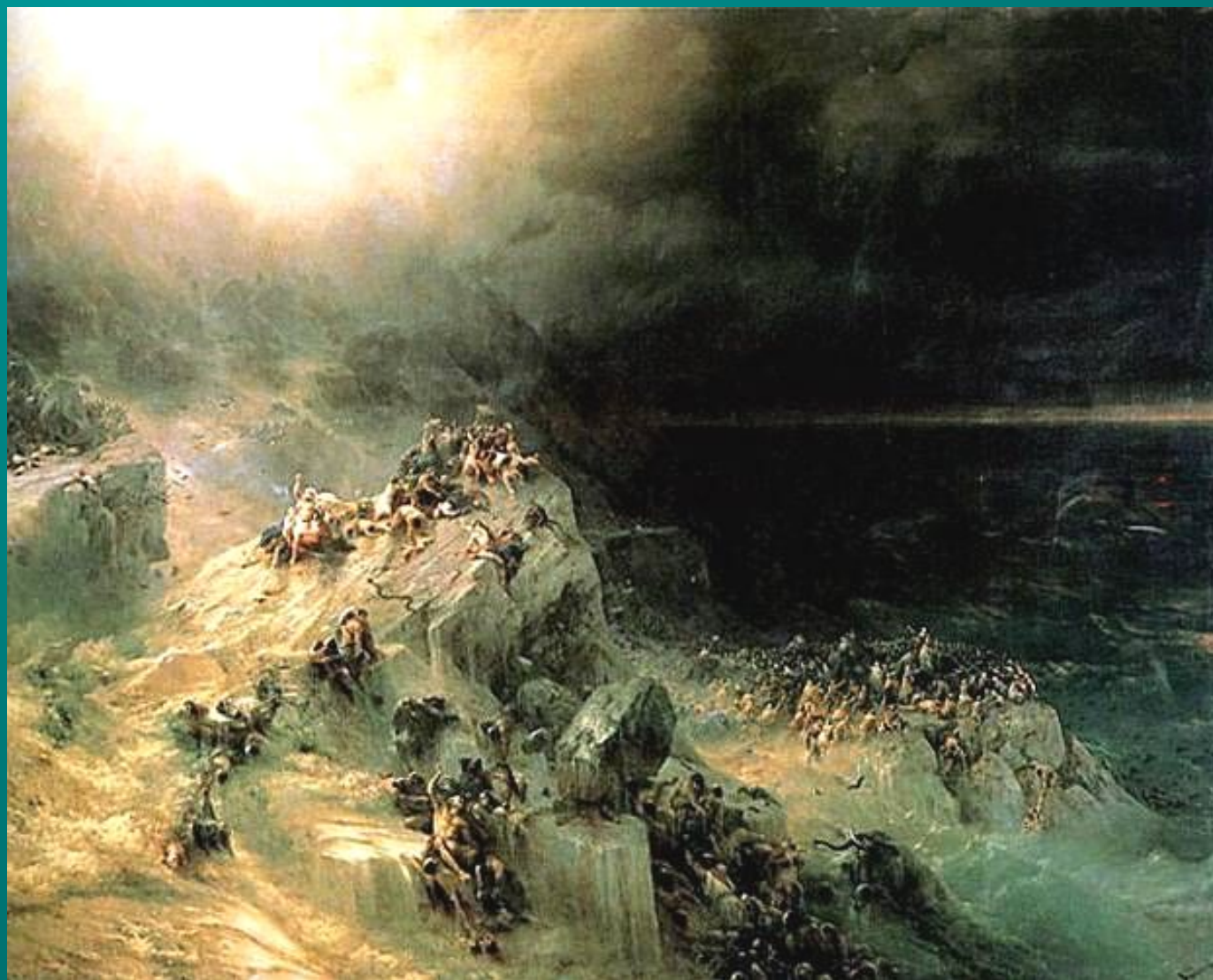
Всемирный потоп 1864

Иногда художник обращался к библейским сюжетам