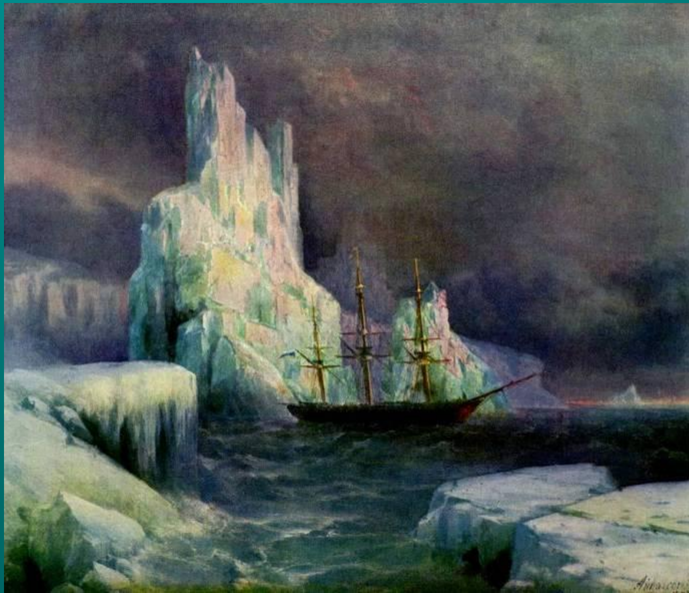
Ледяные горы 1870

Кроме изображения воды , художник прекрасно изображал снег и лёд .