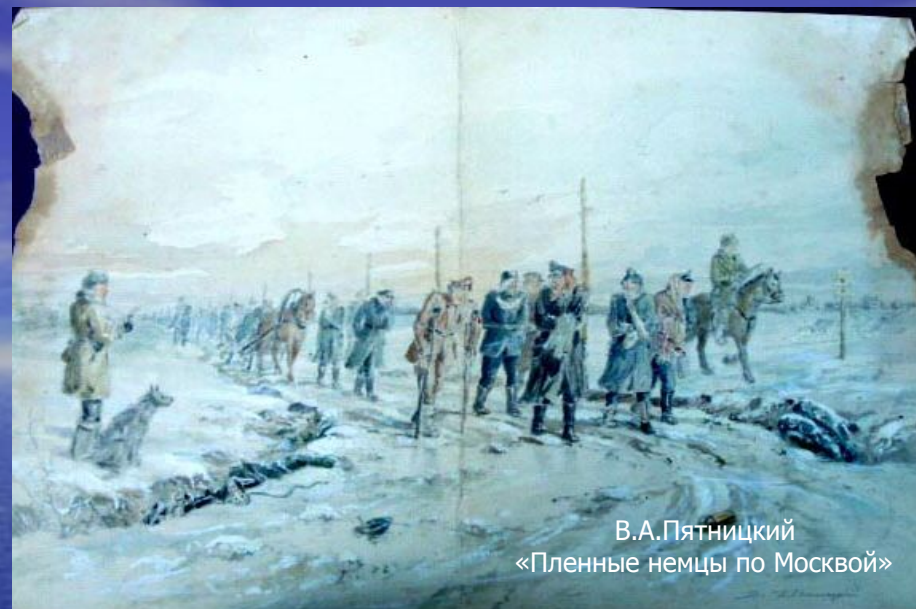
В.А.Пятницкий «Пленные немцы по Москвой»