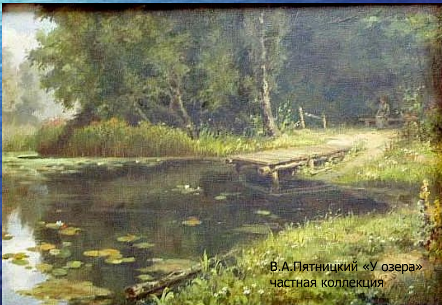
В.А.Пятницкий «У озера» частная коллекция