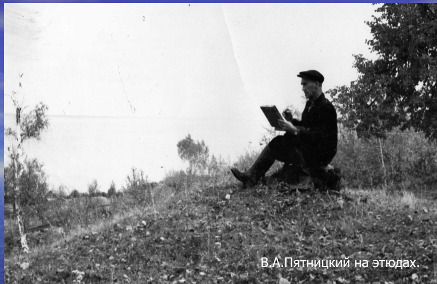
В.А.Пятницкий на этюдах.