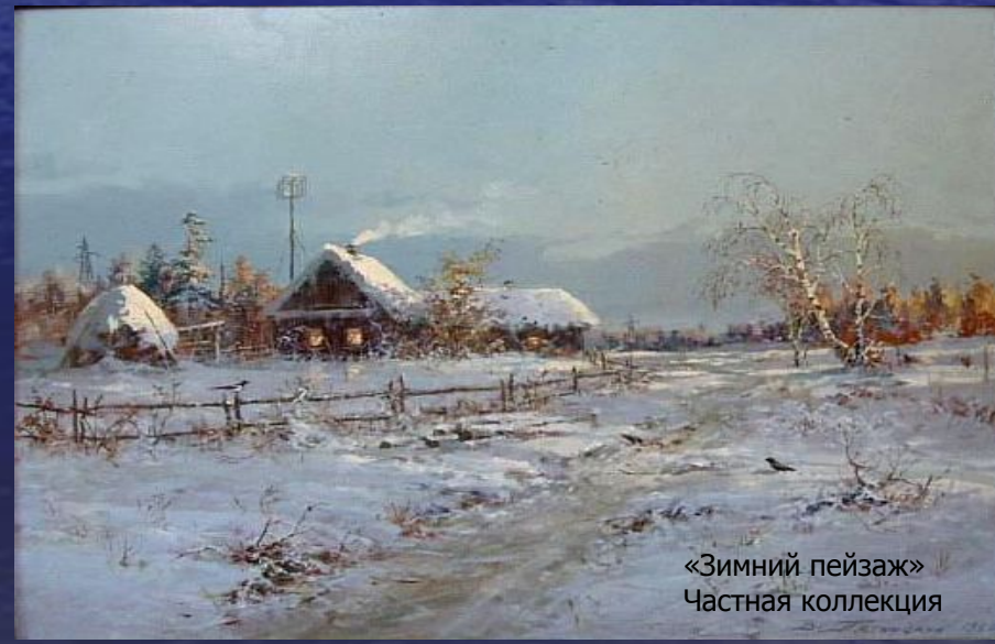
«Зимний пейзаж» Частная коллекция