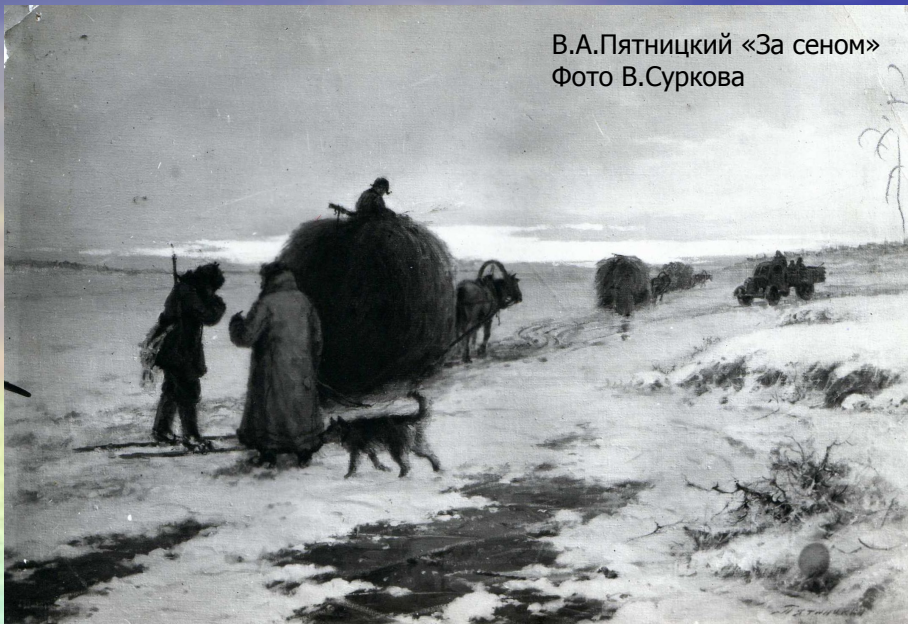
В.А.Пятницкий «За сеном»