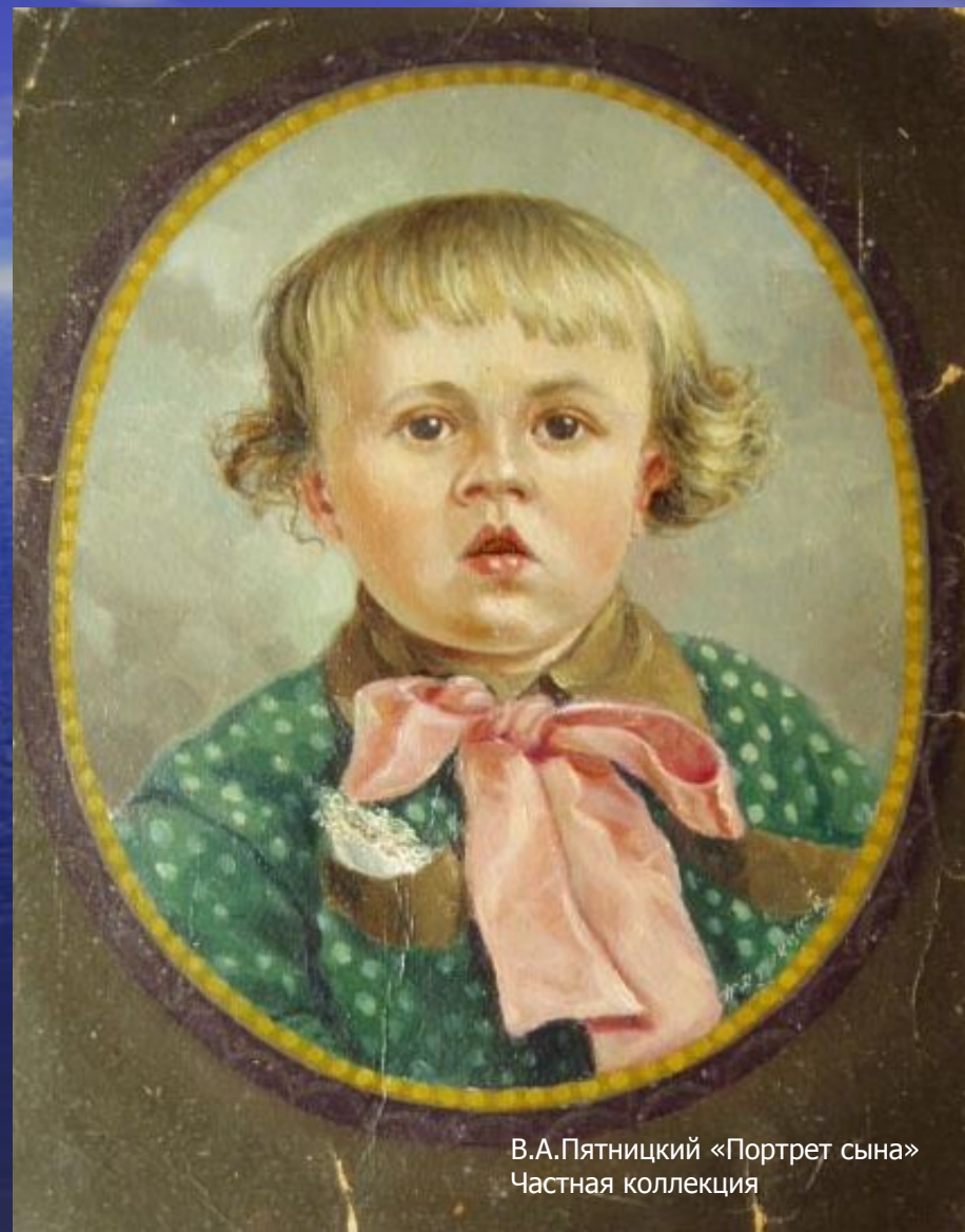
В.А.Пятницкий «Портрет сына» Частная коллекция