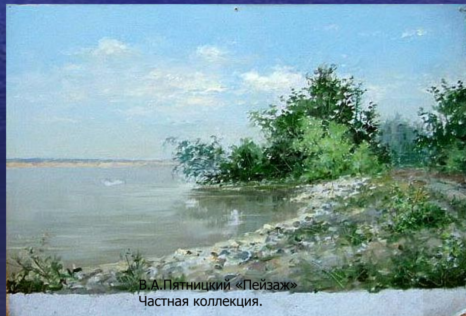
В.А.Пятницкий «Пейзаж» Частная коллекция.