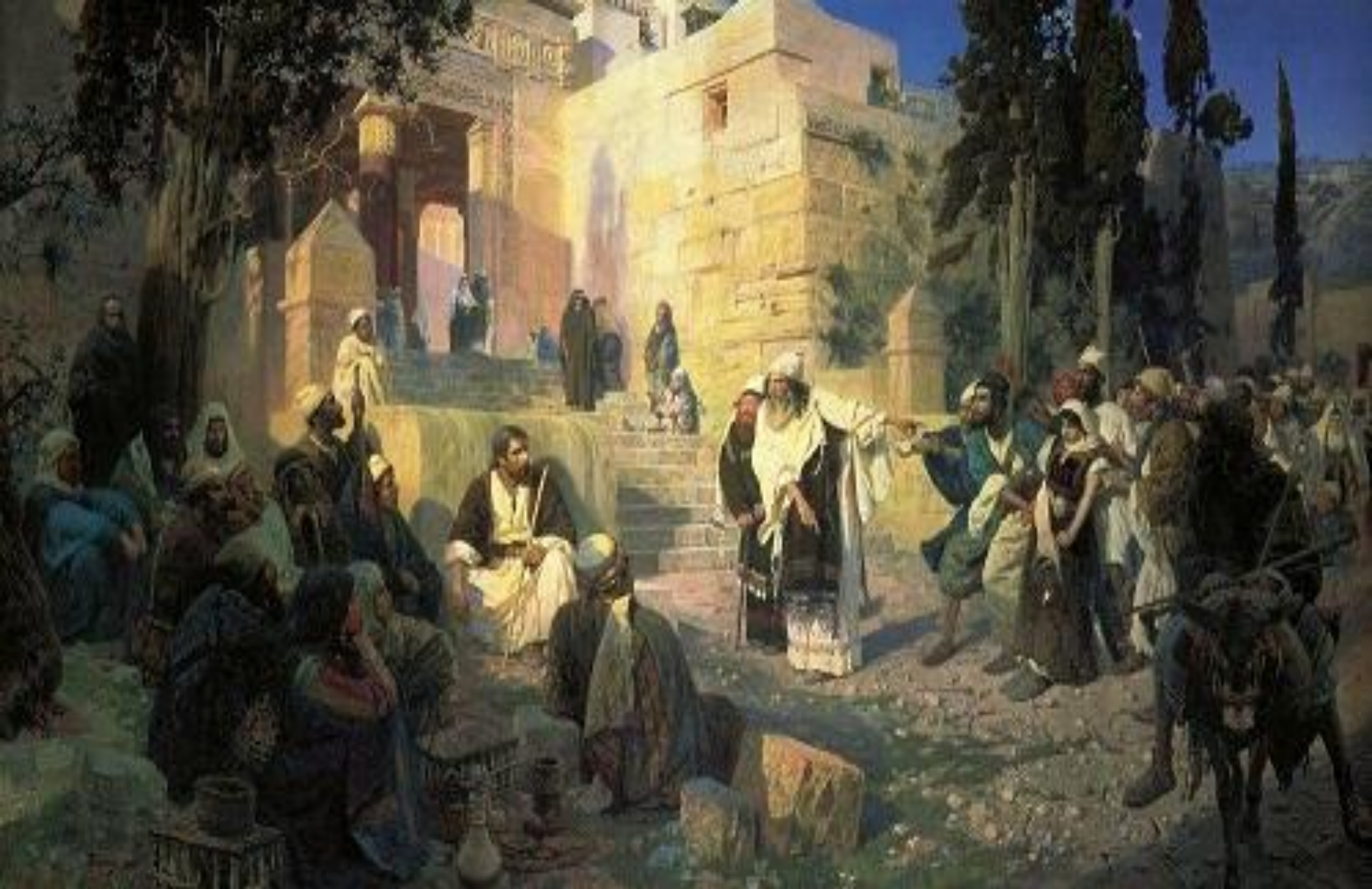
Василий Поленов «Христос и грешница»