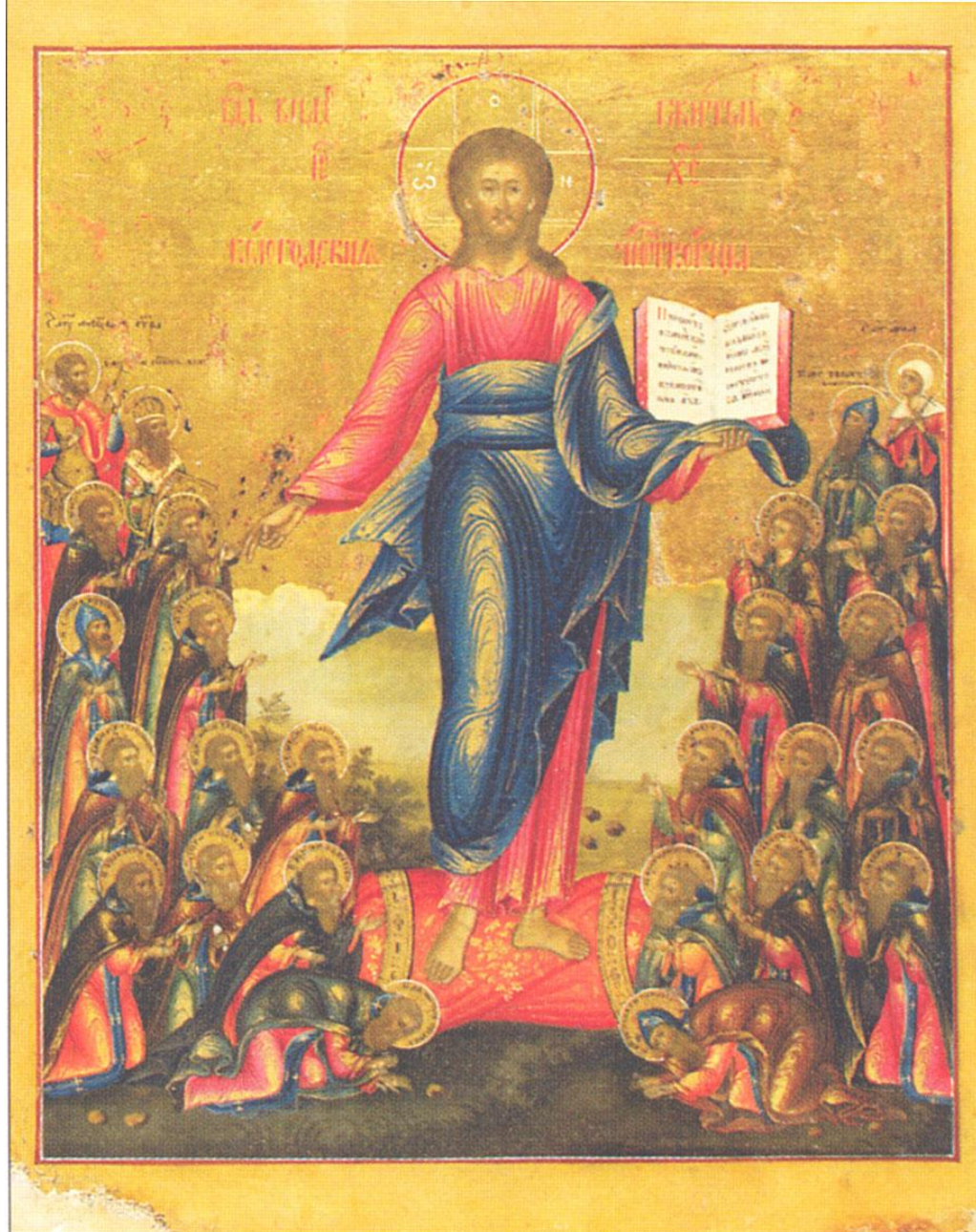
Икона Господь Вседержитель с вологодскими святыми