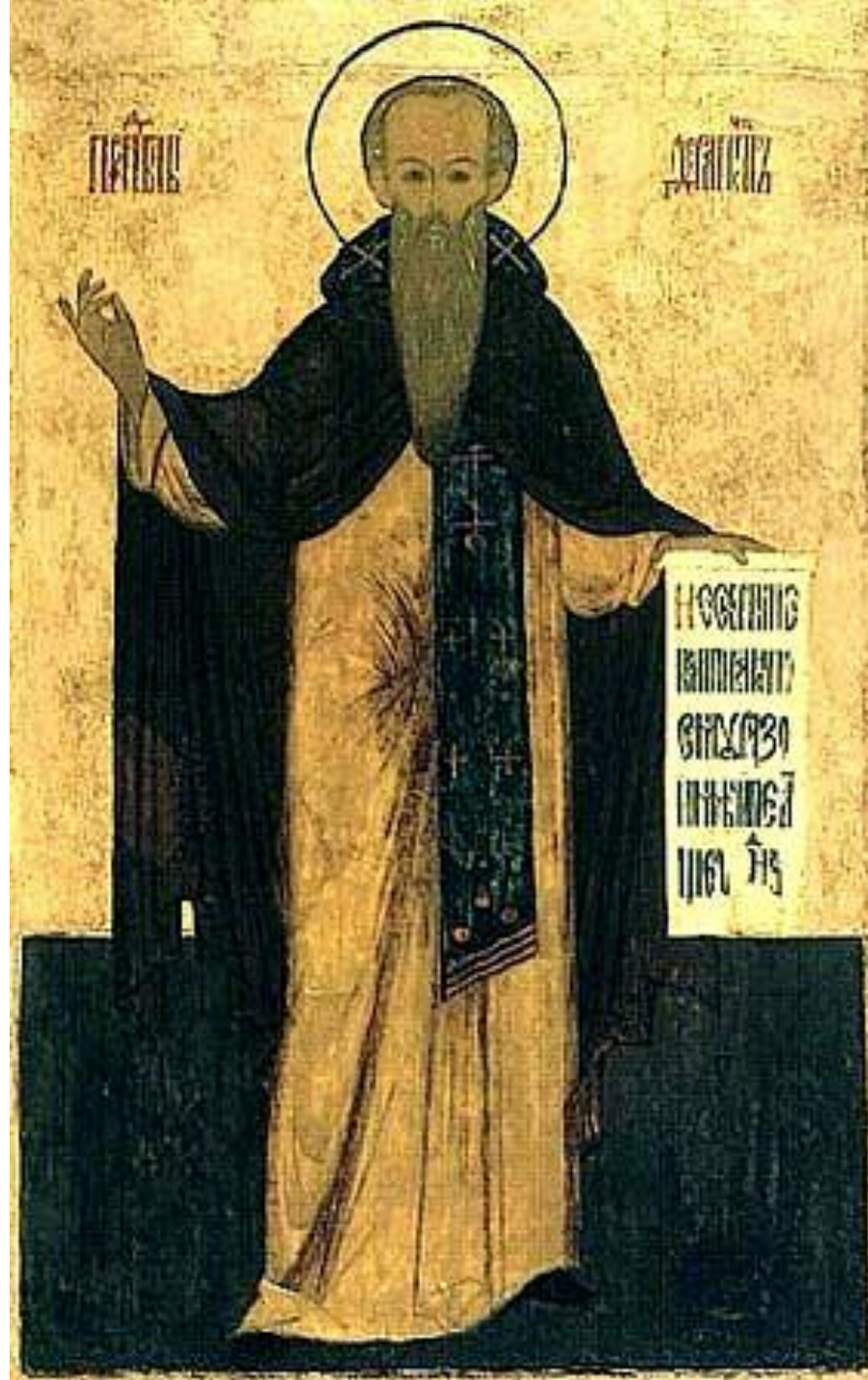
Преподобный Ферапонт Белозерский