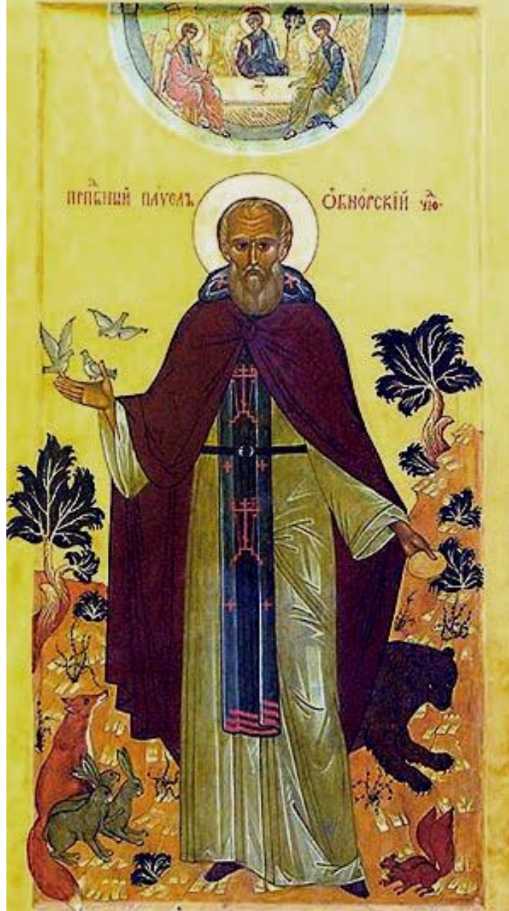
Преподобный Павел Обнорский