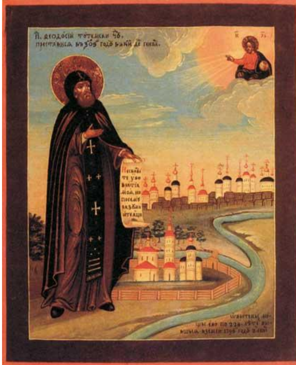
Преподобный Феодосий Тотемский