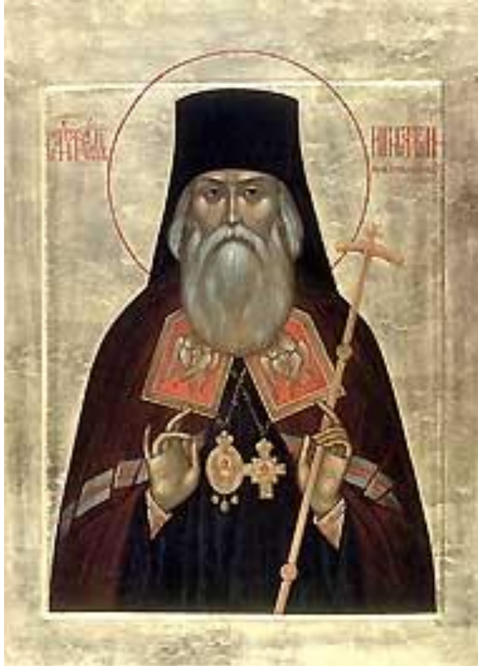
Святитель Игнатий (Брянчанинов)