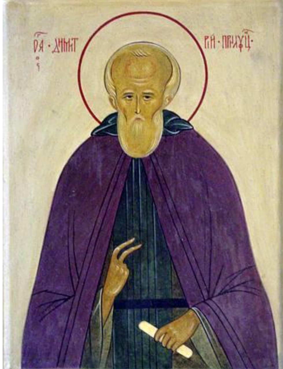
Преподобный Димитрий Прилуцкий