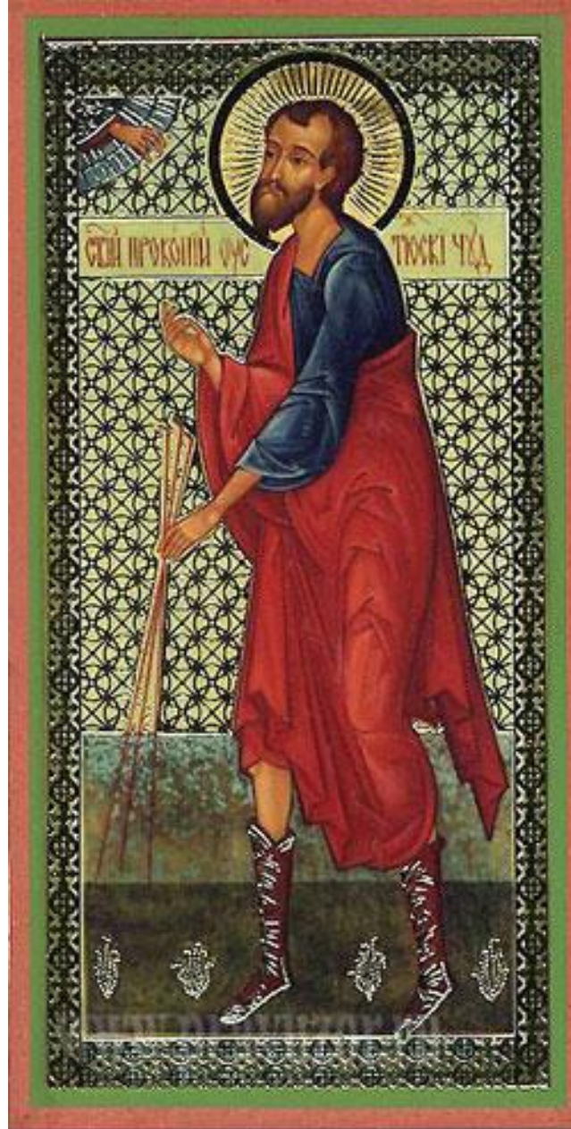
Праведный Прокопий Устюжский, Христа ради юродивый, чудотворец