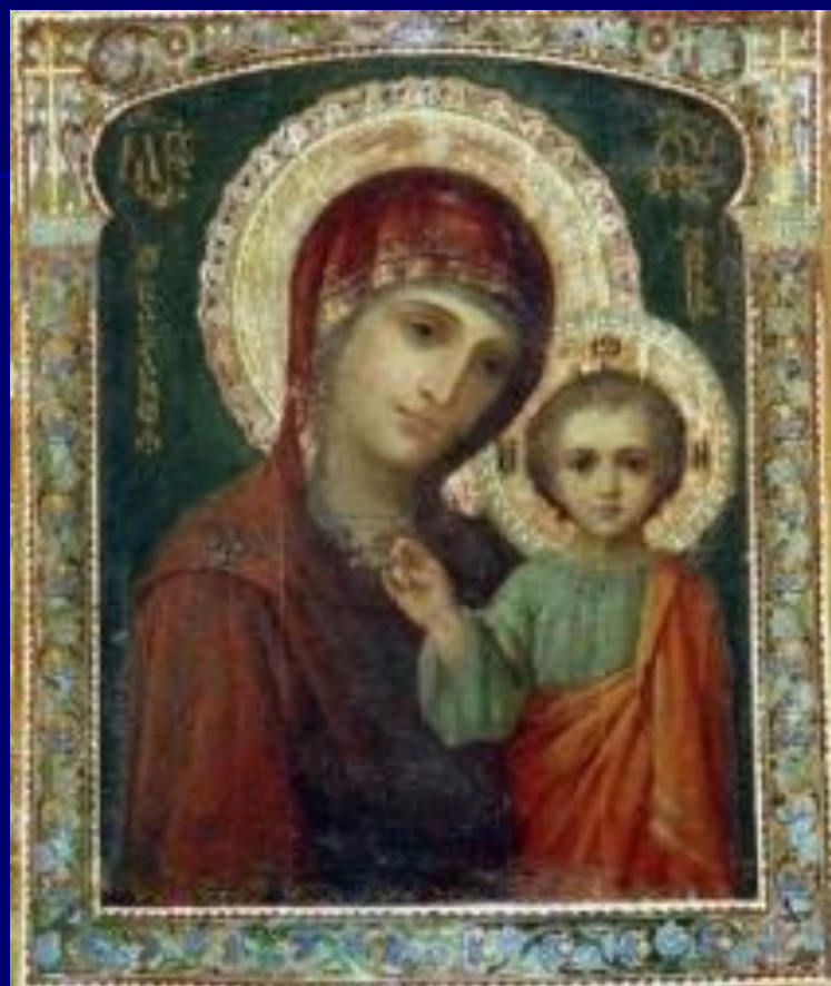
Икона Божий Матери.