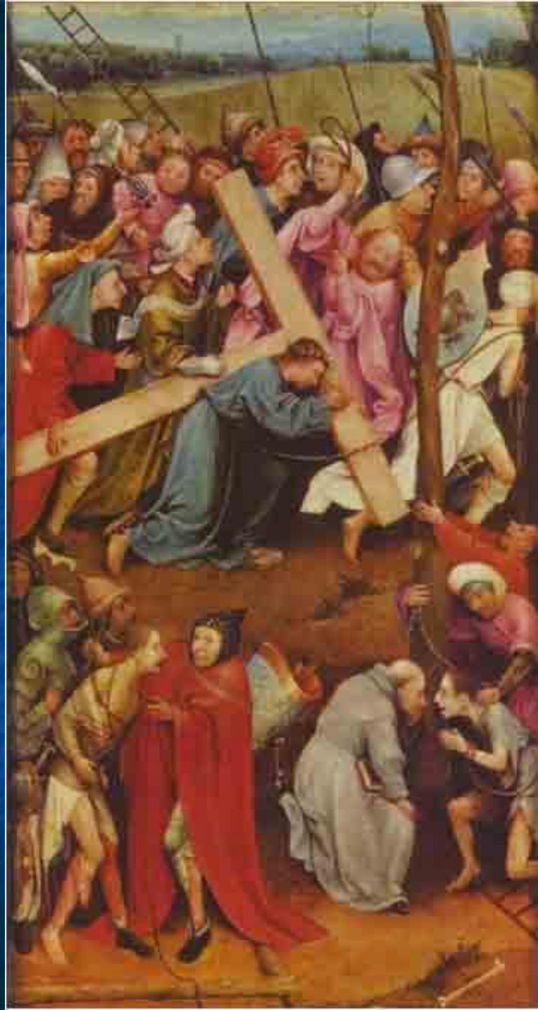
Несение креста. 1515-1516.