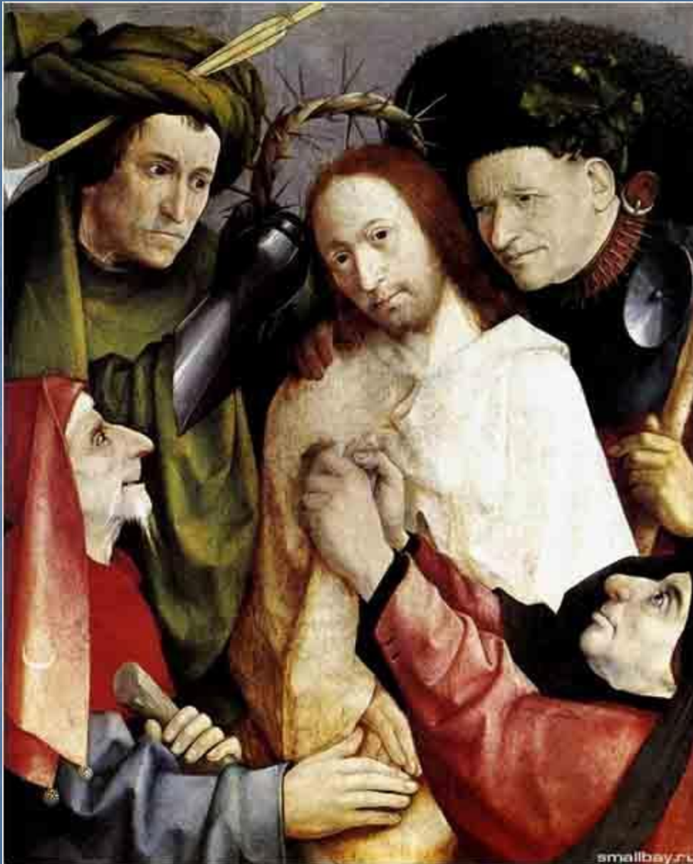
Увенчание терновым венком. 1490е – 1500е.