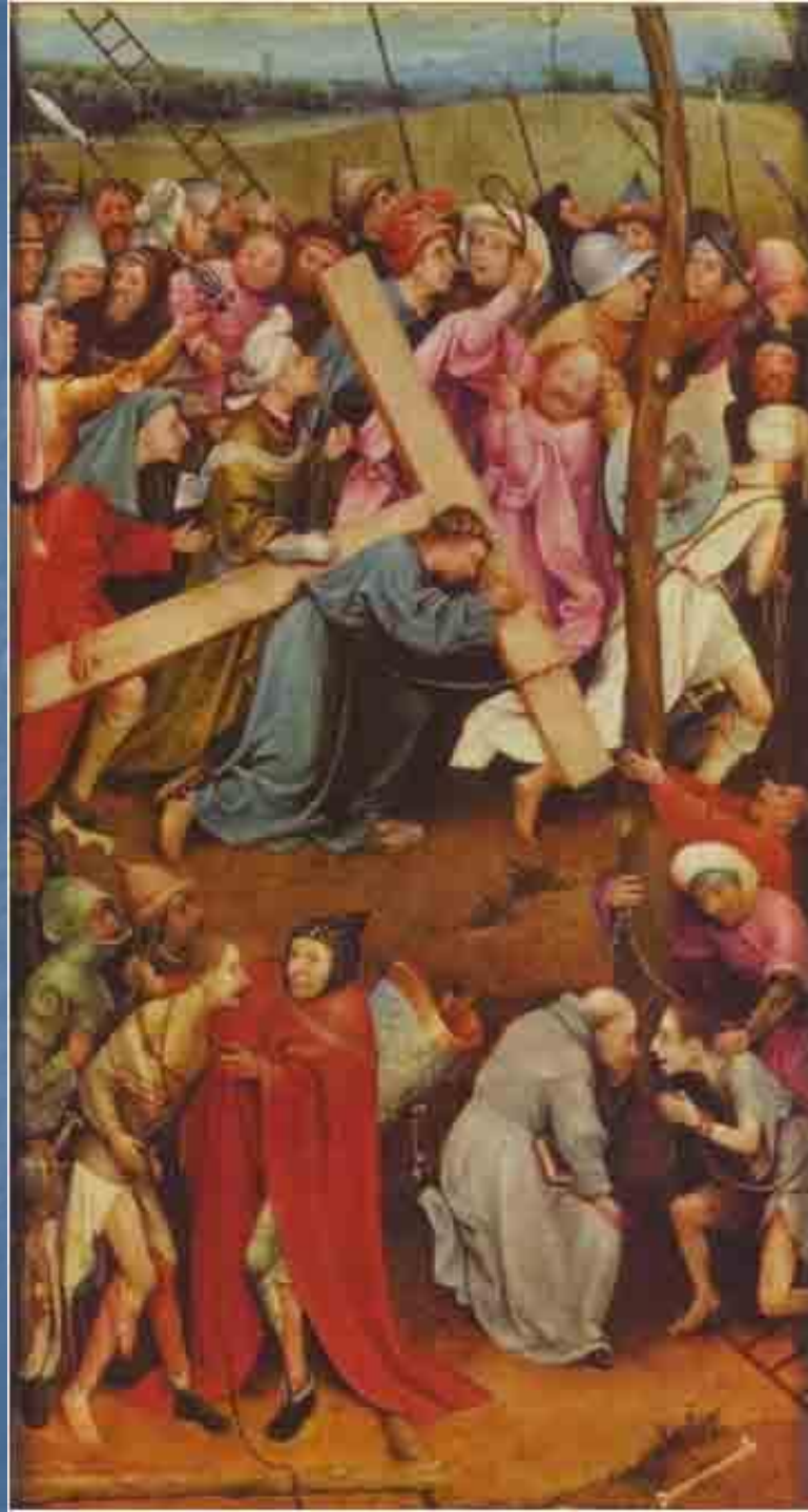
Несение креста. 1515-1516.