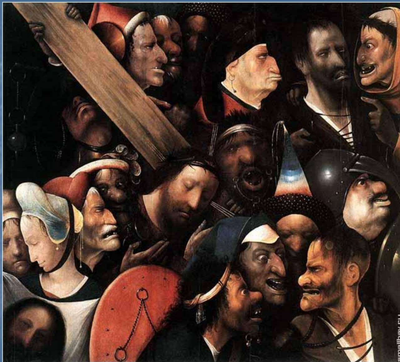
Несение креста. 1516.