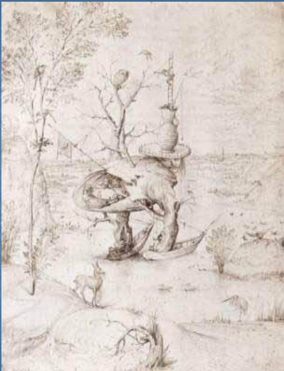
Человек-дерево в пейзаже