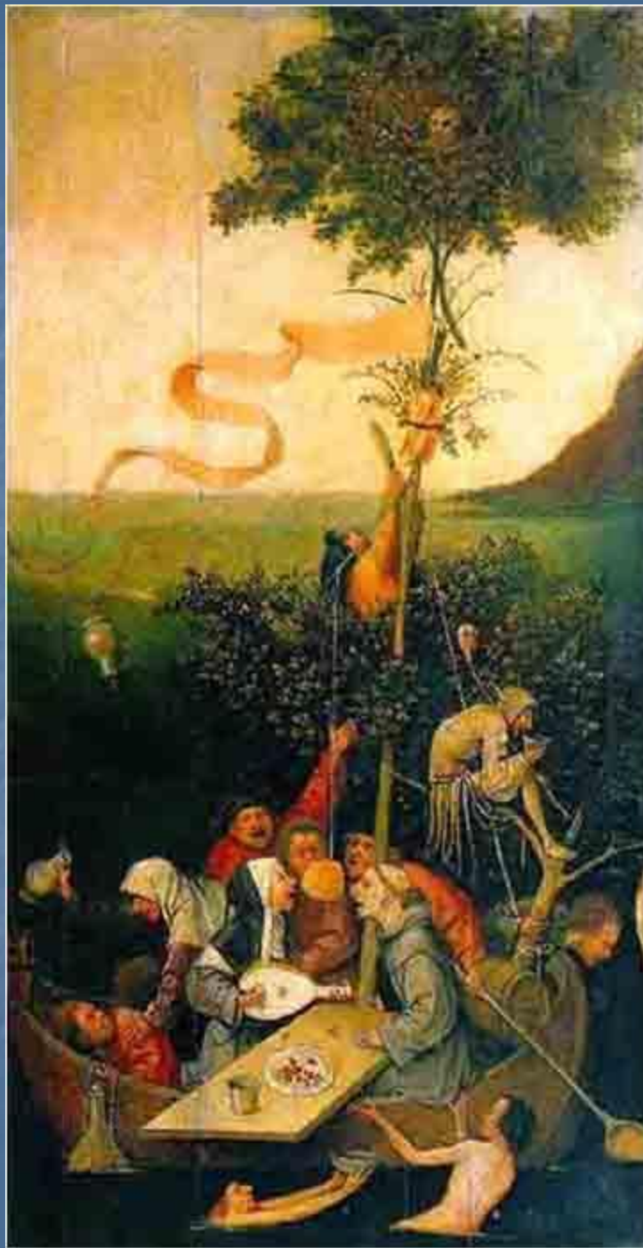
Корабль дураков. 1490е-1500е .