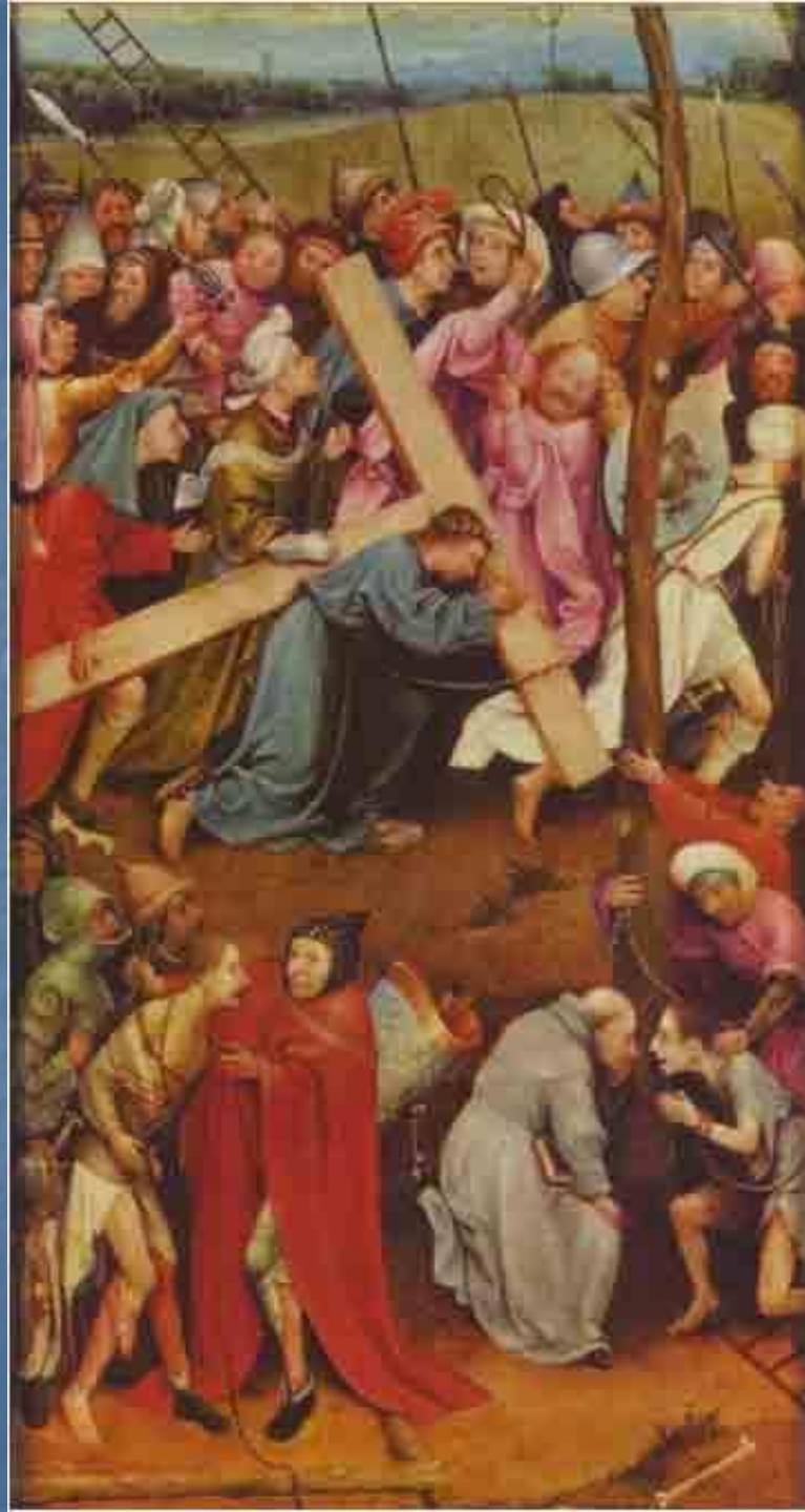
Несение креста. 1515-1516.