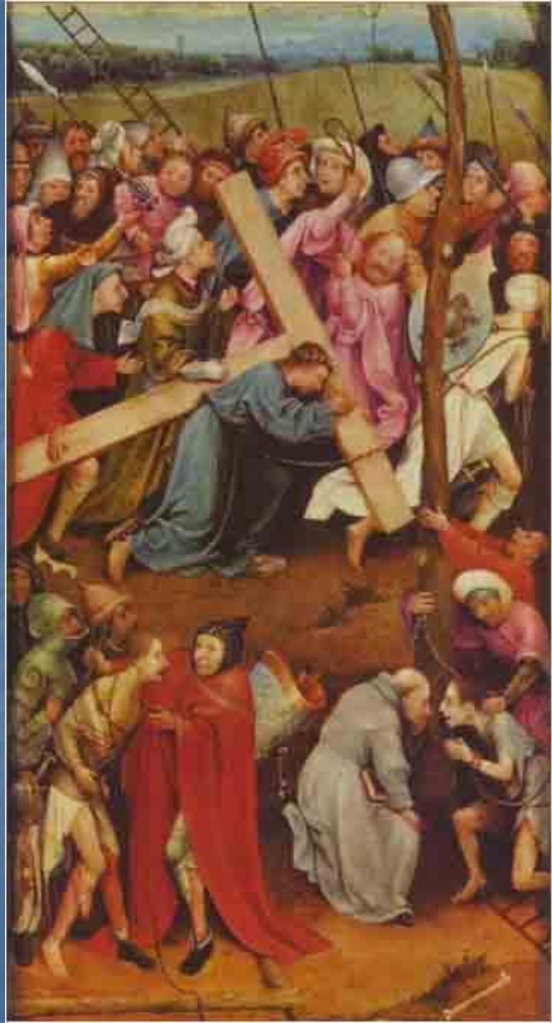
Несение креста. 1515-1516.