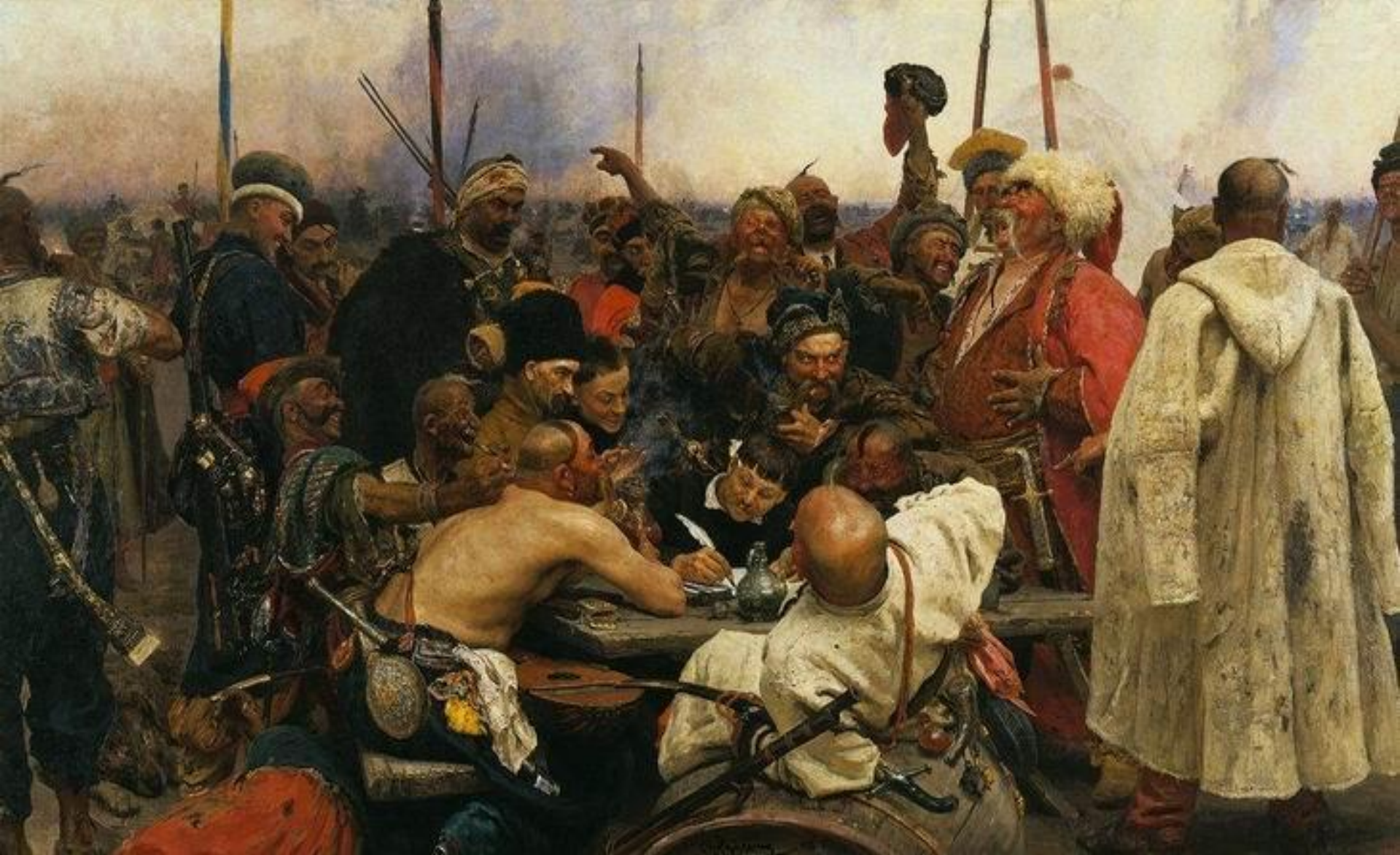
Русский художник Илья Ефимович Репин Запорожцы пишут письмо турецкому султану. 1880-1891