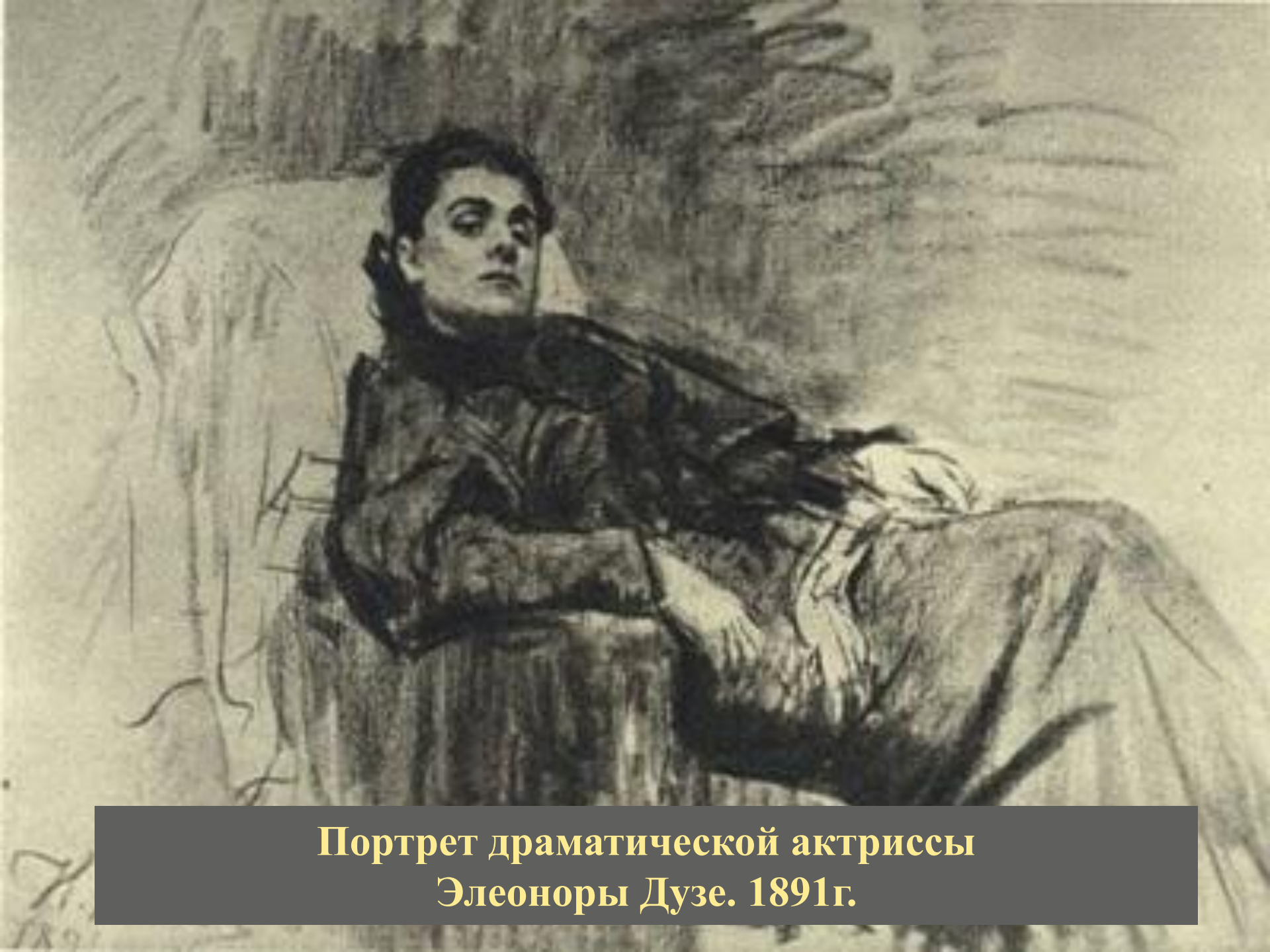
Портрет драматической актриссы Элеоноры Дузе. 1891г.