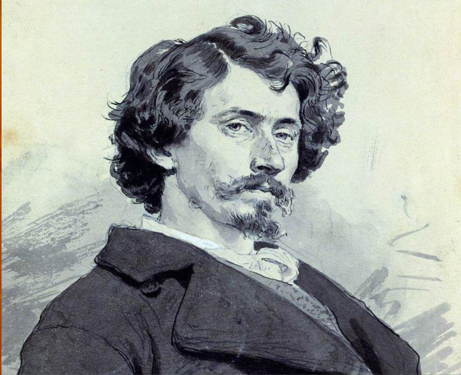
Автопортрет . 1878г.