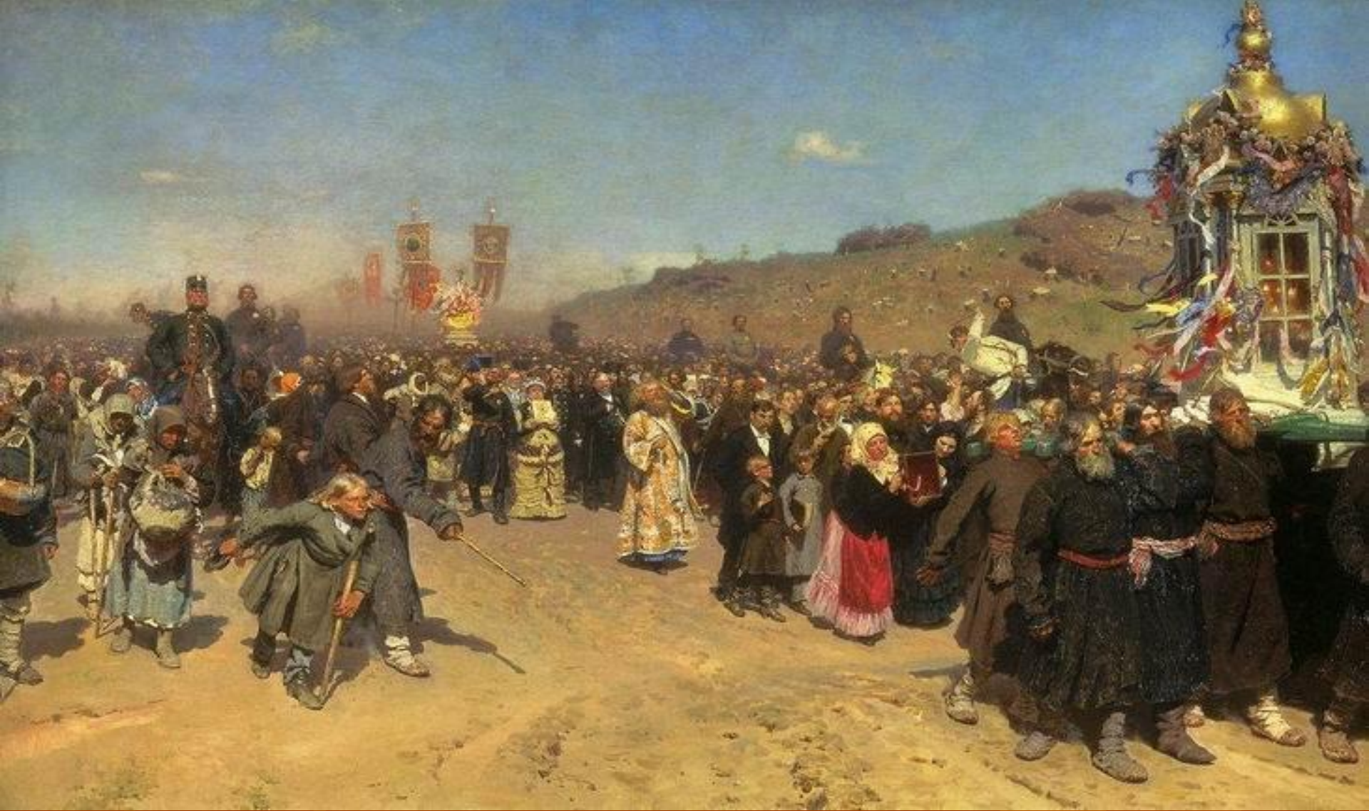
Русский художник Илья Ефимович Репин Крестный ход в Курской губернии