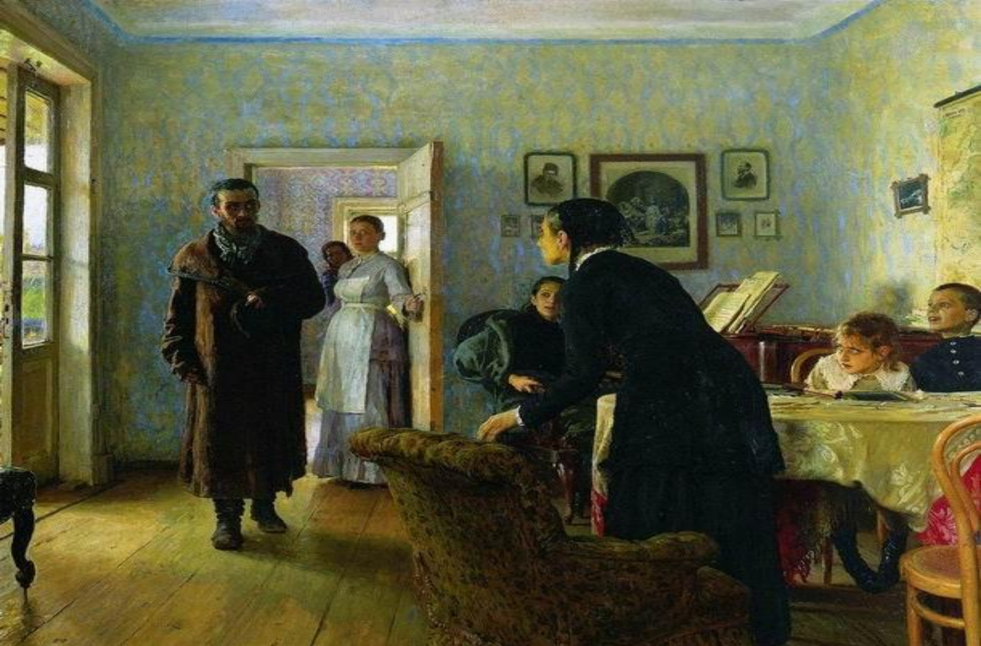
Русский художник Илья Ефимович Репин Не ждали, 1884 г.