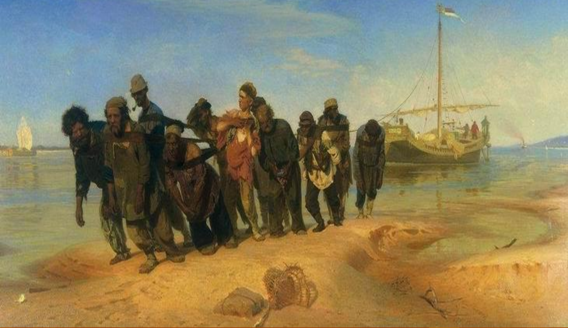
Русский художник Илья Ефимович Репин Бурлаки на Волге, 1873 г.