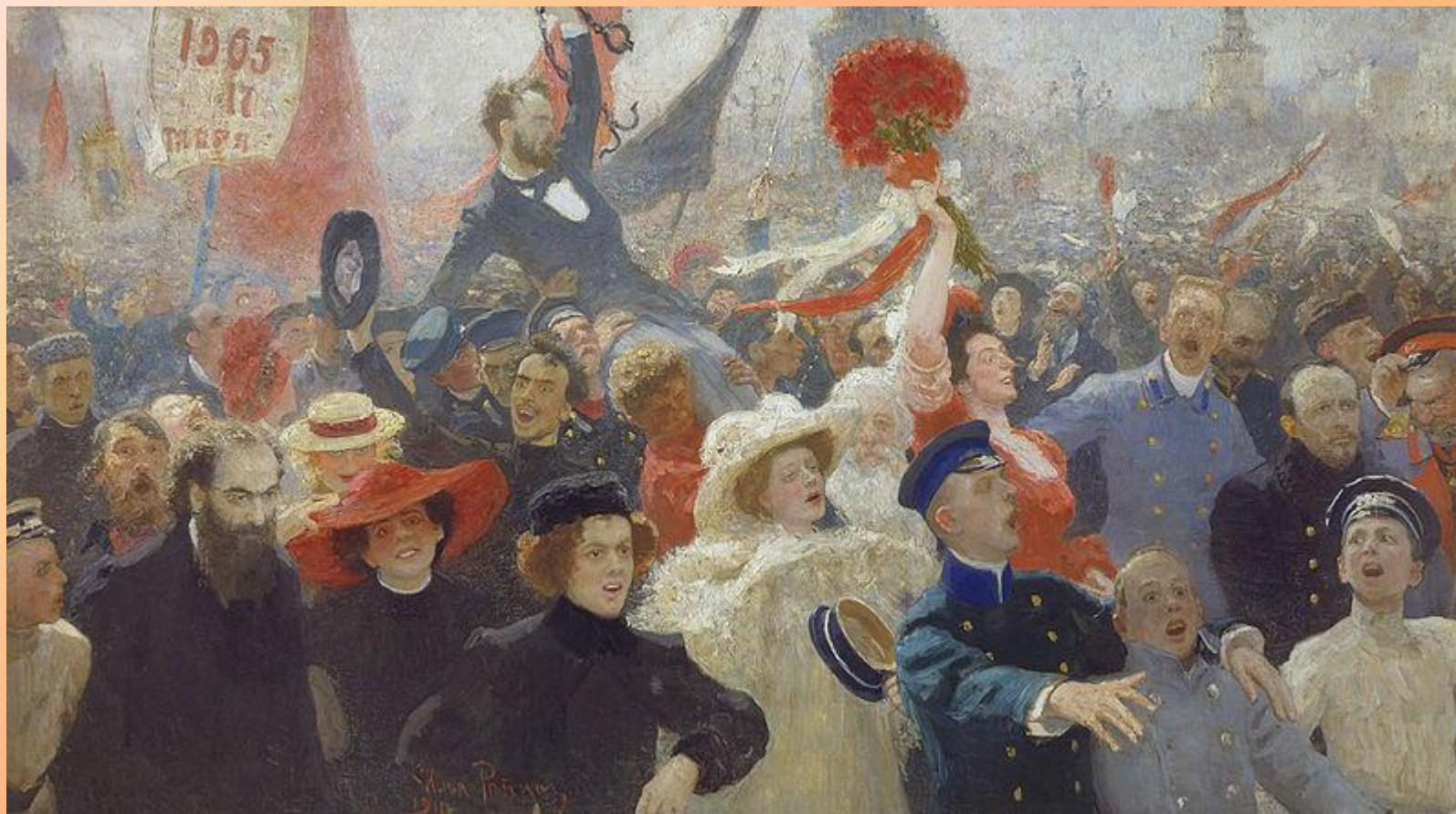
«Манифестация 17 октября 1905 года», 1906-1911