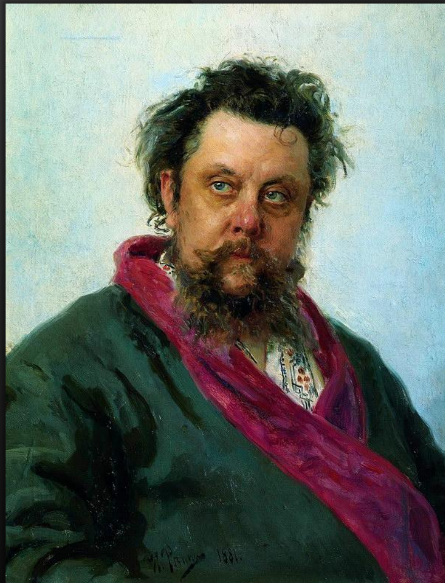
Илья Ефимович Репин. Портрет М. П. Мусоргского... 1881, ГТГ

В феврале 1881 года, во время обострения болезни, друзья поместили композитора в больницу. Здесь все его за четыре дня (работа шла с 14 по 17 марта) Репин успел создать этот гениальный портрет. Уже 28 марта 42-летнего Мусоргского не стало.