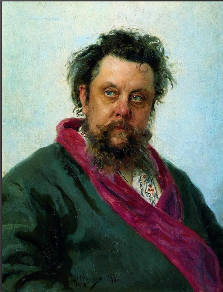
Илья Ефимович Репин. Портрет Модеста Петровича Мусоргского.... 1881, ГТГ