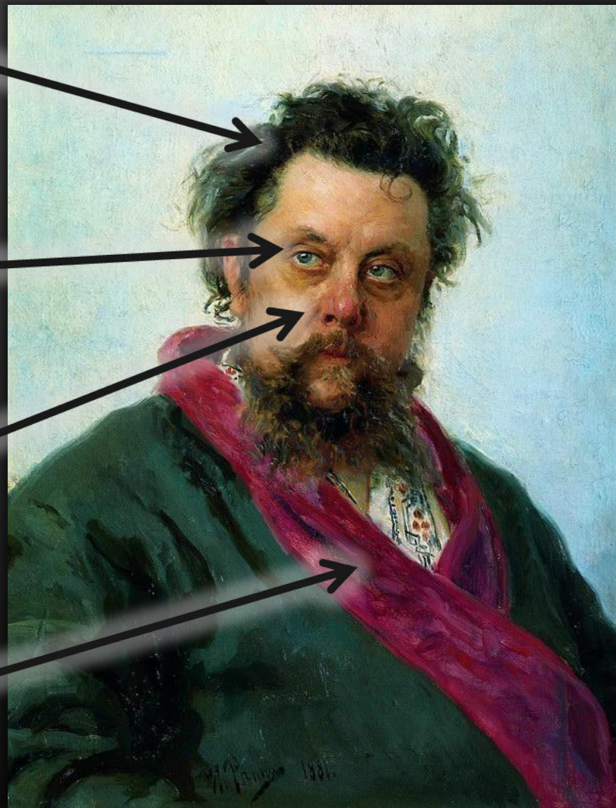
Илья Ефимович Репин. Портрет М. П. Мусоргского... 1881, ГТГ