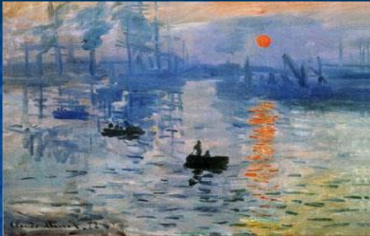
«Впечатления. Восход солнца.»