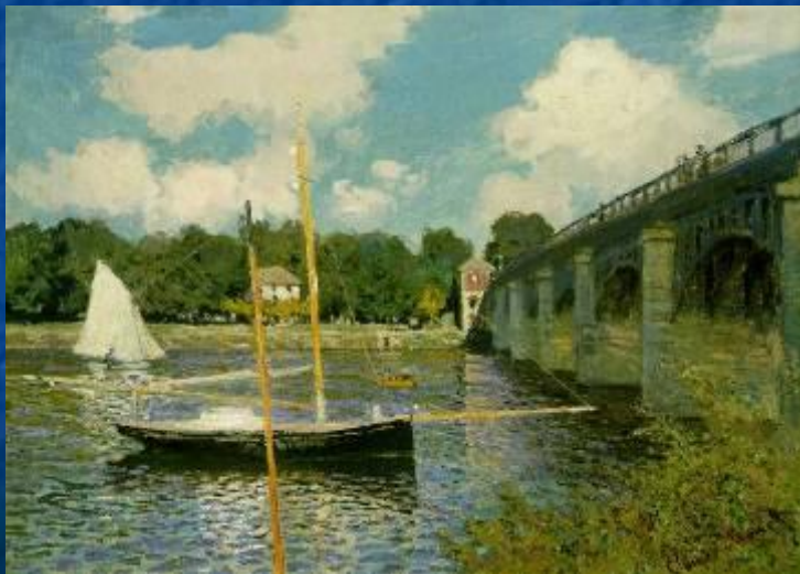
«Регата в Аржантее»

Одержимость Моне светом и цветом вылилась в многолетние исследования и эксперименты, целью которых было зафиксировать на холсте мимолетные, ускользающие оттенки природы.