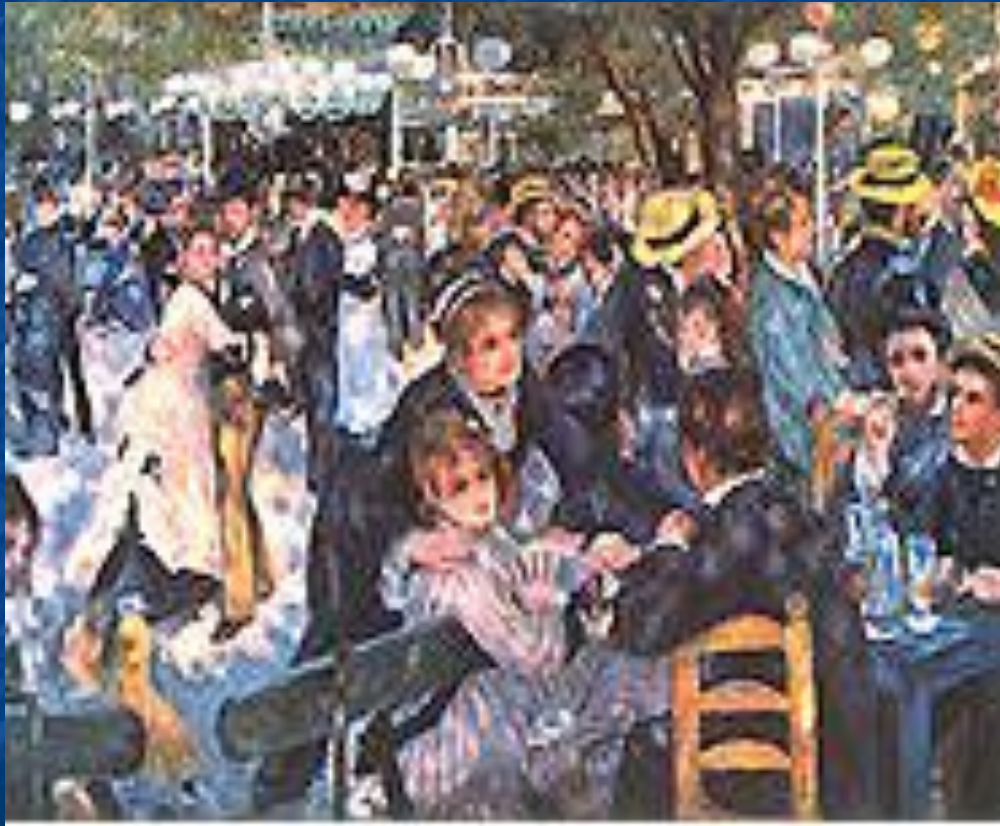
«Бал в Мулен де ла Галет». 1876.