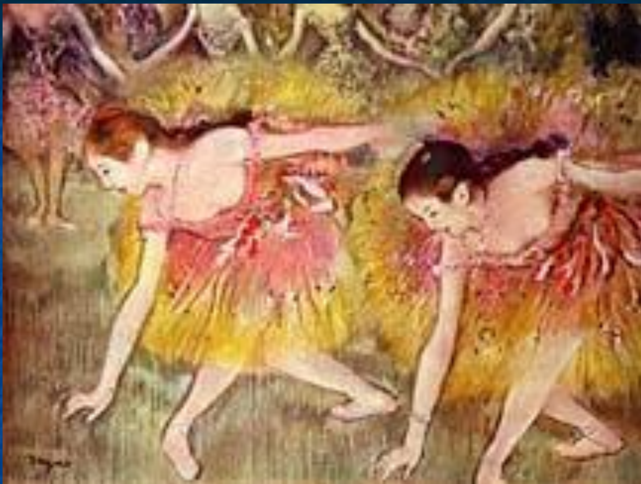
Танцовщицы на поклонах