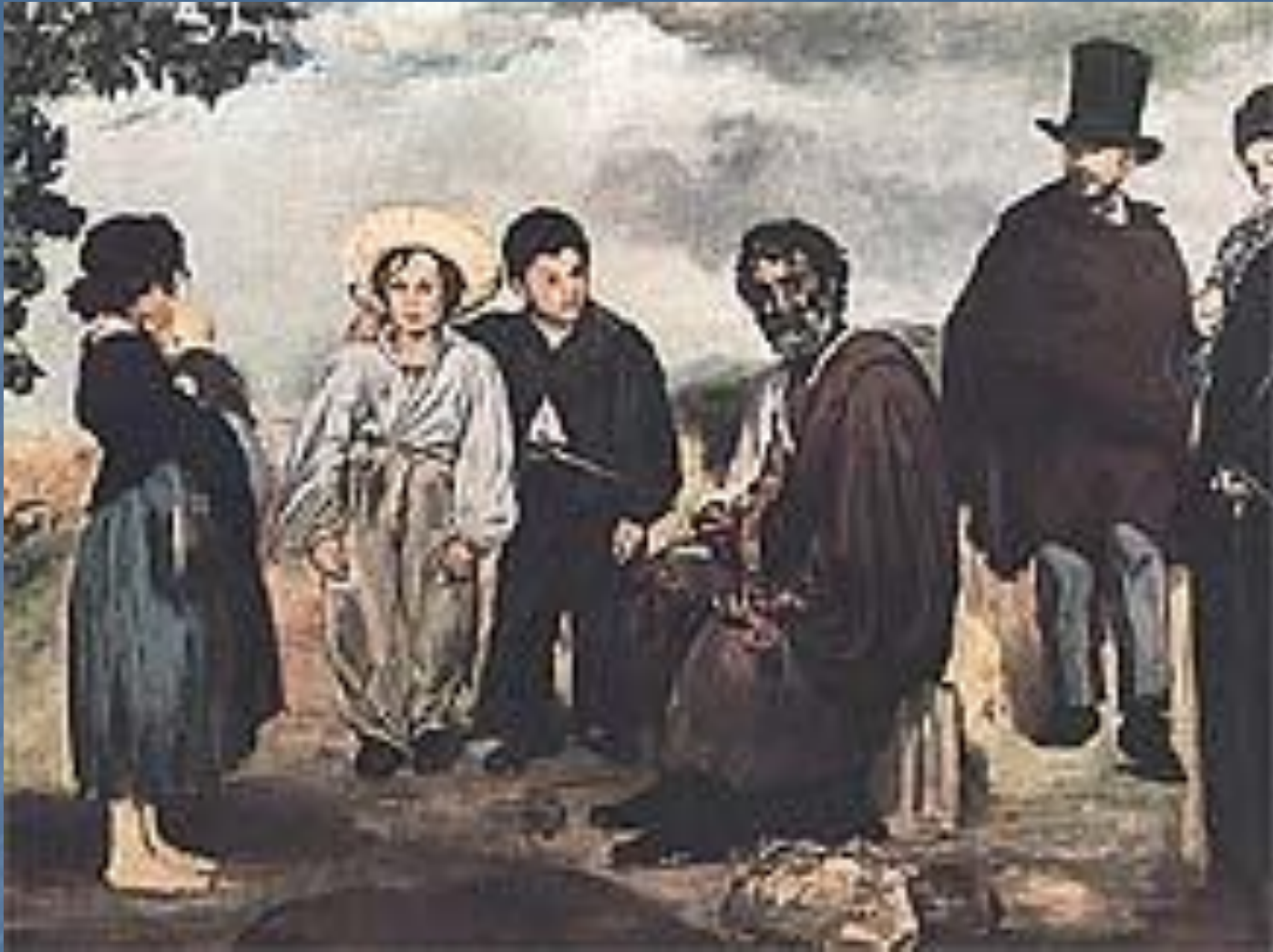
«Старый музыкант». 1862 год.