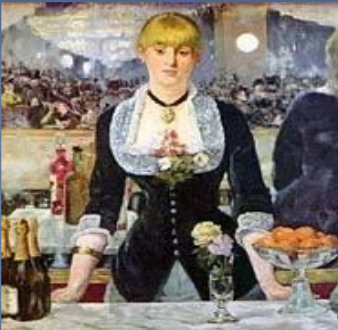
Бар в Фоли-Бержер.