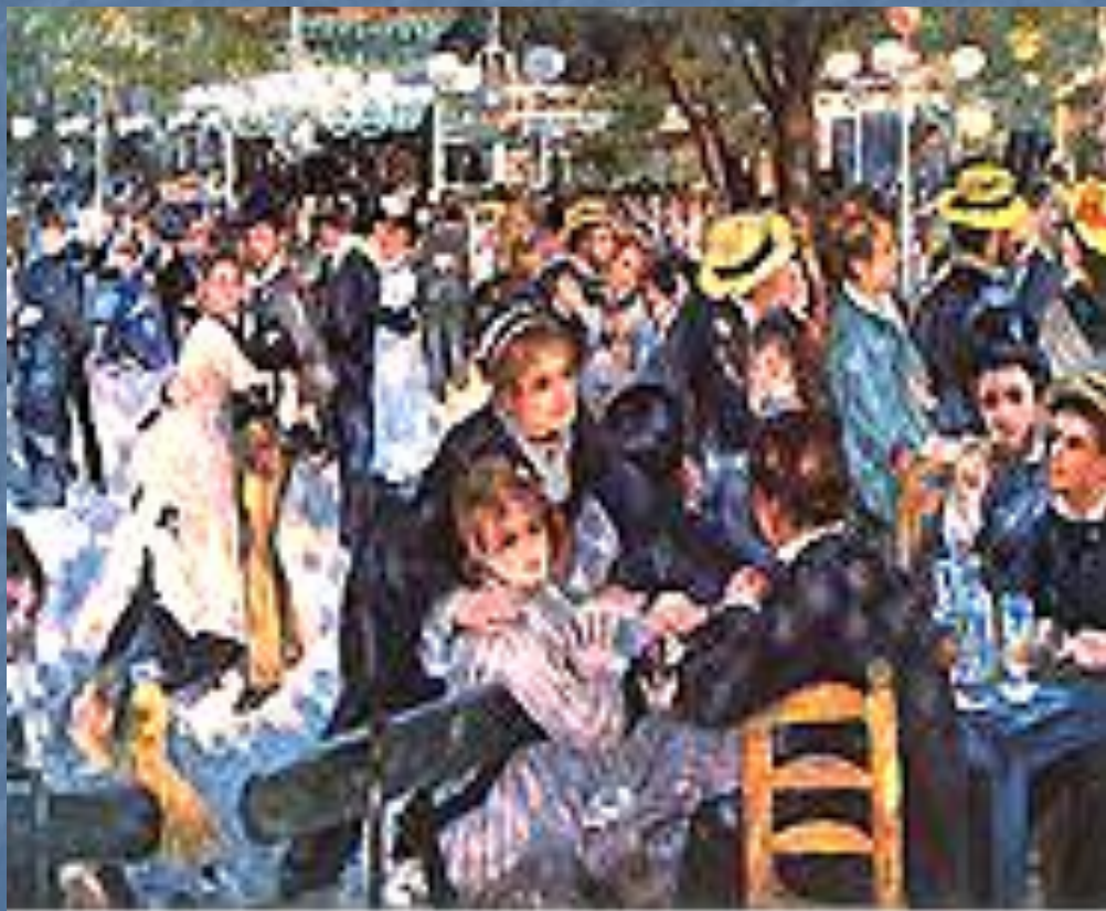
«Бал в Мулен де ла Галет». 1876.