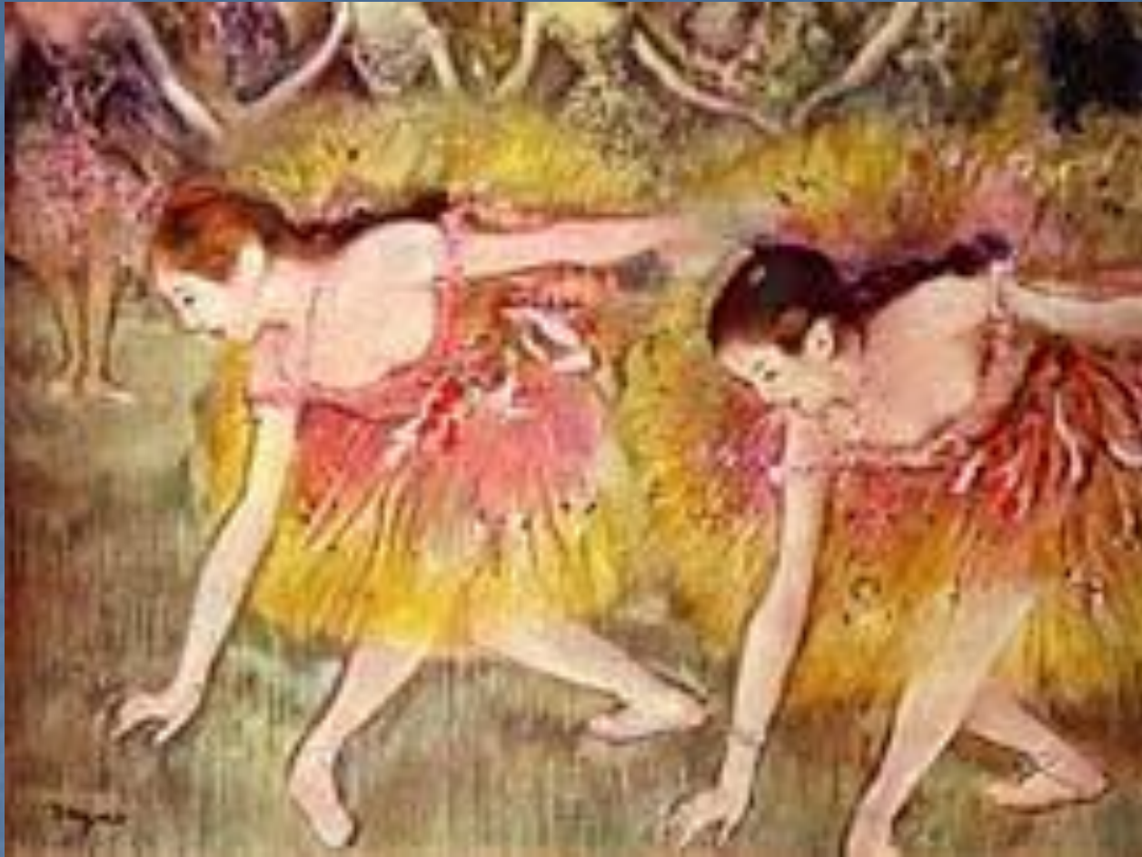
Танцовщицы на поклонах