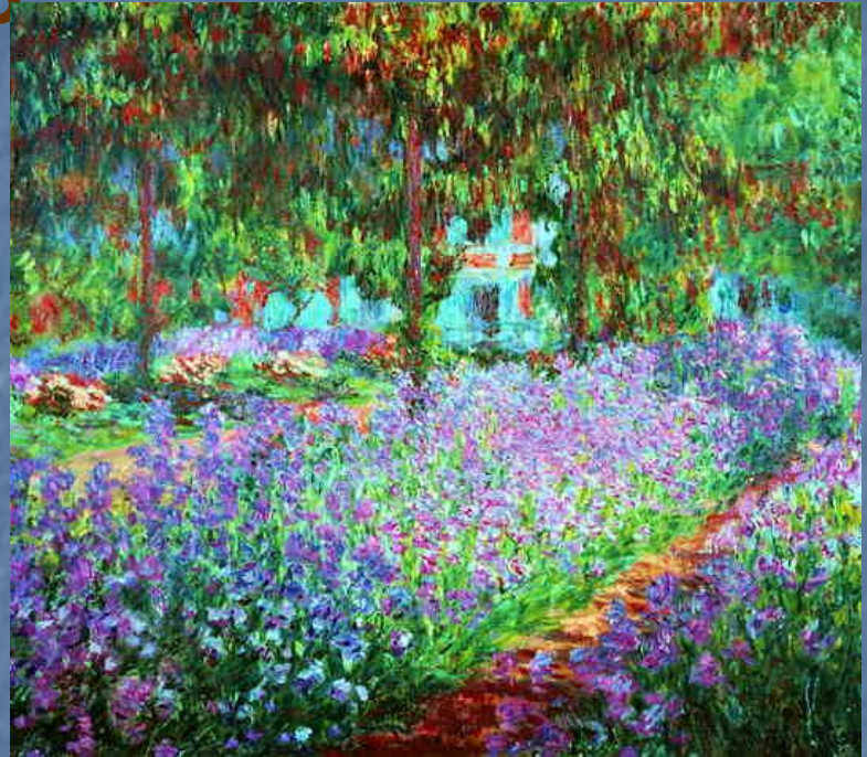
«Сад художника в Живерни»

Она представляла собой не гладкое письмо, с помощью тонких лессировок (так пишут ателье живописцев), а состояла из пастозных мазков.