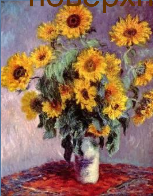
«Натюрморт с подсолнухами»