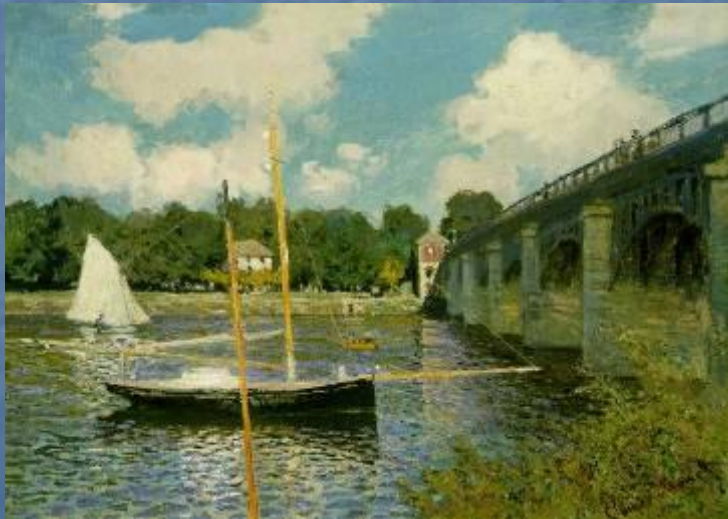
«Регата в Аржантее»

Одержимость Моне светом и цветом вылилась в многолетние исследования и эксперименты, целью которых было зафиксировать на холсте мимолетные, ускользающие оттенки природы.