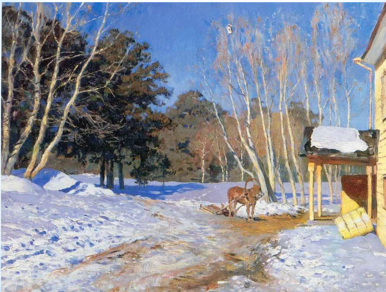
Исаак Левитан «Март»