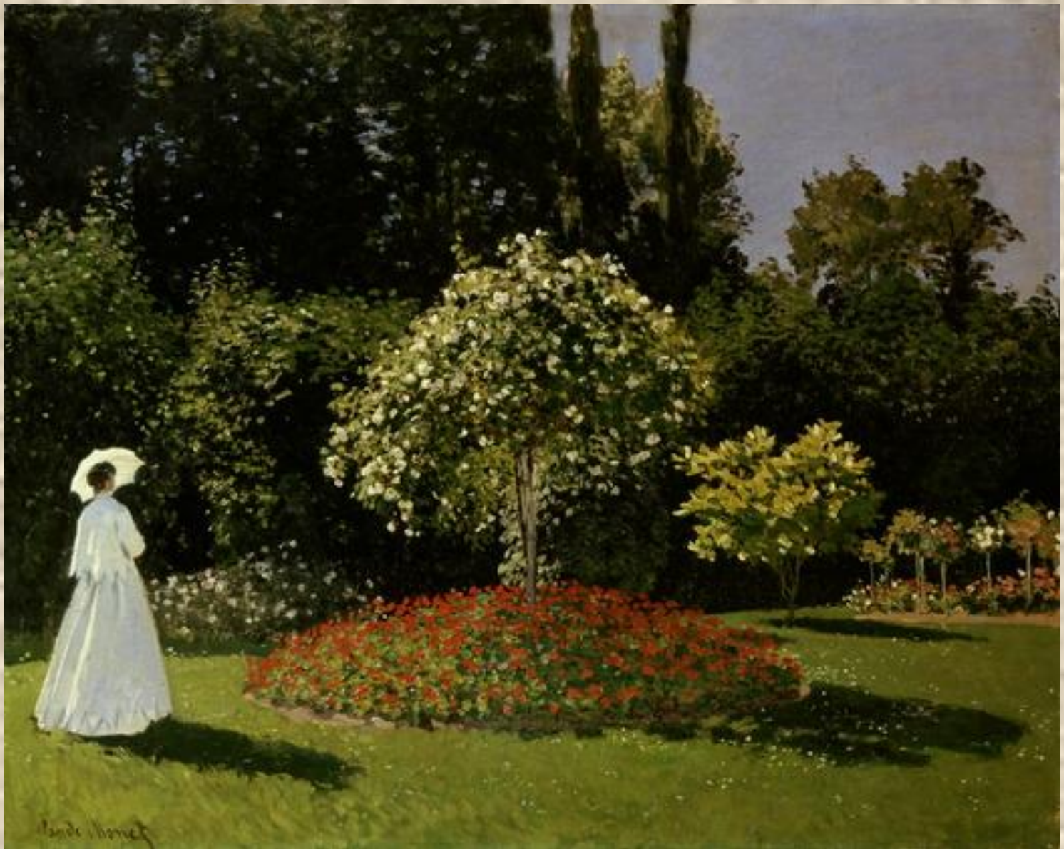
Дама в саду (Сент-Адресс). 1867.