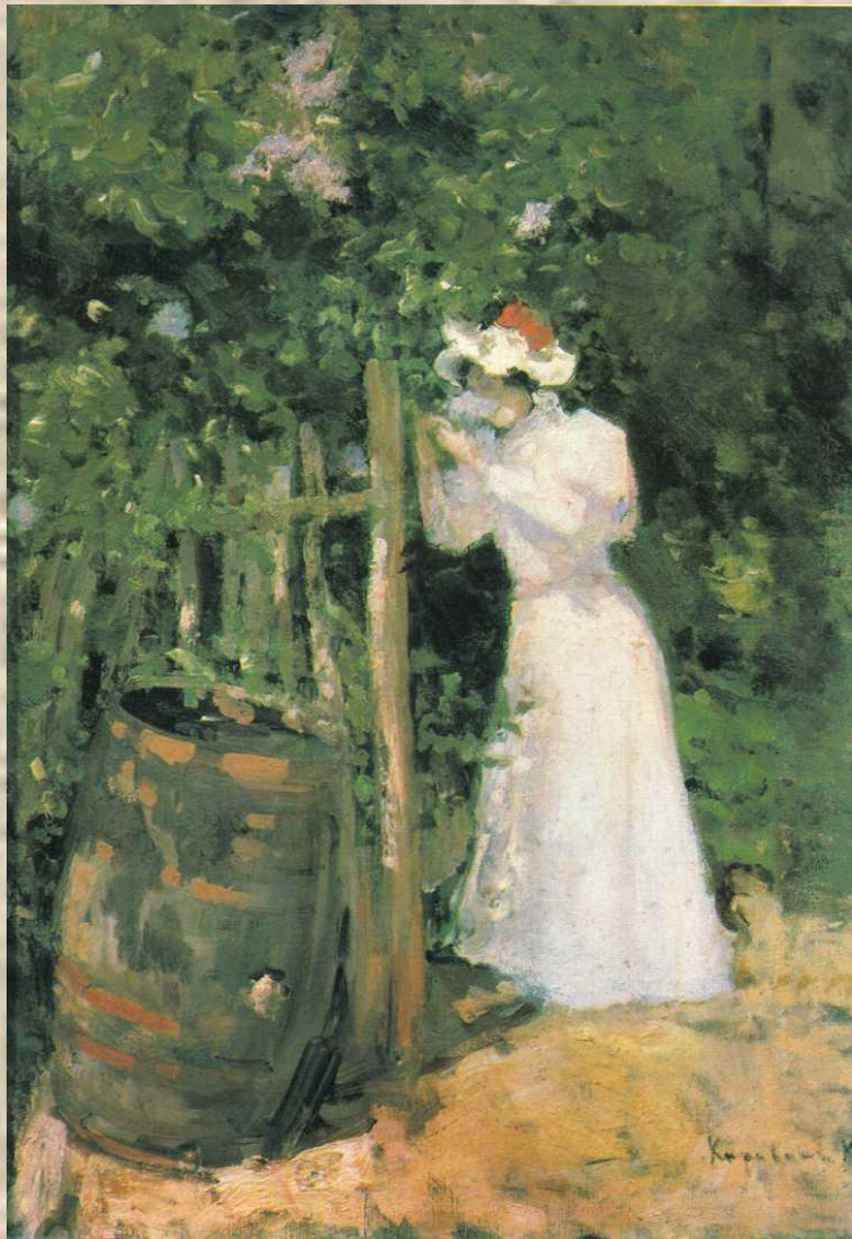
Летом. 1895 г.