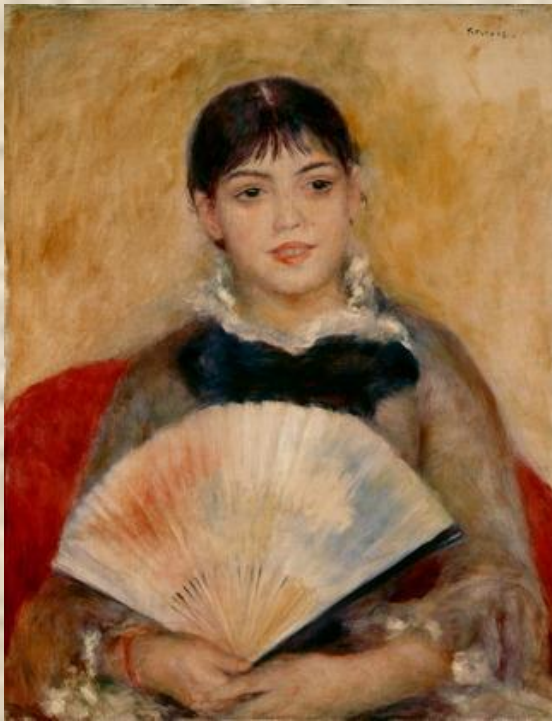
Девушка с веером. 1881

Портреты Ренуара всегда отмечены меткостью индивидуального сходства, мгновенно схваченным и точно зафиксированным душевным состоянием. В них нет глубины или сложности переживания, а есть убедительность характеристики, богатство сверкающих красок, свобода артистичного мазка. Ясный взгляд, нежность лица, естественная грациозность придают его образам праздничность, душевную чистоту.