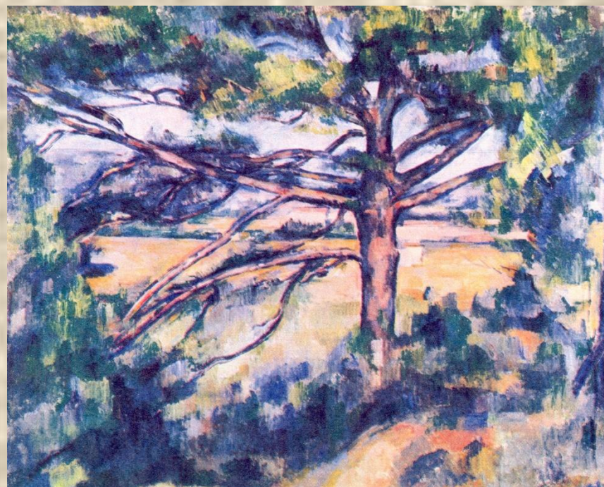
Поль Сезан. Большая сосна.