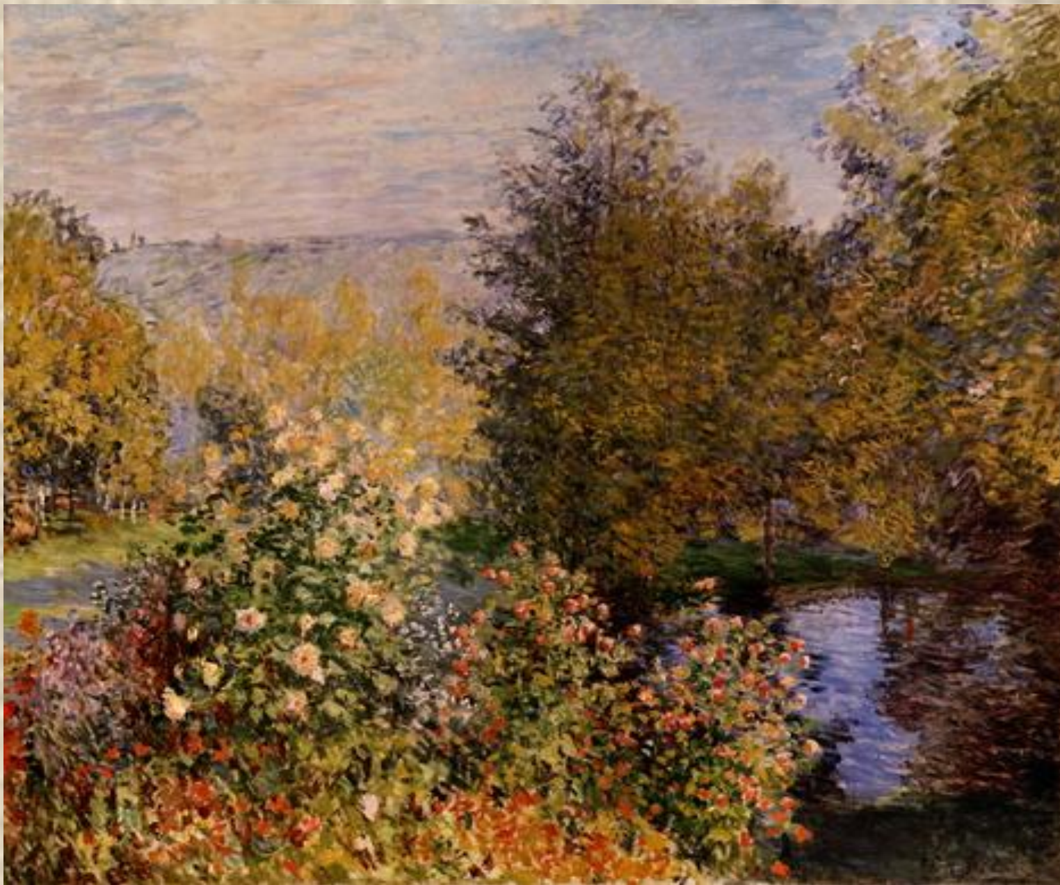
Уголок сада в Монжероне. 1876-1877.