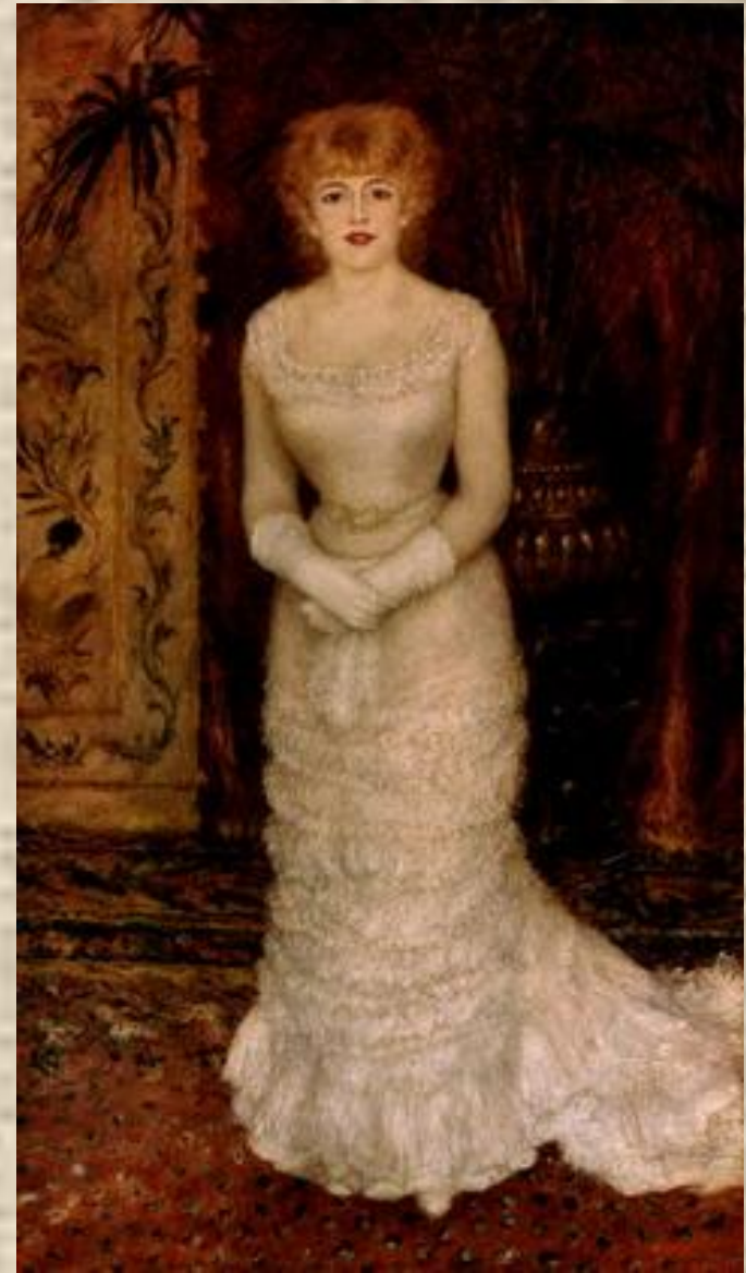
Портрет артистки Жанны Самари. 1878

Портреты Ренуара всегда отмечены меткостью индивидуального сходства, мгновенно схваченным и точно зафиксированным душевным состоянием. В них нет глубины или сложности переживания, а есть убедительность характеристики, богатство сверкающих красок, свобода артистичного мазка. Ясный взгляд, нежность лица, естественная грациозность придают его образам праздничность, душевную чистоту.