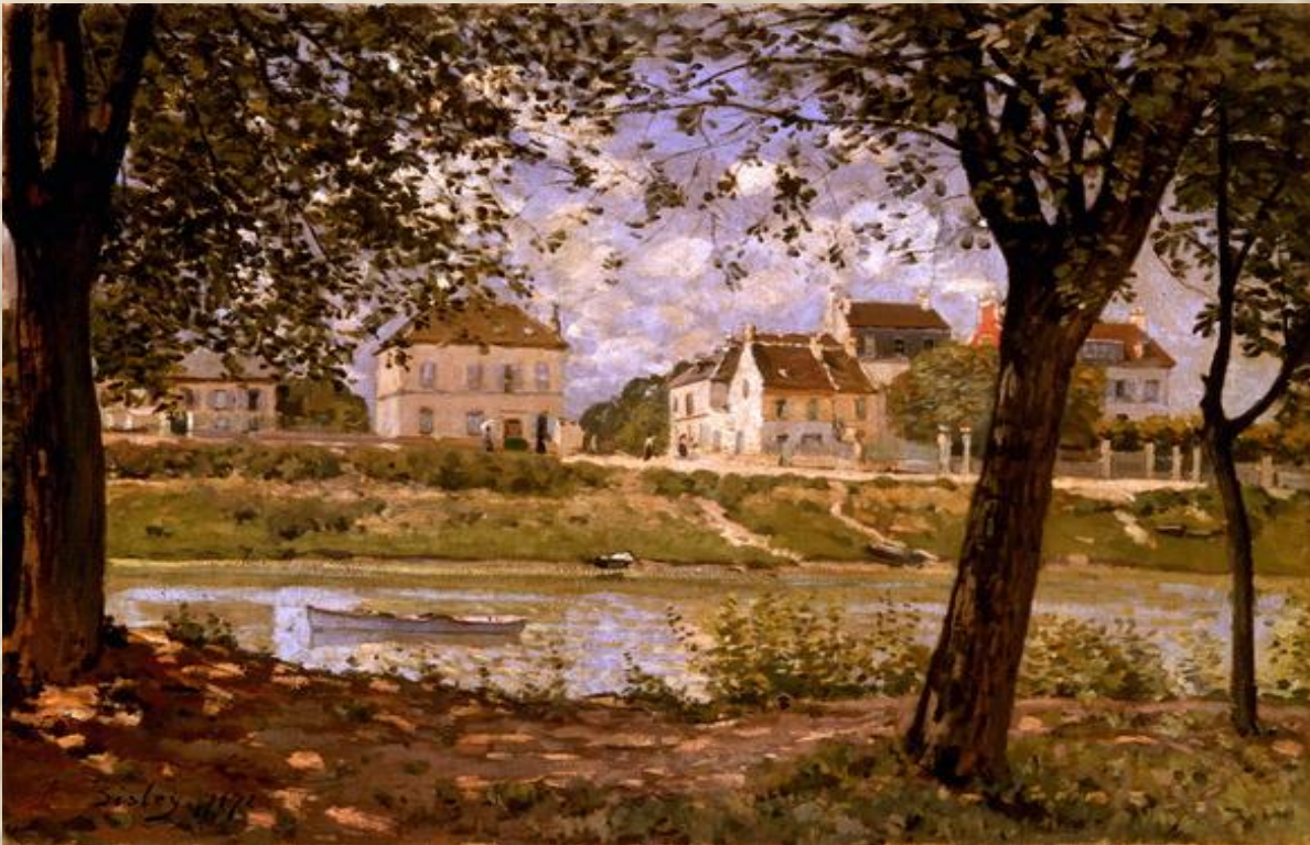
Альфред Сислей. Городок Вильнев-ла- Гаренн на Сене. 1872.

Импрессионизм (фр. впечатление) - направление в литературе и живописи, возникшее во второй половине XIX века сначала во Франции, а затем и в других странах. Импрессионисты стремились передать непосредственное впечатление, мельчайшие оттенки личных переживаний, ощущений, настроений.