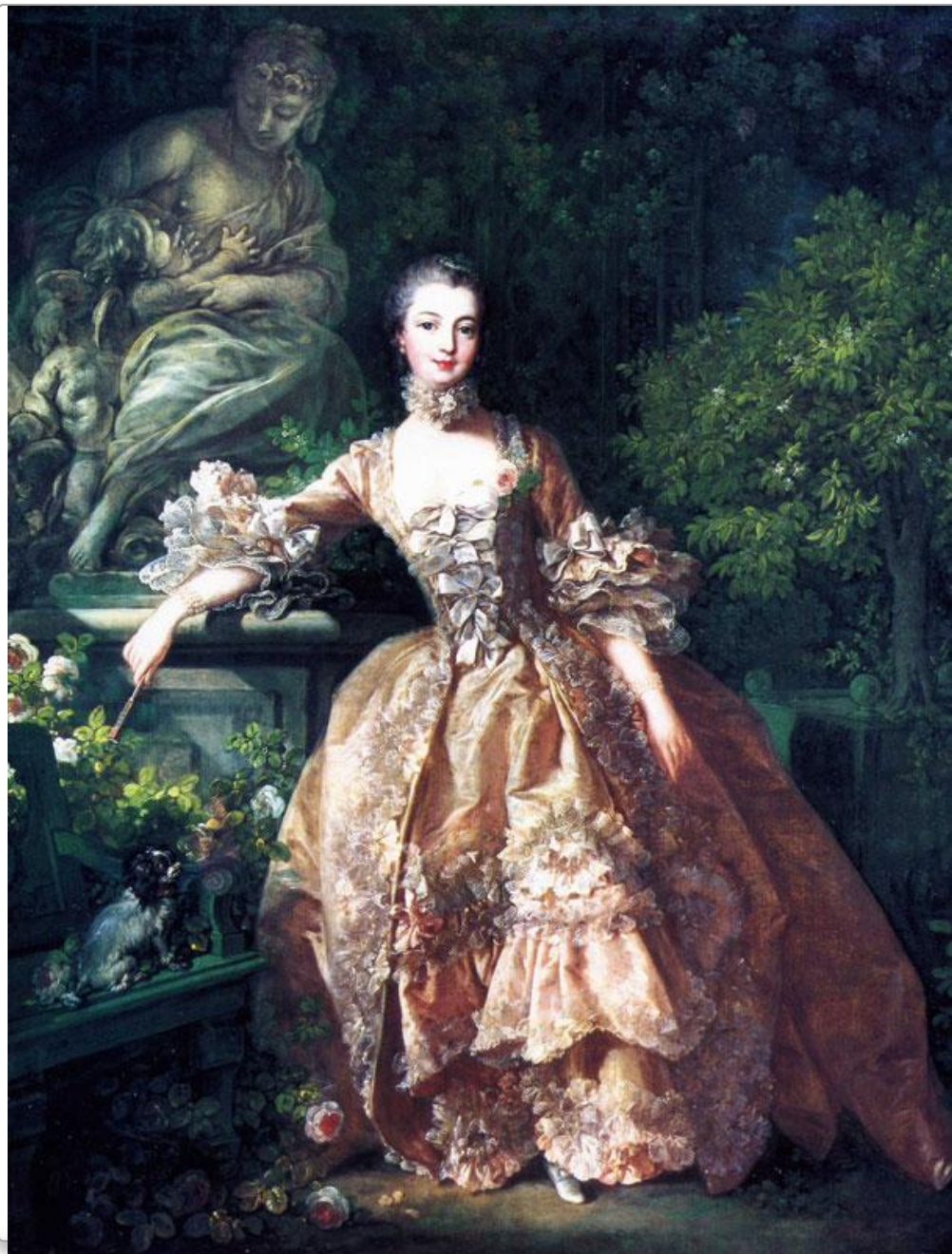
Ф. Буше Портрет мадам де Помпадур