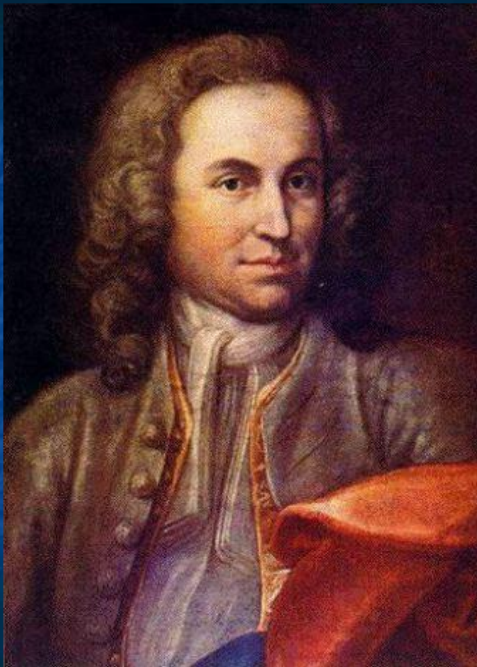
ИОГАНН СЕБАСТЬЯН БАХ (1685-1750)