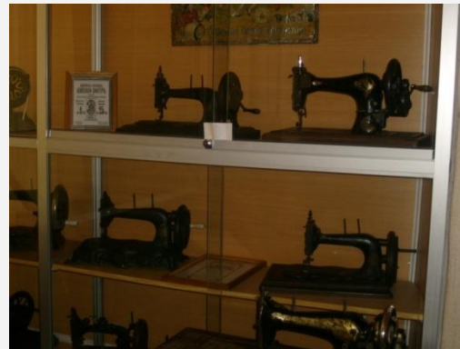
Из коллекции швейных машинок