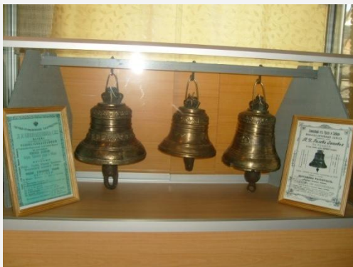
Из коллекции колокольчиков