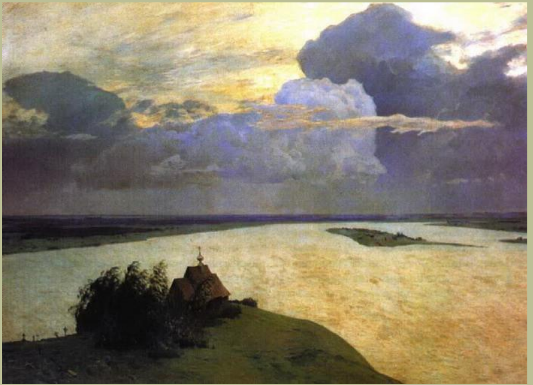
Исаак Ильич Левитан. «Над